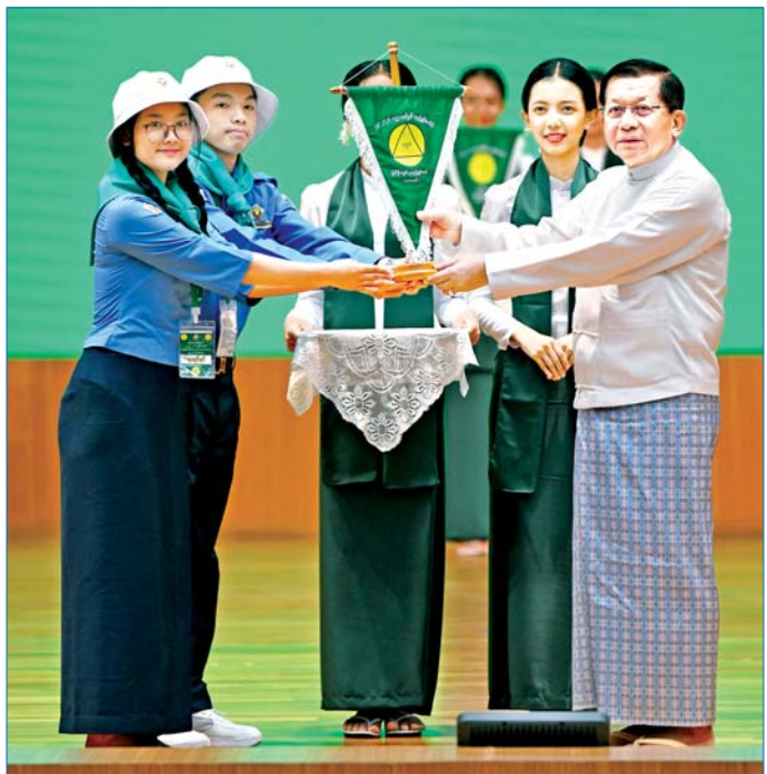
ပြည်ထောင်စုသမ္မတမြန်မာနိုင်ငံတော် နိုင်ငံတော်သမ္မတ ဦးမင်းအောင်လှိုင် ၂၀၂၆ ခုနှစ် လူရည်ချွန် စခန်းအလိုက် အထိမ်းအမှတ်အလိုက် နဝမတန်းလူရည်ချွန်မောင်မယ်များထံ ပေးအပ်စဉ်။

တို့ရရှိထားသည့် လူရည်ချွန်ဟု သည့် ဂုဏ်ပုဒ်၊ အဆင့်အတန်းနှင့် အညီ ပြောဆိုနေထိုင်ပြုမူ လုပ်ကိုင်မှုများကို မြှင့်တင်နိုင် အောင် ကြိုးစားသွားကြရမည်ဖြစ် ကြောင်း၊ “အတ္တနှင့်ပရ” မျှတမှု ရှိအောင် ကျင့်ကြံနေထိုင်ကြ ရန်နှင့် ခေတ်စနစ်၏တိုးတက်မှု နည်းလမ်းများကို အမြဲမပြတ် ရှာဖွေနေရန် လိုအပ်သကဲ့သို့ မြန်မာမှု၊ မြန်မာ့ဟန်၊ မြန်မာ့ ရိုးရာယဉ်ကျေးမှု လေ့စရိုက်များ မှေးမှိန်ပျောက်ကွယ်မသွားအောင် လည်း ထိန်းသိမ်းစောင့်ရှောက် သွားကြရန် လိုအပ်ကြောင်း၊ လူငယ်ဘဝတွင် ရှိသင့်သည့် ကျင့်ဝတ်များဖြစ်သည့် သားသမီး ကျင့်ဝတ်၊ တပည့်ကျင့်ဝတ်များကို လိုက်နာနေထိုင်ကြရန်နှင့် မိဘ၊ ဆရာသမားတို့ကို ရိုသေလေးစား ပြီး ဘာသာတရား၏ အဆုံးအမ နှင့်အညီ ကိုယ်ချင်းစာမှု၊ သည်းခံ ခွင့်လွှတ်မှုဟူသည့် အခြေခံစိတ် ဓာတ်ကောင်းများ မွေးမြူကြရမည် ဖြစ်ကြောင်း၊ အများကလေးစား အတုယူရမည့် စံပြုပုဂ္ဂိုလ်များဖြစ် အောင် အပတ်တကုတ် ကြိုးစား အားထုတ်ကြရန် မှာကြား လိုကြောင်း။