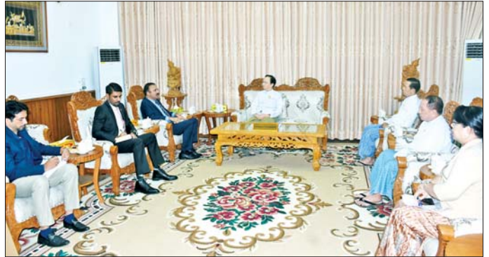
တွေ့ဆုံပွဲသို့ ကျန်းမာရေးဝန်ကြီးဌာန ဒုတိယ သံရုံးမှ ကိုယ်စားလှယ်များ တက်ရောက်ခဲ့ကြောင်း ဝန်ကြီးနှင့် ညွှန်ကြားရေးမှူးချုပ်များ ပါကစ္စတန်နိုင်ငံ သိရသည်။ သတင်းစဉ်

အပြန်အလှန်စေလွှတ်၍ အတွေ့အကြုံဖလှယ်ရေး၊ ဆေးဘက်ဆိုင်ရာ သုတေသနလုပ်ငန်းများ ပူးပေါင်း ဆောင်ရွက်ရေး၊ နှစ်နိုင်ငံဆေးတက္ကသိုလ်များအကြား ပညာရပ်ဆိုင်ရာပူးပေါင်းဆောင်ရွက်ရေး၊ ပါကစ္စတန် နိုင်ငံမှ ဆေးဝါးနှင့်ခွဲစိတ်ခန်းပစ္စည်းများ တင်သွင်း လျက်ရှိသည့်ကိစ္စရပ်များနှင့် မြန်မာနိုင်ငံတွင် ဆေးဝါး စက်ရုံများတည်ဆောက်၍ ရင်းနှီးမြှုပ်နှံနိုင်ရေးဆိုင်ရာ ကိစ္စရပ်များကို ချစ်ကြည်ရင်းနှီးစွာ အမြင်ချင်းဖလှယ် ဆွေးနွေးခဲ့ကြသည်။