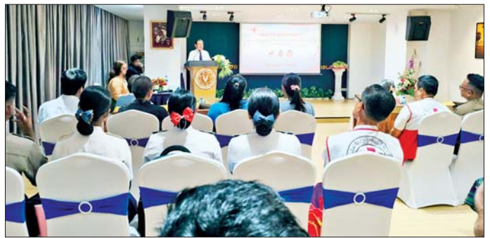
မြို့နယ်၊ ဒေါပုံမြို့နယ်၊ သယ်နန်း ကျွန်းမြို့နယ်တို့မှ ကြက်ခြေနီ စေတနာလုပ်အားရှင် ၂၅ ဦး တက်ရောက်ခဲ့ကြောင်း သိရသည်။ ကျင်းပခြင်း မြို့နယ်တို့မှ ကြက်ခြေနီ စေတနာလုပ်အားရှင် ၂၅ ဦး တက်ရောက်ခဲ့ကြောင်း သိရသည်။ သတင်းစဉ်

နှင့် ဒုတိယ ဥက္ကဋ္ဌ ဒေါက်တာ တင်တင်လေးတို့ တက်ရောက် အမှာစကား ပြောကြားသည်။ ရန်ကုန်တိုင်းဒေသကြီးမှ စီမံချက် မြို့နယ် ၁၀ မြို့နယ်ရှိ ကြက်ခြေနီ စေတနာလုပ်အားရှင် များကို သွေးလှူရှင်အသစ် စုဆောင်းခြင်းနှင့် ရေရှည် သွေးလှူရှင်များ ဖြစ်လာစေရန် စည်းရုံး လှုံ့ဆော်ခြင်းဆိုင်ရာ စွမ်းဆောင်ရည်များကို မြှင့်တင် ပေးရန် ထိုမှတစ်ဆင့် ဆေးအန္တရာယ် ကင်းရှင်းသော သွေးကို ပုံမှန်ရရှိ စေရန်နှင့် ကျန်းမာရေးနှင့် ညီညွတ် သော အမူအကျင့်များကို မြှင့်တင် ပေးခြင်းဖြင့် လူထု၏ကျန်းမာရေး အဆင့်အတန်းကို တိုးတက် ကောင်းမွန်လာစေရန် ရည်ရွယ်၍ သင်တန်းကို ကျင်းပခြင်းဖြစ် သည်။ အဆိုပါသင်တန်းကို ပထမ အကြိမ်အဖြစ် ဧပြီ ၂၇ ရက်မှ ၂၉ ရက်အထိကျင်းပရာ စီမံချက် မြို့နယ် ငါးမြို့နယ်ဖြစ်သော ဒဂုံမြို့ သစ်(ဆိပ်ကမ်း)မြို့နယ်၊ ဒဂုံမြို့သစ် (မြောက်ပိုင်း)မြို့နယ်၊ လှည်းကူး