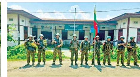
တပ်မတော်စစ်ကြောင်းများက အကြမ်းဖက်သောင်းကျန်းသူပူးပေါင်းအဖွဲ့များ ယာယီစိုးမိုးထားသည့် မော်လမြူအား ပြန်လည်သိမ်းပိုက်ရရှိစဉ်။