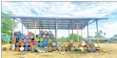
မော်လမြူသို့ ချီတက်တိုက်ခိုက်သိမ်းပိုက်စဉ် လမ်းကြောင်းတစ်လျှောက် အကြမ်းဖက်သောင်းကျန်းသူများ တရားမဝင်လုပ်ကိုင်နေသော စက်သုံးဆီသိုလှောင်သည့် နေရာများမှ ပီပါနွဲများအား သိမ်းဆည်းရရှိမှုကို တွေ့ရစဉ်။