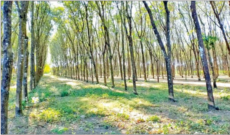
မွန်ပြည်နယ်အတွင်း စိုက်ပျိုးထားသည့် ရော်ဘာစိုက်ခင်း။

မိမိတို့နိုင်ငံတွင် ရော်ဘာကဏ္ဍသည် နိုင်ငံစီးပွားရေးဖွံ့ဖြိုးတိုးတက်မှုအတွက် အဓိက ခေါက်တိုင်များအနက် တစ်ခု ဖြစ်ပါသည်။ အမျိုးသားပို့ကုန်မဟာ ဗျူဟာ(National Export Strategy) တွင် ဦးစားပေးကဏ္ဍတစ်ခုအနေဖြင့် ပါဝင်ပြီး စီးပွားတိုးတက်ရေးတွင် အလွန် အရေးပါသော ကဏ္ဍတစ်ခုဖြစ်ပါသည်။ ပြည်တွင်း စက်မှုလုပ်ငန်းများ အတွက်လည်း အရေးပါသော စက်မှု ကုန်ကြမ်းသီးနှံတစ်ခုဖြစ်ပြီး ပိုလျှံသည် များကို ပြည်ပသို့ တင်ပို့ရောင်းချခြင်း ဖြင့်လည်း နိုင်ငံတော်အတွက် လိုအပ် သော နိုင်ငံခြားငွေအများအပြားကို ရှာဖွေပေးနိုင်စွမ်းပါသည်။ ရော်ဘာစိုက်ပျိုး သည့် ဒေသခံများအတွက် အလုပ်အကိုင် အခွင့်အလမ်းများစွာ ဖန်တီးပေးနိုင်သည့် အတွက်လည်း ဒေသဖွံ့ဖြိုးရေးမှာ အလွန် အရေးပါအရာရောက်သော ကဏ္ဍတစ်ခု ဖြစ်ပါသည်။