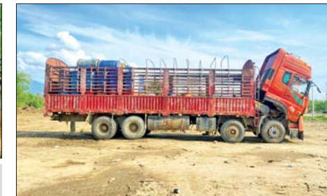
အကြမ်းဖက်သောင်းကျန်းသူများက တရားမဝင်စက်သုံးဆီများ သယ်ဆောင်သည့် မော်တော်ယာဉ်အား သိမ်းဆည်းရရှိမှုကို တွေ့ရစဉ်။