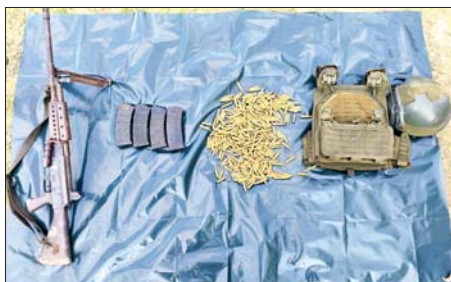
အကြမ်းဖက်သောင်းကျန်းသူပူးပေါင်းအဖွဲ့များထံမှ သိမ်းပိုက်ရရှိသည့် လက်နက်၊ ခဲယမ်းနှင့် ဆက်စပ်ပစ္စည်းများကို တွေ့ရစဉ်။