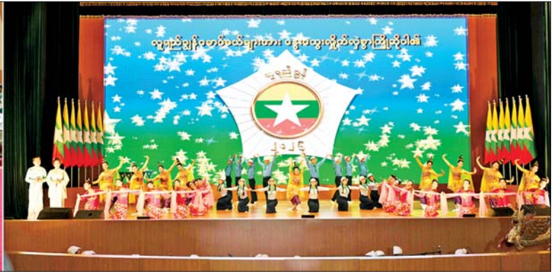
ပြည်ထောင်စုသမ္မတမြန်မာနိုင်ငံတော် နိုင်ငံတော်သမ္မတ ဦးမင်းအောင်လှိုင်နှင့် အခမ်းအနားတက်ရောက်လာကြသူများ ဟိုတယ်၊ ခရီးသွားလာရေးနှင့် ယဉ်ကျေးမှုဝန်ကြီးဌာန အနုပညာဦးစီးဌာနမှ အနုပညာရှင် ဝန်ထမ်းများက “ထာဝရပညာ” တေးသီချင်းဖြင့် သီဆိုကပြဖျော်ဖြေမှုကို ကြည့်ရှုအားပေးကြစဉ်။

၆ စာမျက်နှာ ၄ မှ နီးနော့ဖလှယ်ပွဲများနှင့် လူငယ် ယခုကဲ့သို့ ၂၁ ရာစု အသိပညာ များကို ဘက်ပေါင်းစုံ ထူးချွန်စေ ခေတ်၏ စိန်ခေါ်မှုများကို ရင်ဆိုင် မည့်၊ ဗလင်းတန်ပြည့်ဝစေမည့် နိုင်ရန်မှာ ဘဝတစ်သက်တာ လှုပ်ရှားဆောင်ရွက်မှုများ ကျင်းပ လေ့လာသင်ယူနေရန်၊ စွမ်းဆောင် ပေးကြရန် လေးလေးနက်နက် ရည် ပြုရန် လိုကြောင်း။ မိမိတို့နိုင်ငံကို ကဏ္ဍစုံဖွံ့ဖြိုး ထိုသို့ဆိုပါက မိမိတို့ကိုယ်တိုင် တိုးတက်သည့် ဒီမိုကရေစီ နှင့် ပြင်ပဗဟုသုတနှင့် အသိပညာ ဖြည့်ထောင်စုအဖြစ် တည်ဆောက် အတွက် စာအုပ်စာပေများ ဖတ်ရှု ရမည်ဖြစ်ကြောင်း။ “ဖတ်လျှင် အမြင်ကျယ်၊ မှတ်လျှင် ပညာမြင့်၊ ကျင့်သော် အောင်မြင်၊ သင်သော် ထူးချွန်၊ ဘဝအတွက် စာကောင်း ပေမ္မန်” ဆိုသည့် စကားအတိုင်း စာပေလေ့လာဖတ်ရှုသည့် အလေ့ အကျင့်ကို စွဲစွဲမြဲမြဲ လုပ်ဆောင် သွားကြရန် မှာကြားလိုကြောင်း။ ထို့အပြင် ပညာသင်ရာဌာနများ ဖြစ်သည့် အခြေခံပညာကျောင်း များနှင့် တက္ကသိုလ်များတွင်လည်း လူငယ်စကားပိုင်းများ၊ စာပေ ဟောပြောပွဲများ၊ သုတေသန စာတမ်းဖတ်ပွဲများ၊ ပညာရေး “လူရည်ချွန်” ဟူသည့် ဂုဏ်