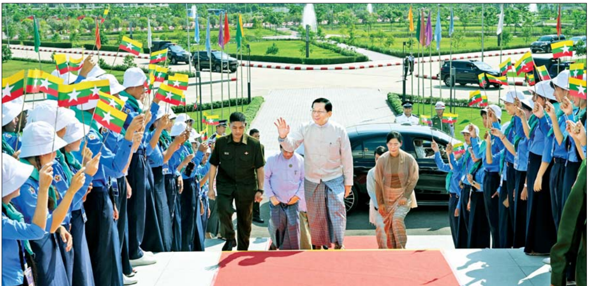
ပြည်ထောင်စုသမ္မတမြန်မာနိုင်ငံတော် နိုင်ငံတော်သမ္မတ ဦးမင်းအောင်လှိုင်အား လူရည်ချွန်မောင်မယ်များ၊ ရေကြောင်းလူငယ်နှင့် လေကြောင်းလူငယ် မောင်မယ်များက လှိုက်လှဲနွေးထွေးစွာ ကြိုဆိုနှုတ်ဆက်ကြစဉ်။

☆ ရှေ့ဖို့မှ နေပြည်တော် တိုင်းစစ်ဌာနချုပ် တိုင်းမှူး၊ ဒုတိယဝန်ကြီးများ၊ ပညာရေးဝန်ကြီးဌာနမှ တာဝန်ရှိသူများ၊ အခြေခံပညာကျောင်းများမှ ဆရာ ဆရာမများနှင့် ၂၀၂၅-၂၀၂၆ ပညာသင်နှစ် လူရည်ချွန်မောင်မယ်များ၊ ရေကြောင်းလူငယ်နှင့် လေကြောင်းလူငယ်များ တက်ရောက်ကြသည်။ ဦးစွာ နိုင်ငံတော်သမ္မတသည် အခမ်းအနား ကျင်းပပြုလုပ်မည့် Naypyitaw State Academy သို့ ရောက်ရှိရာ တာဝန်ရှိသူများနှင့် လူရည်ချွန် မောင်မယ်များ၊ ရေကြောင်း လူငယ်နှင့် လေကြောင်းလူငယ် မောင်မယ်များက လှိုက်လှဲနွေးထွေးစွာ ကြိုဆိုနှုတ်ဆက်ကြသည်။ ထို့နောက် နိုင်ငံတော်သမ္မတက “နိုင်ငံတော်သစ်၏ စွမ်းအားရှင်များ” အစီအစဉ်ကို စက်ခလုတ်နှိပ် ဖွင့်လှစ်ပေးသည်။