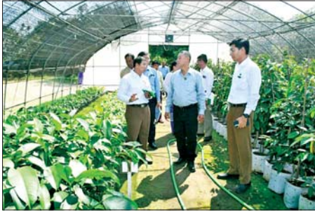
မုဒုံ မေ ၅

မွန်ပြည်နယ် စိုက်ပျိုးရေး၊ မွေးမြူရေးနှင့် ဆည်မြောင်းဝန်ကြီး ဦးမင်းမြင့်မောင်လေးနှင့် တာဝန်ရှိသူများသည် ယနေ့မွန်နန်းလှပိုင်းတွင်