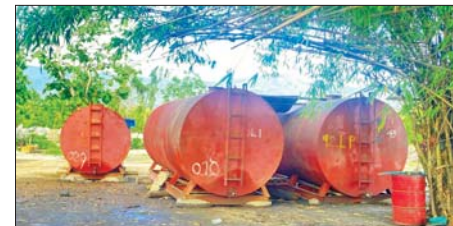
မော်လမြူသို့ ချီတက်တိုက်ခိုက်သိမ်းပိုက်စဉ် လမ်းကြောင်းတစ်လျှောက် အကြမ်းဖက်သောင်းကျန်းသူများ တရားမဝင်လုပ်ကိုင်နေသော စက်သုံးဆီသိုလှောင်သည့် နေရာများမှ ဆီသိုလှောင်ကန်များအား သိမ်းဆည်းရရှိမှုကို တွေ့ရစဉ်။