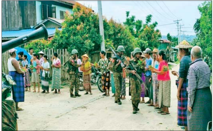
တပ်မတော်စစ်ကြောင်းများ မော်လမြူသို့ ချီတက်သိမ်းပိုက်စဉ် ကျေးရွာများမှ ဒေသခံပြည်သူများက အောင်သပြေပန်းများဖြင့် ဝမ်းသာဂုဏ်ယူစွာ ကြိုဆိုကြစဉ်။

မြို့ကို ပြန်လည်သိမ်းပိုက်ထိန်းချုပ်ခဲ့ပြီးနောက် အဆိုပါဒေသတစ်ဝိုက် နယ်မြေရှင်းလင်းခြင်း၊ အောင်မြင်ချမ်းမြေ့မှုများ ဆက်လက်ဆောင်ရွက်ခဲ့ပြီး မော်လမြူအား ဆက်လက်သိမ်းပိုက်ထိန်းချုပ်နိုင်ရေး စစ်ကြောင်းများ၌ စစ်နည်းဗျူဟာမြောက် ချီတက်ရှင်းလင်းခဲ့ရာ အင်းတော်မြို့နှင့် မော်လမြူအကြားရှိ နားမကြိုင်းရွာ၊ ပင့်တင်ရွာနှင့် နဘားကြီးရွာတို့အား စာမျက်နှာ ၁၆ သို့ *