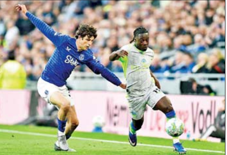
အဲဗာတန်အသင်းနှင့် မန်စီးတီးအသင်းတို့ ယှဉ်ပြိုင်ကစားကြစဉ်။

မန်စီးတီးအသင်းဟာ မေ ၄ ရက်ညပိုင်းက အဲဗာတန်အသင်းနဲ့ ယှဉ်ပြိုင်ကစားခဲ့တဲ့ ပရီမီယာလိဂ် ပွဲစဉ်မှာ သရေရလဒ်ထွက်ပေါ်ခဲ့တာကြောင့် အမှတ်ပေးယေား ထိပ်က အာဆင်နယ်အသင်းကို လိုက်မိဖို့ ငါးမှတ်ကွာဟသွားပြီလည်း ဖြစ်ပါတယ်။ အဲဗာတန်အသင်းနဲ့ မန်စီးတီး အသင်းတို့ပွဲစဉ်မှာ တစ်ဖက်သုံးဂိုးစီ သရေရလဒ် ထွက်ပေါ်ခဲ့တာဖြစ် ပြီး အဲဗာတန်အသင်းအတွက် စာမျက်နှာ ၁၈ ကော်လံ ၃ သို့ ❖