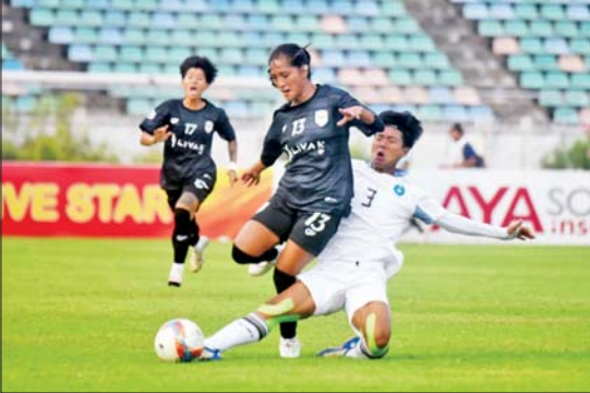
ပြီးခဲ့သည့်ရာသီ အမျိုးသမီးလိဂ် ချန်ပီယံဆုအဆုံးအဖြတ်ပွဲအဖြစ် ဧရာဝတီ အသင်းနှင့် အား/ကာသိပွဲအသင်းတို့ ယှဉ်ပြိုင်ကစားကြစဉ်။

မြန်မာနေရှင်နယ်လိဂ်သည် လာမည့် ရာသီတွင် လိဂ်ပြိုင်ပွဲလေးခု ရှုံးထွက် ပြိုင်ပွဲတစ်ခု ကျင်းပမည်ဖြစ်သည်။ လိဂ်ပြိုင်ပွဲများအဖြစ် MNL အမှတ်ပေး ပြိုင်ပွဲ၊ MNL-2 (ပထမတန်း) အမှတ်ပေး ပြိုင်ပွဲ၊ MNL ယူ-၂၀ လူငယ်လိဂ်ပြိုင်ပွဲ၊ မြန်မာအမျိုးသမီးလိဂ်ပြိုင်ပွဲတို့ ကျင်းပ မည်ဖြစ်ပြီး MNL ကလပ်များနှင့် MNL-2 ကလပ်များ ပါဝင်မည့်ရှုံးထွက်ပြိုင်ပွဲလည်း ကျင်းပမည်ဖြစ်သည်။ ရှုံးထွက်ပြိုင်ပွဲကို ၂၀၂၉ ရာသီတွင် နောက်ဆုံးကျင်းပပြီး နောက် ကာလအတန်ကြာမကျင်းပဘဲ လာမည့်ရာသီမှ ပြန်လည်ကျင်းပမည် ဖြစ်သည်။ ရှုံးထွက်ပြိုင်ပွဲအစား ၂၀၂၄-၂၀၂၅ ရာသီနှင့် ၂၀၂၅-၂၀၂၆ ရာသီတို့တွင် စာမျက်နှာ ၁၈ ကော်လံ ၁ သို့ ❖