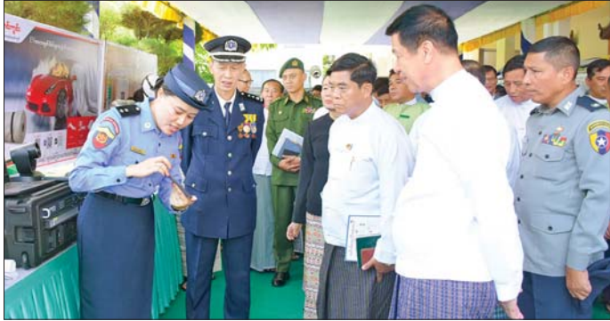
ယင်းနောက် တိုင်းဒေသကြီးဝန်ကြီးချုပ်နှင့် အဖွဲ့တက်ရောက်လာကြသူများသည် မြန်မာနိုင်ငံမီးသတ်တပ်ဖွဲ့ဌာနချုပ်နှင့် မန္တလေးတိုင်းဒေသကြီး မီးသတ်ဦးစီးဌာနက ဆောင်ရွက်ခဲ့သည့် လှုပ်ခတ်မှုတိုင်းပျက်မှုကို စီဒီယိုကလစ်ဖြင့် ကြည့်ရှုပြီး ခင်းကျင်းပြသထားသည့် မီးငြိမ်းသတ်ရေးနှင့် ရှာဖွေကယ်ဆယ်ရေး ပစ္စည်းကိရိယာများ၊ Report 191 Mobile Application ဆောင်ရွက်မှုများနှင့် လှုပ်ရှားမှုမှတ်တမ်းဓာတ်ပုံများကို လိုက်လံကြည့်ရှုအားပေးခဲ့ကြောင်း သိရသည်။

အမှာစကားပြောကြားသည်။ ထို့နောက် တိုင်းဒေသကြီးဝန်ကြီးချုပ်နှင့် တာဝန်ရှိသူများသည် အင်အားပြင်း မန္တလေးငလျင်ကြီး လှုပ်ခတ်မှုဖြစ်စဉ်တွင် စွမ်းစွမ်းတစ်ဆောင်ရွက်ခဲ့သော တပ်ဖွဲ့ဝင်များကို စွမ်းရည်သတ္တိနှင့် စွမ်းဆောင်မှုဆိုင်ရာ ဘွဲ့တံဆိပ်ချီးမြှင့်ခံရသူများအား ဂုဏ်ပြုတံဆိပ်များနှင့် ဂုဏ်ပြုဆုငွေများ၊ စံပြုမီးသတ်စခန်းဆုရရှိသည့် မန္တလေး - ရန်ကုန် အမြန်လမ်းပေါ်ရှိ စကားအင်း မီးသတ်စခန်း(အမြန်လမ်း)နှင့် သီးကုန်း(အမြန်လမ်း) မီးသတ်စခန်းမှ တာဝန်ရှိသူများအား ဂုဏ်ပြုတံဆိပ်နှင့် ဂုဏ်ပြုဆုငွေများ၊ ဌာနတွင်းသင်တန်းများနှင့် ပြင်ပဌာနများတွင် ဆုရရှိသူများ၊ စွမ်းရည်ပြိုင်ပွဲ အသီးသီးတွင် ဆုရရှိသူများအား ဂုဏ်ပြုတံဆိပ်များနှင့် ဂုဏ်ပြုဆုငွေများ ချီးမြှင့်ကြသည်။