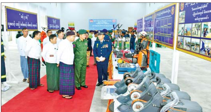
အမှတ်မှတ်တမ်းစီဒီယိုကို ကြည့်ရှု အားပေး၍ မီးငြိမ်းသတ်ရေးနှင့် ရှာဖွေကယ်ဆယ်ရေးလုပ်ငန်းသုံး အဆင့်မြှင့်တင်မှုများ၊ ယာဉ်ယန္တရားများ ခင်းကျင်းပြသထားရှိမှုကို ကြည့်ရှုအားပေးသည်။ ထို့နောက် မြစ်ကြီးနားမြို့ အမှတ် (၉) အခြေခံပညာအထက်တန်းကျောင်း ရွှေသွေးခန်းမ၌ ကျင်းပ

မြစ်ကြီးနား မေ ၅ နှစ်(၈၀)ပြည့် မြန်မာနိုင်ငံ မီးသတ်တပ်ဖွဲ့နေ့ အခမ်းအနားနှင့် ပြည်နယ်အဆင့် ကမ္ဘာ့ကာကွယ်ဆေးထိုးနှံတိုက်ကျွေးရေး ရက်သတ္တပတ် (၂၀၂၆)အထိမ်းအမှတ် အခမ်းအနားကို ယနေ့ နံနက်ပိုင်းတွင် မြစ်ကြီးနားမြို့၌ ကျင်းပသည်။ ဦးစွာ နှစ်(၈၀)ပြည့် မြန်မာနိုင်ငံ မီးသတ်တပ်ဖွဲ့နေ့ အခမ်းအနားကို မြစ်ကြီးနားမြို့ မြို့တော်ခန်းမ၌ ကျင်းပရာ ကချင်ပြည်နယ်ဝန်ကြီးချုပ် ဦးခင်ထိန်နန်က ဂုဏ်ပြု အမှာစကားပြောကြားပြီး မြန်မာနိုင်ငံ မီးသတ်တပ်ဖွဲ့နေ့ အထိမ်း