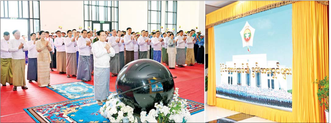
ပြည်ထောင်စုသမ္မတမြန်မာနိုင်ငံတော် နိုင်ငံတော်သမ္မတ ဦးမင်းအောင်လှိုင် “နိုင်ငံတော်သစ်၏ စွမ်းအားရှင်များ” အစီအစဉ်ကို စက်ခလုတ်နှိပ် ဖွင့်လှစ်ပေးစဉ်။

☆ ရှေ့ဖို့မှ နေပြည်တော် တိုင်းစစ်ဌာနချုပ် တိုင်းမှူး၊ ဒုတိယဝန်ကြီးများ၊ ပညာရေးဝန်ကြီးဌာနမှ တာဝန်ရှိသူများ၊ အခြေခံပညာကျောင်းများမှ ဆရာ ဆရာမများနှင့် ၂၀၂၅-၂၀၂၆ ပညာသင်နှစ် လူရည်ချွန်မောင်မယ်များ၊ ရေကြောင်းလူငယ်နှင့် လေကြောင်းလူငယ်များ တက်ရောက်ကြသည်။ ဦးစွာ နိုင်ငံတော်သမ္မတသည် အခမ်းအနား ကျင်းပပြုလုပ်မည့် Naypyitaw State Academy သို့ ရောက်ရှိရာ တာဝန်ရှိသူများနှင့် လူရည်ချွန် မောင်မယ်များ၊ ရေကြောင်း လူငယ်နှင့် လေကြောင်းလူငယ် မောင်မယ်များက လှိုက်လှဲနွေးထွေးစွာ ကြိုဆိုနှုတ်ဆက်ကြသည်။ ထို့နောက် နိုင်ငံတော်သမ္မတက “နိုင်ငံတော်သစ်၏ စွမ်းအားရှင်များ” အစီအစဉ်ကို စက်ခလုတ်နှိပ် ဖွင့်လှစ်ပေးသည်။