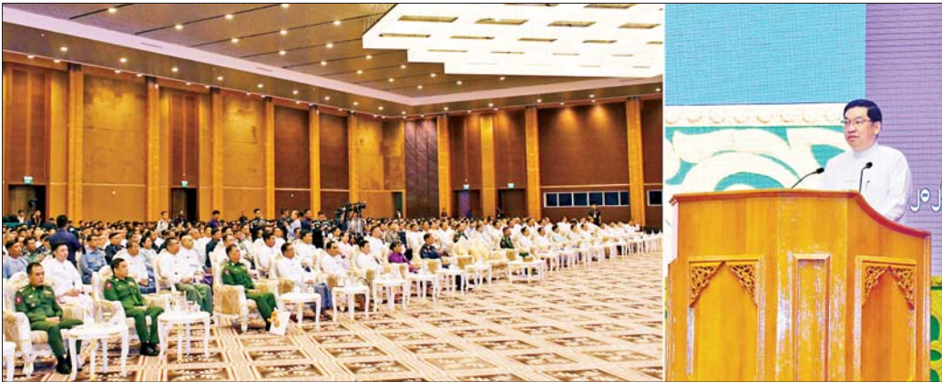
ဒုတိယသမ္မတ ဦးညိုစော နှစ်(၈၀)ပြည့် မြန်မာနိုင်ငံမီးသတ်တပ်ဖွဲ့နေ့အခမ်းအနားတွင် အမှာစကားပြောကြားစဉ်။

နေပြည်တော် မေ ၅ နှစ်(၈၀)ပြည့် မြန်မာနိုင်ငံမီးသတ်တပ်ဖွဲ့နေ့ အခမ်းအနားကို ယနေ့နံနက်ပိုင်းတွင် နေပြည်တော်ရှိ မြန်မာအပြည်ပြည်ဆိုင်ရာကွန်ဗင်းရှင်းဗဟိုဌာန - ၁ (MICC - 1) ၌ ကျင်းပရာ ပြည်ထောင်စုသမ္မတ မြန်မာနိုင်ငံတော် ဒုတိယသမ္မတ ဦးညိုစော တက်ရောက်အမှာစကားပြောကြားသည်။ အခမ်းအနားသို့ ပြည်ထောင်စုဝန်ကြီးများနှင့် အဆင့်တူပုဂ္ဂိုလ်များ၊ ဒုတိယဝန်ကြီးများ၊ မြန်မာနိုင်ငံ စစ်မှုထမ်းဟောင်းအဖွဲ့ဥက္ကဋ္ဌနှင့် တာဝန်ရှိသူများ၊ တပ်မတော်အရာရှိကြီးများ၊ ဌာနဆိုင်ရာတာဝန်ရှိသူ များ၊ မြန်မာနိုင်ငံမီးသတ်တပ်ဖွဲ့ဌာနချုပ်မှ အရာရှိ များနှင့် တပ်ဖွဲ့ဝင်များ၊ အငြိမ်းစားမီးသတ်တပ်ဖွဲ့ဝင် အရာရှိကြီးများ၊ လူမှုရေးအသင်းအဖွဲ့များမှ တာဝန် ရှိသူများ၊ တိုင်းဒေသကြီးနှင့် ပြည်နယ်အသီးသီးမှ သန္ဓေ အရန်၊ သီးသန့်မီးသတ်တပ်ဖွဲ့ဝင်များ၏ စာမျက်နှာ ၇ ကော်လံ ၁ သို့ ။