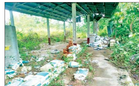
အကြမ်းဖက်သောင်းကျန်းသူများက ဌာနဆိုင်ရာအဆောက်အအုံများအား ဖျက်ဆီး၍ တန်ကာများပြုလုပ်ထားရှိမှုကို တွေ့ရစဉ်။