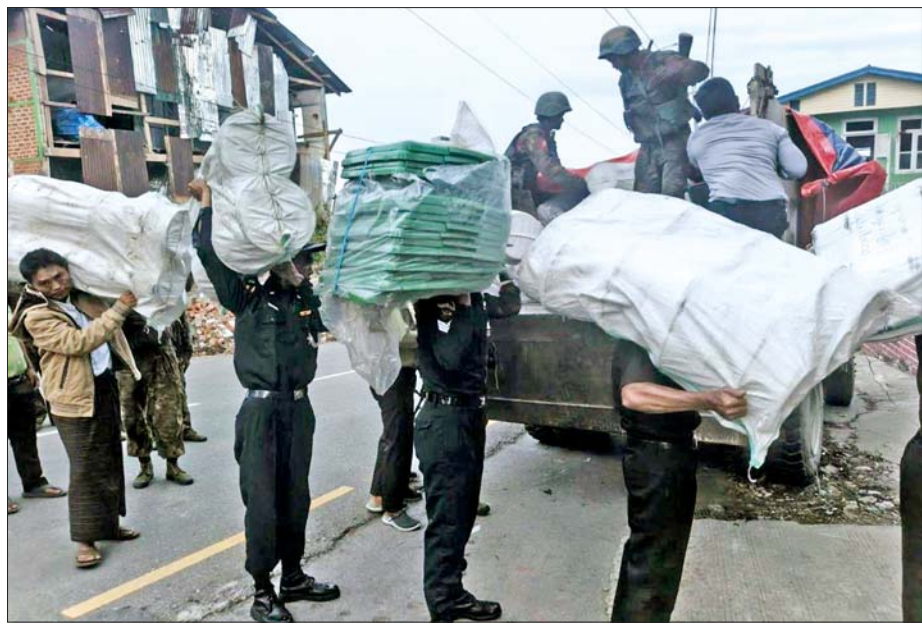
ကလေးမြို့သို့ရောက်ရှိနေသည့် ပြန်လည်ထူထောင်ရေးပစ္စည်းများနှင့် လူသုံးကုန်ပစ္စည်းများ ချင်းပြည်နယ် ဖလမ်းမြို့သို့ ဆက်လက်ပို့ဆောင်စဉ်။

နေပြည်တော် မေ ၂၆ တပ်မတော်အနေဖြင့် ပြည်သူ့လူထုအေးချမ်းစွာနေထိုင်နိုင်ရေးနှင့် လူမှုစီးပွားဘဝဖွံ့ဖြိုးတိုးတက်ရေးအတွက် အကြမ်းဖက်သောင်းကျန်းသူများ ယာယီစိုးမိုးထားသည့် မြို့နယ်၊ ကျေးရွာ၊ ဒေသအချို့တို့၌ အကြမ်းဖက်ချေမှုန်းမှုစစ်ဆင်ရေး (Counter-Terrorism Operation) များကို ဆောင်ရွက်ကာ ချင်းပြည်နယ်ရှိ ဖလမ်း၊ တီးတိန်နှင့် တွန်းဖဲဒေသများကို အပြည့်အဝပြန်လည်ထိန်းချုပ်နိုင်ခဲ့ပြီး ပြန်လည်ထူထောင်ရေးလုပ်ငန်းများ ဆောင်ရွက်နိုင်ရန်အတွက် နိုင်ငံတော်အကြီးအကဲ၏ လမ်းညွှန်ချက်နှင့်အညီ လုပ်ငန်းကဏ္ဍများအလိုက် တာဝန်ရှိသူများ၊ ဒေသခံပြည်သူများနှင့်အတူပူးပေါင်း၍ ကြိုးပမ်းဆောင်ရွက်ပေးလျက် ရှိပါသည်။ ထိုသို့ဆောင်ရွက်ပေးလျက်ရှိရာ ပြန်လည်ထူထောင်ရေးလုပ်ငန်းများ ဆောင်ရွက်ရာတွင် လိုအပ်သည့် ဘိလပ်မြေ၊ သွပ်၊ သွပ်ရိုက်သံ အစရှိသည့် ဆောက်လုပ်ရေးလုပ်ငန်းသုံးပစ္စည်းများကို မန္တလေးမြို့မှ လည်းကောင်း၊ မိမိအရပ်ဒေသသို့ ပြန်လည်ဝင်ရောက်နေထိုင်ကြမည့် ဒေသခံပြည်သူများအတွက် လူသုံးကုန်ပစ္စည်းများ၊ မီးဖိုချောင်သုံးပစ္စည်းများ၊ ကျန်းမာရေးသုံးပစ္စည်းများကို နေပြည်တော်မှလည်းကောင်း မေ ၂၅ ရက်တွင် စာမျက်နှာ ၁၁ ကော်လံ ၁ သို့