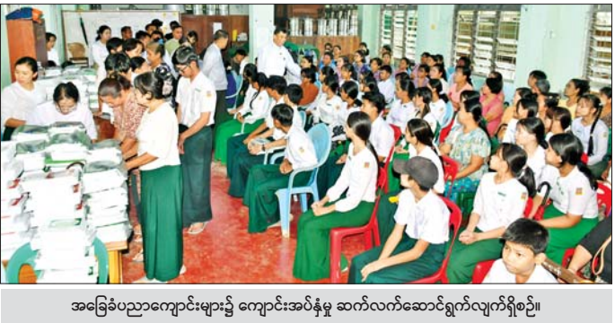
အခြေခံပညာကျောင်းများ၌ ကျောင်းအပ်နှံမှု ဆက်လက်ဆောင်ရွက်လျက်ရှိစဉ်။

၂၀၂၆-၂၀၂၇ ပညာသင်နှစ် အခြေခံပညာကျောင်းများ၌ ကျောင်းသား ကျောင်းသူများ ကျောင်းအပ်နှံမှု ဆက်လက်ဆောင်ရွက် နေပြည်တော် မေ ၂၆ ၂၀၂၆-၂၀၂၇ ပညာသင်နှစ်အတွက် အခြေခံပညာဦးစီးဌာနအောက်ရှိ အထက်တန်းအဆင့်၊ အလယ်တန်းအဆင့်နှင့် မူလတန်းအဆင့်ကျောင်းများကို ဇွန် ၁ ရက်တွင် စတင်ဖွင့်လှစ်မည်ဖြစ်ပြီး ကျောင်းအပ်နှံမှု သီတင်းပတ်အဖြစ် မေ ၂၅ ရက်မှ ၃၁ ရက်အထိ စနေ၊ တနင်္ဂနွေအပါအဝင် ပိတ်ရက်မရှိသတ်မှတ်၍ မြန်မာနိုင်ငံတစ်ဝန်းရှိ အခြေခံပညာကျောင်းအသီးသီး၌ ကျောင်းသား ကျောင်းသူများအား ကျောင်းအပ်နှံမှု လက်ခံခြင်းများကို မေ ၂၅ ရက် နံနက်ပိုင်းမှစ၍ ဆောင်ရွက်လျက်ရှိရာ ယနေ့တွင် ဆက်လက်အပ်နှံဆောင်ရွက် လျက်ရှိပါသည်။ စာမျက်နှာ ၁၂ ကော်လံ ၁ သို့