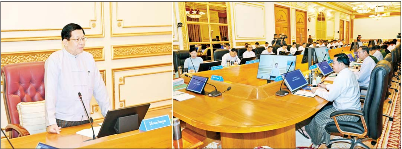
နိုင်ငံတော်သမ္မတ ဦးမင်းအောင်လှိုင် ပြည်ထောင်စုအစိုးရအဖွဲ့အစည်းအဝေးတွင် အမှာစကားပြောကြားစဉ်။

နိုင်ငံတော်သမ္မတ ဦးမင်းအောင်လှိုင် ပြည်ထောင်စုအစိုးရအဖွဲ့အစည်းအဝေးသို့ တက်ရောက်အမှာစကားပြောကြား နိုင်ငံတော်တွင် ကြုံတွေ့ဖြတ်သန်းခဲ့ရသည်များကို သင်ခန်းစာယူ၍ ကောင်းမွန်သည့် ဦးဆောင်မှုများဖြင့် နိုင်ငံရေးအား၊ စီးပွားရေးအား၊ ကာကွယ်ရေးအားများ တိုးတက်လာစေရန်၊ နိုင်ငံတကာမျက်နှာစာတွင် နိုင်ငံဂုဏ်သိက္ခာကို မြှင့်တင်သွားနိုင်ရန် ကြိုးပမ်းဆောင်ရွက်