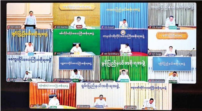
ပြည်ထောင်စုအစိုးရအဖွဲ့အစည်းအဝေးသို့ တိုင်းဒေသကြီးနှင့် ပြည်နယ်ဝန်ကြီးချုပ်များက ဗီဒီယိုကွန်ဖရင့်ဖြင့် တက်ရောက်ကြစဉ်။

နိုင်ငံတော်တွင် နိုင်ငံရေးအရ ခေတ်အဆက်ဆက် ဖြစ်ပေါ်ပြောင်းလဲမှုများ ဦးစွာ နိုင်ငံတော်သမ္မတက အဖွင့် အမှာစကားပြောကြားရာတွင် မိမိတို့ အစိုးရအနေဖြင့် နိုင်ငံတော်တာဝန်ကို ထမ်းဆောင်ခဲ့သည့်မှာ တစ်လခွဲကာလသို့ ရောက်ရှိခဲ့ပြီ ဖြစ်ကြောင်း၊ နိုင်ငံတော်တွင် ဖြစ်ပေါ်ကြုံတွေ့ခဲ့ရသည့် သမိုင်းကြောင်း များကို ပြန်လည်သုံးသပ်ကြည့်ရမည်ဆိုပါ က လွတ်လပ်ရေးရရှိပြီးချိန်မှ ယနေ့အထိ ပြည်တွင်းနိုင်ငံရေး အခြေအနေများ၊ နိုင်ငံ တကာဆက်ဆံရေး အခြေအနေများနှင့် ချိန်ထိုးသုံးသပ်ရမည် ဖြစ်ကြောင်း၊ လွတ်လပ်ရေးရရှိပြီးချိန်တွင် ပြည်တွင်း လက်နက်ကိုင်ပဋိပက္ခများ၊ မတည်ငြိမ်မှု များနှင့် ပြည်ပကျူးကျော်မှုများကိုလည်း ဖြေရှင်းဆောင်ရွက်ခဲ့ရကြောင်း၊ ၁၉၄၇ ခုနှစ် ဖွဲ့စည်းအုပ်ချုပ်ပုံ အခြေခံဥပဒေ အားနည်းချက်ကြောင့် ပြည်နယ်များ ခွဲထွက်ခွင့်များဖြစ်ပေါ်လာရာမှ နိုင်ငံရေး ပဋိပက္ခများ ပိုမိုကြီးမားလာခဲ့ခြင်း၊ အာဏာရပါတီအတွင်း အုပ်စုကွဲခြင်းများ ဖြစ်ပေါ်ခဲ့ကြောင်း၊ ထိုအချိန်တွင် နိုင်ငံ ရေးအရ တည်ငြိမ်မှု လုံခြုံရေးအရ တည်ငြိမ်မှုများမရှိခဲ့ကြောင်း၊ ၁၉၈၈ ခုနှစ် တွင် အိမ်ထောင် အစိုးရက တာဝန်ယူခဲ့ပြီး ၁၉၉၂ ခုနှစ်တွင် တော်လှန်ရေးကောင်စီက နိုင်ငံတာဝန်ကို ထမ်းဆောင်ခဲ့ရကြောင်း၊ ယင်းအချိန်တွင် နိုင်ငံရေးဦးဆောင်သူ များ၊ လူငယ်များ၊ တပ်မတော်မှ တာဝန်ရှိ