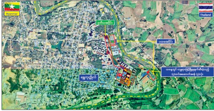
ကရင်ပြည်နယ် မြဝတီမြို့နယ် ရွှေကုက္ကိုလ်ဒေသရှိ တရားမဝင်အဆောက်အအုံများအား ဖောက်ခွဲ ဖျက်ဆီးမှု။

နေပြည်တော် မေ ၂၆ မြန်မာနိုင်ငံအစိုးရအနေဖြင့် နိုင်ငံတော် တည်ငြိမ်အေးချမ်းရေး၊ တရားဥပဒေစိုးမိုးရေးနှင့် ဖွံ့ဖြိုးတိုးတက်ရေးလုပ်ငန်းများကို အလေးထား ဆောင်ရွက်လျက်ရှိရာတွင် နိုင်ငံတော်နှင့် အများ ပြည်သူအကျိုးစီးပွားကို ထိခိုက်ပျက်စီးအောင် ဆောင်ရွက်လျက်ရှိသည့် အွန်လိုင်းလိမ်လည်လောင်း ကစားမှုများကို အခြေချလုပ်ကိုင်ခဲ့ကြသော ရွှေကုက္ကိုလ်နယ်မြေအတွင်း KK Park နယ်မြေများရှိ တရားမဝင်အဆောက်အအုံများအတွင်း အွန်လိုင်း လိမ်လည်လောင်းကစားလုပ်ငန်းများ လုပ်ကိုင်ခြင်း မရှိစေရေး ဝင်ရောက်ရှင်းလင်း၍ အွန်လိုင်းလိမ်လည် လောင်းကစားမှုလုပ်ငန်းစဉ်များတွင် အသုံးပြုခဲ့သည့် သိမ်းဆည်းရမိစွဲများအား စနစ်တကျ ဖျက်ဆီး ခြင်းနှင့် တရားမဝင် အဆောက်အအုံများအား စနစ်တကျဖြိုချ ဖျက်ဆီးခြင်းများကို လုံခြုံရေးတပ်ဖွဲ့ ဝင်များ၊ အုပ်ချုပ်ရေးအဖွဲ့အစည်းများနှင့် ဒေသတွင်း