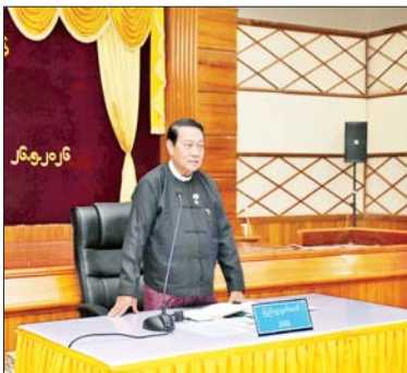
ပြည်သူ့လွှတ်တော်ဥက္ကဋ္ဌ ဦးခင်ရီ မန္တလေးတိုင်းဒေသကြီးအတွင်းရှိ ပြည်သူ့လွှတ်တော် ကိုယ်စားလှယ်များအား တွေ့ဆုံအမှာစကားပြောကြားစဉ်။

မန္တလေး မေ ၂၆ ပြည်သူ့လွှတ်တော် ဥက္ကဋ္ဌ ဦးခင်ရီသည် မန္တလေးတိုင်းဒေသကြီးအတွင်းရှိ ပြည်သူ့လွှတ်တော် ကိုယ်စားလှယ်များအား ယနေ့နံနက်လွှဲပိုင်းတွင် မန္တလေးတိုင်းဒေသကြီးလွှတ်တော်ရုံး သတင်းဆောင်၌ တွေ့ဆုံသည်။ တွေ့ဆုံစဉ် ပြည်သူ့လွှတ်တော်ဥက္ကဋ္ဌက လွှတ်တော်ကိုယ်စားလှယ်များအနေဖြင့် မဲဆန္ဒရှင်ပြည်သူများနှင့် နိုင်ငံတော်အကျိုးအတွက် လက်ရှိကာလတွင် တက်တက်ကြွကြွ သက်ဝင်လှုပ်ရှားဆောင်ရွက်နေသည်ကို တွေ့ရှိရပါကြောင်း၊ ထိုသို့ဆောင်ရွက်ရာတွင် လွှတ်တော် ကိုယ်စားလှယ်များအနေဖြင့် လုပ်ထုံးလုပ်နည်းများ လွှဲမှားမှု မရှိစေလိုကြောင်း၊ လွှတ်တော်ဆိုသည်မှာ သက်ဆိုင်ရာမဲဆန္ဒနယ်အသီးသီးမှ ပြည်သူတို့၏ဆန္ဒနှင့်အညီ ရွေးချယ်တာဝန်ပေးအပ်ထားသည့် ပြည်သူ့ကိုယ်စားလှယ်များနှင့် ဖွဲ့စည်းထားသည့် နေရာတစ်ခုဖြစ်ပါကြောင်း။