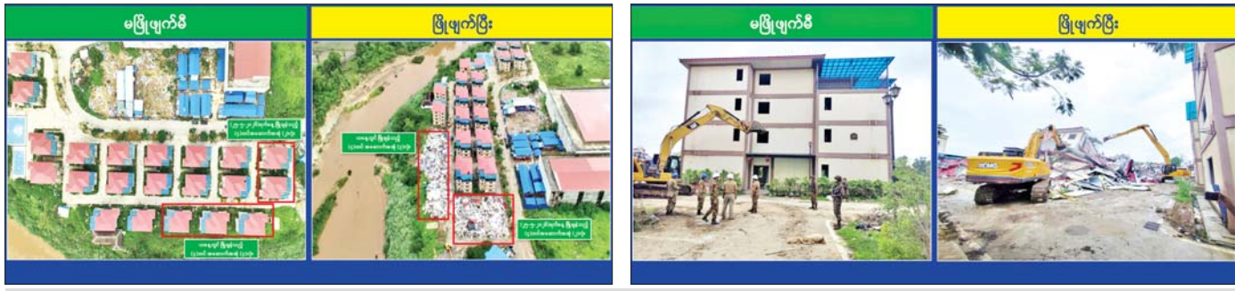
ကရင်ပြည်နယ် မြဝတီမြို့နယ် ရွှေကုက္ကိုလ်ဒေသ တရားမဝင်အွန်လိုင်းလောင်းကစားလုပ်ငန်း လုပ်ကိုင်ခဲ့သည့် လေးထပ်အဆောက်အအုံများအား မဖြိုဖျက်မီနှင့် ဖြိုဖျက်ပြီးစီးသည့်အခြေအနေကို တွေ့ရစဉ်။