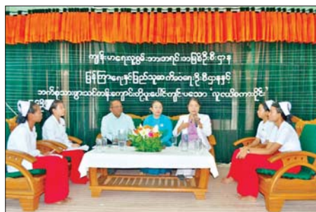
ပြင်ဦးလွင်မြို့ ဘက်စုံသားဖွားသင်တန်းကျောင်း၌ လူငယ်စကားပိုင်း ကျင်းပ