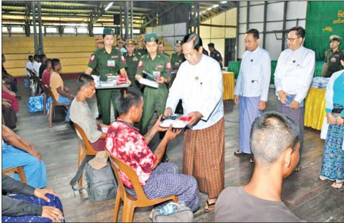
စဉ်(၂၅)သို့ တက်ရောက်ကြမည့် ဝန်ကြီးချုပ်နှင့် ကာကွယ်ရေး ဦးစီးချုပ်ရုံး(ကြည်း)မှ ဗိုလ်ချုပ် ကျော်လင်းမောင်တို့က အမှာစကား များ ပေးအပ်သည်။ ထို့နောက် တိုင်းဒေသကြီး သားကောင်း ရတနာများအား သတင်းစဉ်

နေပြည်တော် မေ ၂၃ ပြည်သူ့စစ်မှုထမ်း သင်တန်း အမှတ်စဉ်(၂၅)သို့ တက်ရောက်ကြ မည့် ဧရာဝတီတိုင်းဒေသကြီး အတွင်းမှ နိုင်ငံ့သားကောင်းရတနာ များအား ယနေ့နံနက်ပိုင်းတွင် ဧရာဝတီတိုင်းဒေသကြီး ဝန်ကြီးချုပ် ဦးအေးကျော်၊ ကာကွယ်ရေး ဦးစီးချုပ်ရုံး(ကြည်း)မှ ဗိုလ်ချုပ် ကျော်လင်းမောင်၊ အနောက် တောင်တိုင်းစစ်ဌာနချုပ် တိုင်းမှူး ဗိုလ်မှူးချုပ် အောင်ကျော်ခိုင်နှင့် ဌာနဆိုင်ရာ တာဝန်ရှိသူများက တပ်နယ်အားကစားရုံ၌ တွေ့ဆုံ သည်။