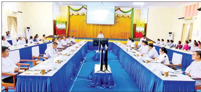
များကို အရှိန်အဟုန်မပြတ် ဆောင်ရွက်နိုင်ရေး အမှာစကားပြောကြားခဲ့ကြောင်း သိရသည်။ ကြိုတင်ညှိနှိုင်းအစည်းအဝေးသို့ တက်ရောက် တာဝန်စဉ်

ပြောကြားပြီး ကုလသမဂ္ဂအထွေထွေညီလာခံမှ အတည်ပြုချမှတ်ခဲ့သော ဆုံးဖြတ်ချက်အရ အသေးစား၊ အလတ်စားနှင့် အလတ်စား စီးပွားရေးလုပ်ငန်းများ နေ့အကြောင်းကို ရှင်းလင်းဆွေးနွေးပြောကြားသည်။ ထို့နောက် အမှတ်(၁) အကြီးစားစက်မှုလုပ်ငန်း ရုံးချုပ်၏ ဝန်ထမ်းများနေရာချထားမှု၊ ဌာနအလိုက် လုပ်ငန်းတာဝန်များ ဆောင်ရွက်မှုအခြေအနေတို့ကို လှည့်လည်ကြည့်ရှုစစ်ဆေးသည်။ မွန်းလွဲပိုင်းတွင် ပြည်တွင်း၌ SKD/CKD စနစ်ဖြင့် တပ်ဆင်ထုတ်လုပ်သည့် မော်တော်ယာဉ်များ၊ နှစ်ဘီး/သုံးဘီး မော်တော်ဆိုင်ကယ်များ၊ ကိုယ်ထည် တပ်ဆင်ထုတ်လုပ်သည့် မော်တော်ယာဉ်များ၊ လယ်ယာသုံးယာဉ်များနှင့် စပ်လျဉ်းသည့် လုပ်ငန်းစဉ်