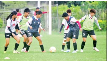
AYA Tri Nation Cup 2026 အမျိုးသမီး ဖိတ်ခေါ်ပြိုင်ပွဲအတွက် မြန်မာ့လက်ရွေးစင် အမျိုးသမီးအသင်း လေ့ကျင့်နေစဉ်။

ရန်ကုန် မေ ၂၃ မြန်မာနိုင်ငံဘောလုံးအဖွဲ့ချုပ်သည် ဇွန် ၃ ရက်မှ ၉ ရက်အထိ ရန်ကုန်မြို့ သုဝဏ္ဏကွင်း၌ ကျင်းပမည့် AYA Tri Nation Cup 2026 အမျိုးသမီးဖိတ်ခေါ်ပြိုင်ပွဲအတွက် ကြိုတင်လက်မှတ် ရောင်းချမည့် အစီအစဉ်များ ထုတ်ပြန်လိုက်ပြီ ဖြစ်သည်။