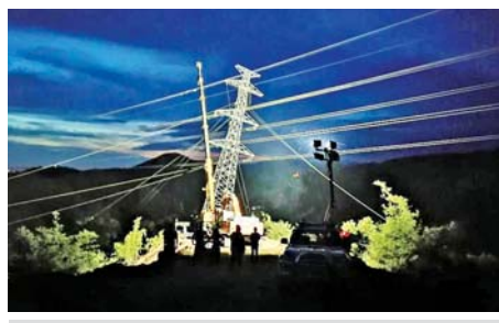
လျှပ်စစ်ဓာတ်အားစနစ် ပြင်ဆင်နေမှုကို တွေ့ရစဉ်။