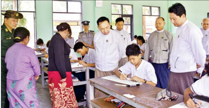
ဒေသကြီးအတွင်းရှိ မကွေးခရိုင်နှင့် မင်းဘူးခရိုင်မှ အထက်တန်း၊ အလယ်တန်း၊ မူလတန်းအဆင့် ကျောင်းသား ကျောင်းသူ ၂၉၃ ဦး ပါဝင်ယှဉ်ပြိုင်ကြပြီး ဆုရရှိသည့် ကျောင်းသား ကျောင်းသူများကို ဇွန် ၂၆ ရက်တွင် ကျင်းပမည့် အပြည်ပြည်ဆိုင်ရာ မူးယစ်ဆေးဝါး အလွဲသုံးမှုနှင့် တရားမဝင် ရောင်းဝယ်မှု တိုက်ဖျက်ရေးနေ့ အထိမ်းအမှတ် အခမ်းအနားတွင် ဆုများ ချီးမြှင့်သွားမည်ဖြစ်ကြောင်း သိရသည်။ မောင်ခိုင်မင်း(ပြန်/ဆက်)

မကွေး မေ ၂၃ ၂၀၂၆ ခုနှစ် ဇွန် ၂၆ ရက်တွင် ကျရောက်မည့် “အပြည်ပြည်ဆိုင်ရာ မူးယစ်ဆေးဝါး အလွဲသုံးမှုနှင့် တရားမဝင်ရောင်းဝယ်မှု တိုက်ဖျက်ရေးနေ့” အထိမ်းအမှတ် ပန်းချီ၊ ကာတွန်း၊ ပုံစတာ၊ ကွန်ပျူတာပန်းချီပြိုင်ပွဲများကို ယနေ့နံနက်ပိုင်းက မကွေးမြို့ အမှတ်(၄) အခြေခံပညာအထက်တန်းကျောင်းနှင့် ကွန်ပျူတာပန်းချီပြိုင်ပွဲကို မွန်းလွဲပိုင်းက ကွန်ပျူတာ တက္ကသိုလ်(မကွေး)၌ ကျင်းပရာ တိုင်းဒေသကြီး ဝန်ကြီးချုပ် ဦးတင်ကိုကိုနှင့် တိုင်းဒေသကြီး ဝန်ကြီးများ သွားရောက်ကြည့်ရှု အားပေးသည်။