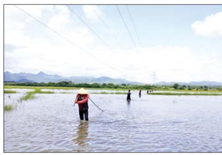
လျှပ်စစ်ဓာတ်အားစနစ် ပြင်ဆင်နေမှုကို တွေ့ရစဉ်။