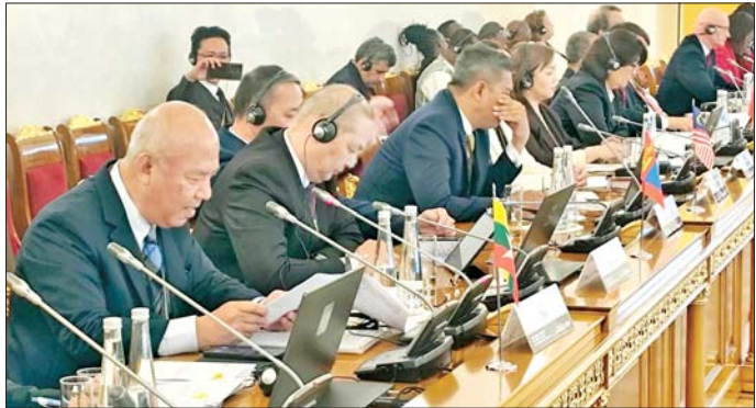
Courts and Equivalent Institutions- AACCI) အဖွဲ့ဝင်နိုင်ငံများရှိ ဖွဲ့စည်းပုံအခြေခံဥပဒေဆိုင်ရာ တရားရုံးဥက္ကဋ္ဌနှင့် တရားသူကြီးများ အခြားဖိတ်ကြားထားသော ဥပဒေပညာရှင်များနှင့် အပြည်ပြည်ဆိုင်ရာ

နေပြည်တော် မေ ၂၃ ရှေးဖက်ဒရေးရှင်းနိုင်ငံ ဖွဲ့စည်းပုံအခြေခံဥပဒေဆိုင်ရာ တရားရုံးဥက္ကဋ္ဌ H.E. Mr. Valery D. Zorkin ၏ ဖိတ်ကြားချက်အရ နိုင်ငံတော်ဖွဲ့စည်းပုံအခြေခံဥပဒေဆိုင်ရာခုံရုံးဥက္ကဋ္ဌ ဦးဆောင်စေသိန်း ဦးဆောင်သော ကိုယ်စားလှယ်အဖွဲ့သည် ရှေးဖက်ဒရေးရှင်းနိုင်ငံ စိန့်ပီတာစဘတ်မြို့တွင် ဖွဲ့စည်းပုံအခြေခံဥပဒေဆိုင်ရာ ကြီးကြပ်ထိန်းကျောင်းခြင်းနှင့် မျက်မှောက်ကာလ ကမ္ဘာလုံးဆိုင်ရာစိန့်ပီတာစဘတ်မြို့ ခေါင်းစဉ်ဖြင့် ကျင်းပသည့် အပြည်ပြည်ဆိုင်ရာညီလာခံသို့ မေ ၁၉ ရက်မှ ၂၁ ရက်အထိ တက်ရောက်ခဲ့သည်။ အပြည်ပြည်ဆိုင်ရာညီလာခံသို့ မြန်မာနိုင်ငံ အပါအဝင် အာရှဒေသ ဖွဲ့စည်းပုံအခြေခံဥပဒေဆိုင်ရာတရားရုံးများနှင့် အဆင့်တူအဖွဲ့အစည်းများ အသင်း (Association of Asian Constitutional