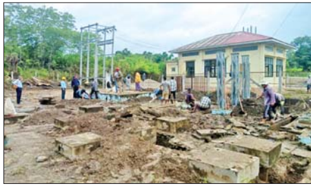
လျှပ်စစ်ဓာတ်အားပေးစနစ်တစ်လျှောက် ဖျက်ဆီးခံရမှုကို တွေ့ရစဉ်။