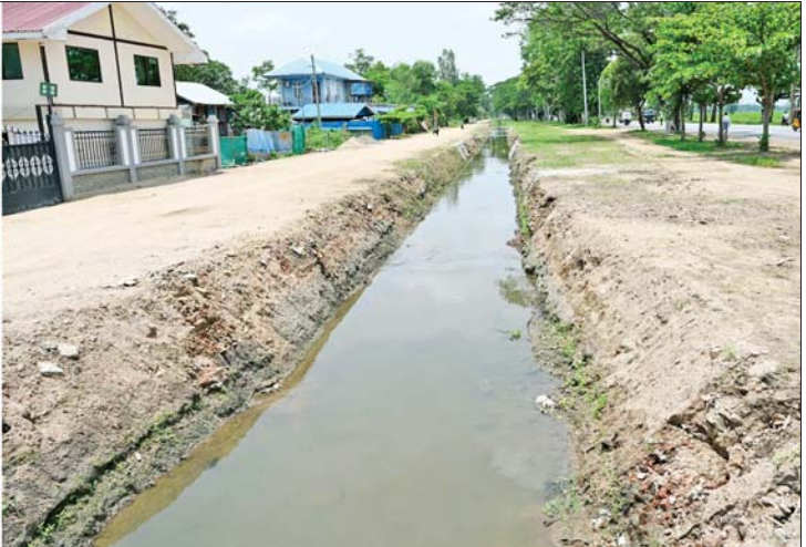
ပြည်ထောင်စုသမ္မတမြန်မာနိုင်ငံတော် နိုင်ငံတော်သမ္မတ ဦးမင်းအောင်လှိုင် ပြည်ထောင်စုနယ်မြေ နေပြည်တော် အိုင်စောက်ကျေးရွာအနီး လမ်းဘေးဝဲယာတစ်လျှောက် ရေစီးရေလာကောင်းမွန်စေရေး ရေကုတ်မြောင်းများ ဆောင်ရွက်ထားရှိမှုအခြေအနေများကို ကြည့်ရှုစစ်ဆေးစဉ်။