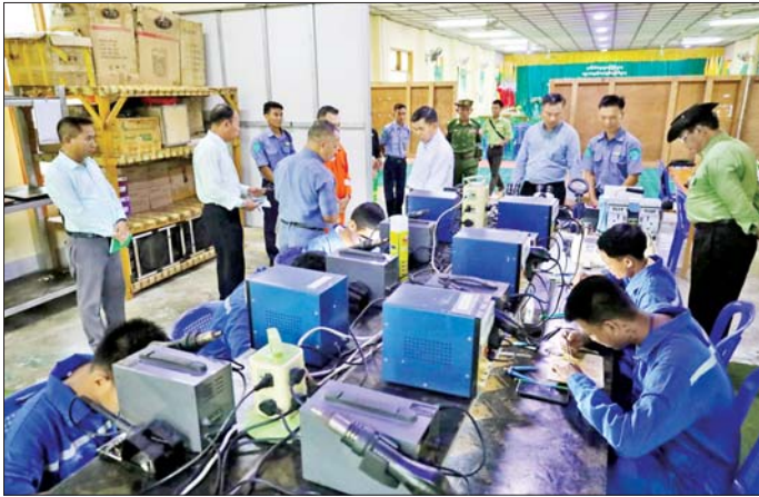
နည်းပြများအနေဖြင့် ကျောင်းသား တွင် နိုင်ငံတော်အတွက် အားကိုး ကောင်းများ၊ ခေါင်းဆောင်ကောင်း ကျောင်းသူများအား နေ့စဉ်တစ်ချိန် အားထားပြုရမည့် နိုင်ငံဝန်ထမ်း များဖြစ်အောင် ရည်မှန်းချက်များ

ရောဂါတိုင်းဒေသကြီး နယ်စပ်ရေးရာ ဝန်ကြီးဌာန ပြည်ထောင်စုဝန်ကြီး ဒုတိယဗိုလ်ချုပ်ကြီး ဖုန်းမြတ်သည် ရောဂါတိုင်းဒေသကြီး လုံခြုံရေးနှင့် နယ်စပ်ရေးရာဝန်ကြီးဌာန ဗိုလ်မှူးကြီး စိုးမင်းဦးနှင့်အတူ ယခင်နေ့က ရောဂါတိုင်းဒေသကြီး အပူပင်မြို့ရှိ နယ်စပ်ဒေသတိုင်းရင်းသား လူငယ်များ ဖွံ့ဖြိုးရေး သင်တန်းကျောင်းသို့ ရောက်ရှိပြီး လိုအပ်သည်များ မှာကြားပြည့်ဆည်း ဆောင်ရွက်ပေးခဲ့သည်။ ထို့နောက် ကျောင်းအုပ်၊ ဝန်ထမ်းများ၊ ဆရာ ဆရာမများ၊ ကျောင်းသား ကျောင်းသူများနှင့် တွေ့ဆုံ၍ ဆရာ ဆရာမများနှင့်