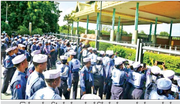
ရေကြောင်းလူငယ်အခြေခံသင်တန်းများနှင့် တန်းမြင့်သင်တန်းများမှ သင်တန်းသား သင်တန်းသူများ ဥပျာတသန္တီစေတီတော်မြတ်ဝင်းအတွင်း သွားရောက်လေ့လာစဉ်။

နေပြည်တော်သို့ ရောက်ရှိနေသော ရေကြောင်းလူငယ်အခြေခံနှင့် တန်းမြင့်သင်တန်း အမှတ်စဉ် (၁/၂၀၂၆)မှ သင်တန်းသား သင်တန်းသူများနှင့် အုပ်ချုပ်သူနည်းပြများသည် ယနေ့နံနက်ပိုင်းတွင် တပ်မတော် စစ်သမိုင်းပြတိုက်(နေပြည်တော်)နှင့် အမျိုးသားအထိမ်းအမှတ်ဥယျာဉ် (နေပြည်တော်)ရှိ မြန်မာနိုင်ငံတစ်ဝန်းလုံးမှ တန်ခိုးကြီးဘုရား၊ စေတီ၊ ပုထိုးများ၏ ပုံစံပုံသဏ္ဍာန်၊ အထင်ကရနေရာများ၊ တိုင်းရင်းသားလူမျိုးတို့၏ရိုးရာအထိမ်းအမှတ်ပြပွဲများကို သွားရောက်လေ့လာကြရာ တာဝန်ရှိသူများက လိုက်လံရှင်းလင်းပြသပြီး သင်တန်းသား သင်တန်းသူများ၏ သိရှိလိုသည်များ မေးမြန်းမှုကို ပြန်လည်ရှင်းလင်းဖြေကြားသည်။