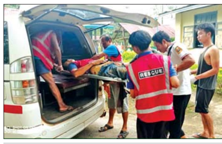
ဝန်ထမ်းများ ထိခိုက်ဒဏ်ရာရရှိမှုများကို တွေ့ရစဉ်။