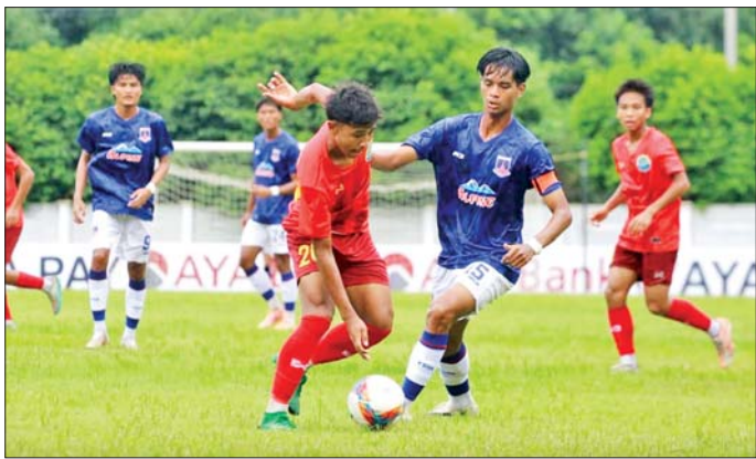
Galaxy အသင်းနှင့် ရတနာပုံအသင်းတို့ ယှဉ်ပြိုင်ကစားကြစဉ်။

သန်လျင် သီဟဒီပကွင်း၌ ကျင်းပသည့်ပွဲတွင် Galaxy အသင်းက ရတနာပုံအသင်းကို နှစ်ဂိုး-တစ်ဂိုးဖြင့် အနိုင်ရခဲ့ပါသည်။ Galaxy အသင်းသည် မြန်မာယူ-၁၆ လူငယ်လက်ရွေးစင်အသင်းကို ပွဲအတွေ့အကြုံရစေရန် ဝင်ရောက်ယှဉ်ပြိုင်စေခြင်းဖြစ်ပြီး ပွဲဦးထွက်ပွဲတွင် အနိုင်ရခဲ့ခြင်းဖြစ်သည်။ ဂျပန်နည်းပြကိုင်တွယ်နေသည့် Galaxy အသင်းသည် ပြင်ဆင်မှုများစွာ ပြုလုပ်ထားသည့် ရတနာပုံအသင်းကို အနိုင်ယူခဲ့ခြင်းဖြစ်ပါသည်။ Galaxy အသင်းအတွက် ဂိုးများကို ၁၁ မိနစ်တွင် စာမျက်နှာ ၁၇ ကော်လံ ၅ သို့ *