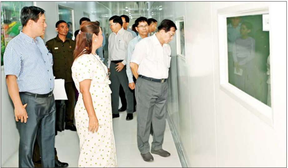
ပြည်ထောင်စုသမ္မတမြန်မာနိုင်ငံတော် နိုင်ငံတော်သမ္မတ ဦးမင်းအောင်လှိုင် ပြည်ထောင်စုနယ်မြေ နေပြည်တော် ပျဉ်းမနားမြို့ကျီးအင်း ကျေးရွာရှိ အေးခဲဟင်းသီးဟင်းရွက်ထုတ်လုပ်တင်ပို့ခြင်းလုပ်ငန်း (Myanmar Agri Foods Co.,Ltd.) တွင် ကြည့်ရှုလေ့လာစဉ်။

❖ နေပြည်တော်ကောင်စီနယ်မြေအတွင်းရှိ လမ်းများအားလုံးကို စနစ်တကျဖြစ်စေရေးနှင့် နောင်အနာဂတ်တွင် တိုးတက်လာမည့် မြို့ပြလူဦးရေနှင့် ယာဉ်အသုံးပြုမှု များပြားလာနိုင်မှုအပေါ် တွက်ချက်၍ တိုးချဲ့အဆင့်မြှင့်တင်နိုင်ရေးအတွက်လည်း စီမံဆောင်ရွက် ❖ ဟင်းသီးဟင်းရွက်များကို Green House များဖြင့် တစ်အုပ်တစ်မ ရာသီမရွေးစိုက်ပျိုး ထုတ်လုပ်နိုင်အောင် သုတေသနပြုလုပ်၍ ဆောင်ရွက်သွားမည်ဆိုပါက ကုန်ကြမ်းသီးနှံများ ပိုမို ရရှိနိုင်မည်ဖြစ်ပြီး ထုတ်ကုန်များ ပိုမိုထုတ်လုပ်နိုင်ကာ ပြည်တွင်း၊ ပြည်ပဈေးကွက်များသို့ တင်ပို့ရောင်းချနိုင်ခြင်းဖြင့် နိုင်ငံအတွက် နိုင်ငံခြားဝင်ငွေများ ပိုမိုရရှိနိုင်မည်