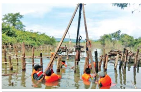
သဘာဝဓာတ်ငွေ့ပိုက်လိုင်းများ ပြင်ဆင်နေမှုကို တွေ့ရစဉ်။