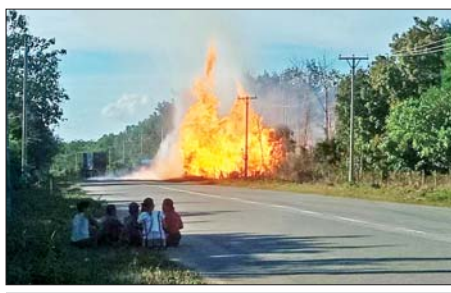
ဓာတ်အားပေးစက်ရုံများသို့ ပို့လွှတ်သည့် သဘာဝဓာတ်ငွေ့ ပိုက်လိုင်းများ ဖျက်ဆီးခံရမှုကို တွေ့ရစဉ်။