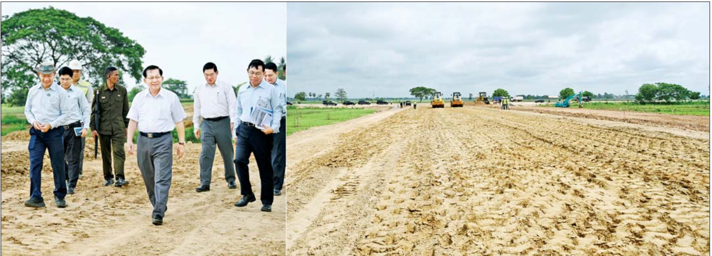
ပြည်ထောင်စုသမ္မတမြန်မာနိုင်ငံတော် နိုင်ငံတော်သမ္မတ ဦးမင်းအောင်လှိုင် ပြည်ထောင်စုနယ်မြေ နေပြည်တော်လေဆိပ် အဝင်လမ်းသစ်ဖောက်လုပ်နေမှုကို ကြည့်ရှုစစ်ဆေးစဉ်။