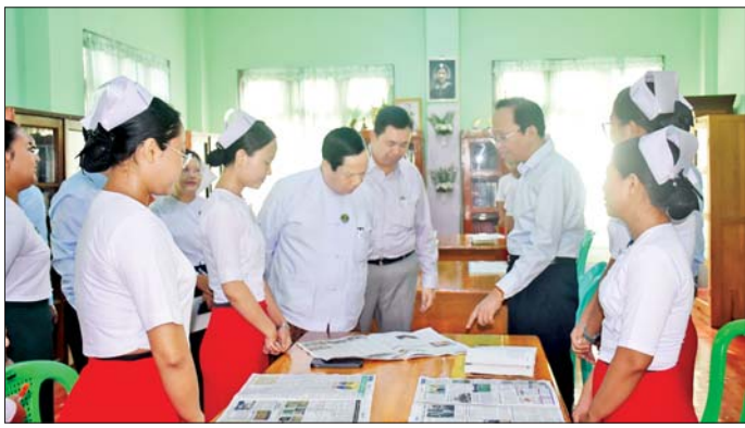
မွန်လွဲပိုင်းတွင် (၁၆)ခုတင်ဆုံ တိုင်းရင်းဆေးရုံ လှည့်လည်ကြည့်ရှု၍ ချီးမြှင့်ငွေများ ပေးအပ်ခဲ့ (ပုသိမ်)သို့ သွားရောက်၍ အတွင်းလူနာဆောင်၊ ကြောင်း သိရသည်။ သံဃာဆောင်၊ အကြောပြင်ဌာနနှင့် ဆေးရုံအတွင်း သတင်းစဉ်

များ၊ သူနာပြုသိပ္ပံအဖြစ် အဆင့်မြှင့်တင်နိုင်ရေးကိစ္စ များ၊ အကြီးစားမွမ်းမံပြင်ဆင်ခြင်းလုပ်ငန်းများကို ဆွေးနွေးမှာကြားသည်။ ယင်းနောက် ပုသိမ်ပြည်သူ့ဆေးရုံကြီး ကိုးထပ် ကုသဆောင် အစည်းအဝေးခန်းမ၌ ဧရာဝတီ တိုင်းဒေသကြီးအတွင်းရှိ ပြည်သူ့ကျန်းမာရေး၊ ကုသရေး၊ အစားအသောက်နှင့် ဆေးဝါးကွပ်ကဲရေး၊ တိုင်းရင်းဆေးပညာဦးစီးဌာနတို့မှ တာဝန်ရှိသူများ၊ ပုသိမ်ပြည်သူ့ဆေးရုံကြီးမှ ဆေးရုံအုပ်ကြီး၊ အထူးကု ဆရာဝန်ကြီးများ၊ သူနာပြုအုပ်ကြီးနှင့် သူနာပြုများ၊ ဝန်ထမ်းများနှင့်တွေ့ဆုံ၍ ကုသမှုအရည်အသွေး နှင့်ဝန်ဆောင်မှုများ ပိုမိုကောင်းမွန်စေရေး ဆွေးနွေး သည်။