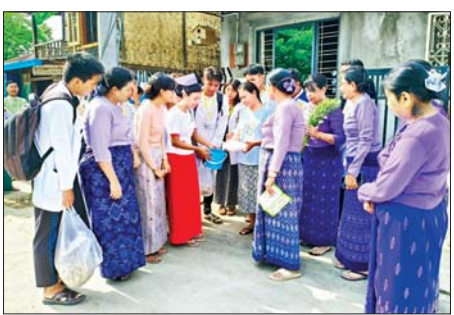
သွေးလွန်တုပ်ကွေးရောဂါကြိုတင် ဟောပြောခဲ့ပြီး ဓာတ်ဆားထုပ် ကာကွယ်ရေး အသိပညာပေး များ ပြန်ပေးခဲ့သည်။

တောင်တွင်းကြီး မေ ၂၃ မကွေးတိုင်း ဒေသကြီး တောင်တွင်းကြီး မြို့နယ်၌ သွေးလွန်တုပ်ကွေးရောဂါ ကြိုတင် ကာကွယ်ရေး အသိပညာပေးခြင်း နှင့် အတိတ်ဆေးခတ်ခြင်းများကို ယနေ့နံနက်ပိုင်းက ရပ်ကွက်/ ကျေးရွာများတွင် ကွင်းဆင်း ဆောင်ရွက်ခဲ့သည်။