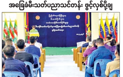
မှ သင်တန်းသား ၇၀ ဖြင့် အကြံ ဖွင့်လှစ် သင်ကြားပေးမည်ဖြစ် အခြေခံမီးသတ်ပညာသင်တန်းကို ကြောင်း သိရသည်။ တစ်ပတ်ကြာ စာတွေ့၊ လက်တွေ့ ခရိုင်(ပြန်/ဆက်)

အဆိုပါသင်တန်းသို့ ဟင်္သာတ ခရိုင်အတွင်းရှိ ဟိုတယ်၊ မိုတယ် နှင့် တည့်ခိုခန်းများ၊ စက်သုံးဆီ အရောင်းဆိုင် များ၊ ဆေးရုံများ၊ အလုပ်ရုံများ၊ ပရဟိတအသင်းများ