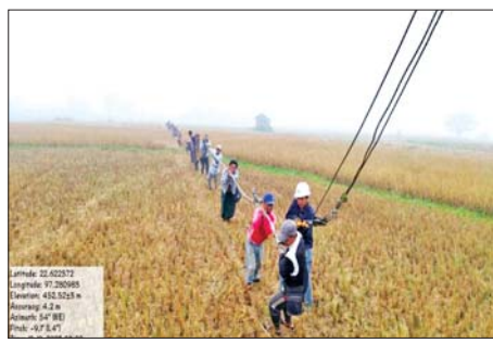
လျှပ်စစ်ဓာတ်အားစနစ် ပြင်ဆင်နေမှုကို တွေ့ရစဉ်။