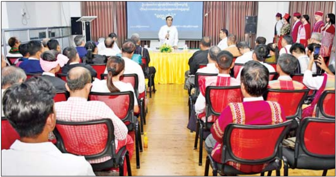
တိုင်းရင်းသားရေးရာကိစ္စရပ်များ၊ ဆက်လက် ဆောင်ရွက်သွားမည့်လုပ်ငန်းများကို ရှင်းလင်း ဆွေးနွေးတင်ပြသည်။ ယင်းနောက် ကချင်၊ ကရင်၊ ဇီတုန်(ချင်း)၊ ဟွာလိုင်

ရန်ကုန် မေ ၂၀ တိုင်းရင်းသားလူမျိုးများရေးရာ ဝန်ကြီးဌာန ပြည်ထောင်စုဝန်ကြီး ဦးသန်းမောင်၊ ရန်ကုန်တိုင်းဒေသကြီး ကရင်တိုင်းရင်းသားလူမျိုးရေးရာဝန်ကြီး ဦးစောကျော်ကော့ထူး၊ ရခိုင်တိုင်းရင်းသားလူမျိုးရေးရာဝန်ကြီး ဦးနေမင်းထွန်းတို့သည် ယမန်နေ့ မနန်းလှပိုင်တွင် ရန်ကုန်မြို့ရှိ တိုင်းရင်းသားလူမျိုးများရေးရာဝန်ကြီးဌာန ရန်ကုန်တိုင်းဒေသကြီး ညွှန်ကြားရေးမှူးရုံး အစည်းအဝေးခန်းမ၌ ရန်ကုန်တိုင်းဒေသကြီးအတွင်းရှိ တိုင်းရင်းသားစာပေနှင့် ယဉ်ကျေးမှုအသင်းအဖွဲ့များနှင့် တွေ့ဆုံဆွေးနွေးသည်။ ဦးစွာ ပြည်ထောင်စုဝန်ကြီးက အမှာစကားပြောကြားပြီး ကရင်တိုင်းရင်းသားလူမျိုးရေးရာဝန်ကြီးနှင့် ရခိုင်တိုင်းရင်းသားလူမျိုးရေးရာဝန်ကြီးတို့က လက်ရှိဆောင်ရွက်နေသည့် လုပ်ငန်းများ၊