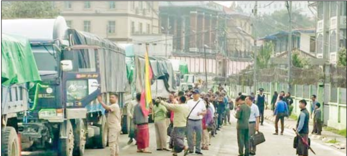
ထောက်ပံ့ရေးပစ္စည်းများသယ်ဆောင်လာသည့် မော်တော်ယာဉ်တန်းများ ဟားခါးမြို့သို့ ရောက်ရှိစဉ်။

ထောက်ပံ့ရေးပစ္စည်းများ ပါဝင်သည့် မော်တော်ယာဉ်များနှင့် မော်တော်ဆိုင်ကယ်များသည် မေ ၂၀ ရက်တွင် ဟားခါးမြို့သို့ရောက်ရှိခဲ့ပြီးဖြစ်သည်။ အဆိုပါ အခြေခံစားသောက်ကုန်များ၊ လူသုံးကုန်ပစ္စည်းများနှင့် ကူညီထောက်ပံ့ရေး ပစ္စည်းများ ပါဝင်သည့် မော်တော်ယာဉ်များနှင့် မော်တော်ဆိုင် ကယ်များသည် ဌာနဆိုင်ရာ ဝန်ထမ်းများနှင့် အတူ ယနေ့တွင် ဟားခါးမြို့သို့ ဆက်လက်ထွက်ခွာကြပြီး ဟားခါးမြို့ရှိ ဒေသခံတိုင်းရင်းသားပြည်သူများ၏ စားဝတ်နေရေး အဆင်ပြေချောမွေ့စေရေး၊ ကျောင်းဖွင့်ရာသီအစီ ကျောင်းသုံးပြဋ္ဌာန်းစာအုပ်များနှင့် စာရေးကိရိယာများ အချိန်မီရောက်ရှိရေး၊ ကျန်းမာရေးစောင့်ရှောက်မှု လုပ်ငန်းများ