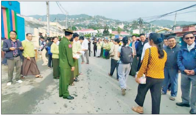
ဟားခါးမြို့သို့ ဌာနဆိုင်ရာဝန်ထမ်းများ ပြန်လည်ရောက်ရှိလာရာ တာဝန်ရှိသူများနှင့် ဒေသခံပြည်သူ များက ကြိုဆိုကြစဉ်။

နေပြည်တော် မေ ၂၁ တပ်မတော်အနေဖြင့် ပြည်သူ လူထု အေးချမ်းစွာ နေထိုင်နိုင်ရေး အတွက် အကြမ်းဖက်သောင်းကျန်း သူများ ယာယီစိုးမိုးပြီး အကြမ်းဖက် လုပ်ရပ်များ လုပ်ဆောင်လျက်ရှိ သည့် ဒေသများ၌ အကြမ်းဖက် ချေမှုန်းရေး စစ်ဆင်ရေး (Counter-Terrorism Operation)များကို ပြည်သူလူထု၏ ဖူးပေါင်းပါဝင်မှု ဖြင့် ဆောင်ရွက်၍ မြို့ရွာများအား အဆင့်ဆင့် ပြန်လည်သိမ်းပိုက်ပြီး အရေးပါသည့် ဆက်သွယ်ရေး လမ်းကြောင်းများအား ပြန်လည် ဖွင့်လှစ်ပေးခြင်း၊ အကြမ်းဖက် သမားများကြောင့် ယာယီနေရပ် စာမျက်နှာ ၅ ကော်လံ ၁ သို့ ၂