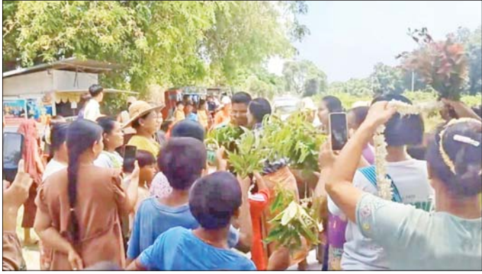
ပြည်သူ့စစ်မှုထမ်းသင်တန်းအမှတ်စဉ် (၂/၂၀၂၄) မှ ပြည်သူ့စစ်မှုထမ်းများ၏ အိမ်အပြန်ခရီးလမ်းများတွင် မိသားစုဝင်များနှင့် ဒေသခံပြည်သူများက ဝမ်းမြောက်စွာ ဂုဏ်ပြုကြိုဆိုကြစဉ်။

ထိုသို့ နိုင်ငံတော်အတွက် နိုင်ငံသားကောင်း၊ တပ်မတော်အတွက် စစ်သည်တော်ကောင်းတစ်ဦး ဝိသစ္စာ တာဝန်များကို ကျေပွန်စွာထမ်းဆောင်ခဲ့ကြသည့် နိုင်ငံသားကောင်း ပြည်သူ့စစ်မှုထမ်းများသည် ၎င်းတို့၏ဘဝတွင် နိုင်ငံတော်အပေါ် သစ္စာစောင့်သိမှု၊ စည်းကမ်းလိုက်နာမှုနှင့် ကိုယ်ကျိုးမမက်ဘဲ အနစ်နာခံမှုတို့ဖြင့် ပေးအပ်လာသော နိုင်ငံတော်ကာကွယ်ရေးတာဝန်များကို အမြဲတမ်းစစ်မှုထမ်းများနှင့်လက်တွဲ၍ ဂုဏ်ယူစွာထမ်းဆောင်ခဲ့ကြသူများအဖြစ်လည်းကောင်း၊ ဥပဒေပါပြဋ္ဌာန်းချက်များအတိုင်း စည်းကမ်းလိုက်နာ၍ ပေးအပ်လာသည့် နိုင်ငံတာဝန်များကို နိုင်ငံကြီးသားဝိသစ္စာ တာဝန်ကျေပွန်ခဲ့ကြသူများအဖြစ်လည်းကောင်း၊ သမိုင်းဝင်ကမ္ဘာ့ဇွန်နီရပ်ကမ်းတိုင်းမှတ်တမ်းဝင်ခဲ့ကြပြီဖြစ်သည်။ ထို့ကြောင့် နိုင်ငံသားကောင်း ပြည်သူ့စစ်မှုထမ်းများ၏ အိမ်အပြန်ခရီးများသည်လည်း ၎င်းတို့၏ တာဝန်ကျေပွန်စွာ ထမ်းဆောင်ခဲ့မှုကြောင့် ဂုဏ်ယူရမှု၊ မိသားစုဖြင့် ပြန်လည်ဆုံ့ဆည်းရမှုကြောင့် ဝမ်းသာပျော်ရွှင်ရမှုတို့ဖြင့် ပြည့်စုံလျက်ရှိပြီး ၎င်းတို့၏မိသားစုဝင်များသာမက ဒေသခံပြည်သူများကပါ ဝမ်းသာ