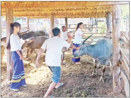
ရန်ကုန် မေ ၂၀