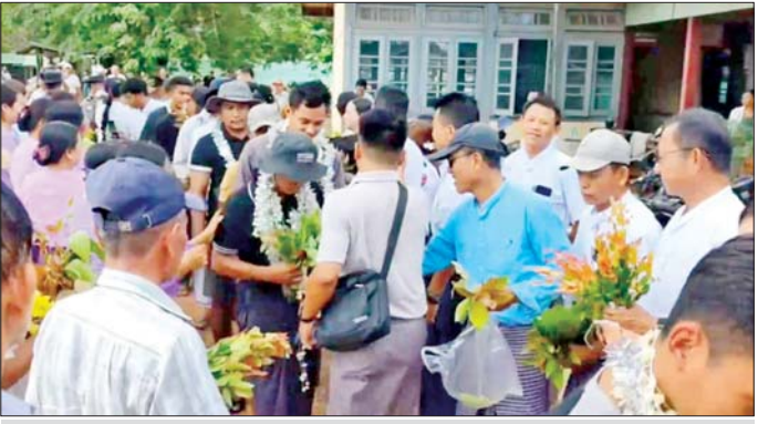
ပြည်သူ့စစ်မှုထမ်းသင်တန်းအမှတ်စဉ်(၂/၂၀၂၄)မှ ပြည်သူ့စစ်မှုထမ်းများ၏ အိမ်အပြန်ခရီးလမ်းများတွင် မိသားစုဝင်များနှင့် ဒေသခံပြည်သူများက ဝမ်းမြောက်စွာ ဂုဏ်ပြုကြိုဆိုကြစဉ်။

နေပြည်တော် မေ ၂၁ “နိုင်ငံသားတိုင်းသည် ဥပဒေပြဋ္ဌာန်းချက်များနှင့်အညီ စစ်ပညာသင်ကြားရန်နှင့် နိုင်ငံတော်ကာကွယ်ရေးအတွက် စစ်မှုထမ်းရန် တာဝန်ရှိသည်” ဟူသည့် ပြည်ထောင်စုသမ္မတမြန်မာနိုင်ငံတော် ဖွဲ့စည်းပုံအခြေခံဥပဒေ(၂၀၀၈ ခုနှစ်)ပါ ပြဋ္ဌာန်းချက်များကို လက်တွေ့အကောင်အထည်ဖော်ခဲ့သည့် ပြည်သူ့စစ်မှုထမ်းဥပဒေအရ မိမိဆန္ဒအလျောက် စိတ်အားထက်သန်စွာ ပါဝင်စာရင်းပေးခဲ့သော ပြည်သူ့စစ်မှုထမ်းများအား သင်တန်းအမှတ်စဉ်များအလိုက် လေ့ကျင့်သင်ကြားပေးလျက်ရှိပြီး အဆိုပါ နိုင်ငံသားကောင်းရတနာများသည် တပ်ရင်း/တပ်ဖွဲ့အသီးသီး၌ နိုင်ငံတော်ကာကွယ်ရေးနှင့် နယ်မြေတည်ငြိမ်အေးချမ်းရေးတာဝန်များကို စွမ်းစွမ်းတစ်ထမ်းဆောင်လျက်ရှိကြသည်။ စာမျက်နှာ ၅ ကော်လံ ၁ သို့ ။