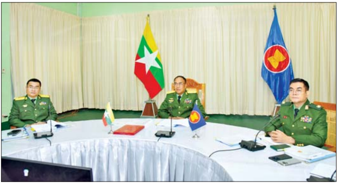
တပ်မတော်စစ်ဘက်ရေးရာလုံခြုံရေးအရာရှိချုပ် ဒုတိယဗိုလ်ချုပ်ကြီး ကျော်ကိုထိုက် ဦးဆောင်သည့် ကိုယ်စားလှယ်အဖွဲ့ အစည်းအဝေးတက်ရောက်စဉ်။

ကမ္ဘောဒီးယား ဘုရင့်တပ်မတော်ကာကွယ်ရေး ဦးစီးချုပ် General Vong Pisenနှင့် ကိုယ်စားလှယ် အဖွဲ့များ၊ အင်ဒိုနီးရှား အမျိုးသားတပ်မတော်စစ်ဦးစီး အရာရှိချုပ် General Agus Subiyanto နှင့် ကိုယ်စား လှယ်အဖွဲ့များ၊ လာအိုပြည်သူ့တပ်မတော် ဒုတိယ ဝန်ကြီးနှင့် စစ်ဦးစီးဌာနအကြီးအကဲ Lieutenant General Satchay Kommasith နှင့် ကိုယ်စားလှယ် အဖွဲ့များ၊ မလေးရှားတပ်မတော်ကာကွယ်ရေးဦးစီးချုပ် General Dato Seri Haji Malek Razak bin Sulai Man နှင့် ကိုယ်စားလှယ်အဖွဲ့များ၊ ဖိလစ်ပိုင် တပ်မတော်မှ စစ်ဦးစီးချုပ် General Romeo Saturnino Brawner Jr နှင့် ကိုယ်စားလှယ်အဖွဲ့များ၊ စင်ကာပူတပ်မတော်ကာကွယ်ရေးဦးစီးချုပ် Vice Admiral Aaron Beng Yao Cheng နှင့် ကိုယ်စားလှယ် အဖွဲ့များ၊ ထိုင်းဘုရင့်တပ်မတော်ကာကွယ်ရေး ဦးစီးချုပ် General Ukirs Boontanondha နှင့် ကိုယ်စားလှယ်အဖွဲ့များ၊ တီမောလက်စ်တေ တပ်မတော်စစ်ဦးစီးအရာရှိချုပ် Lieutenant General Domingos Raul နှင့် ကိုယ်စားလှယ်အဖွဲ့များ၊ ဗီယက်နမ် ပြည်သူ့တပ်မတော်ဒုတိယဝန်ကြီးနှင့် စစ်ဦးစီးအရာရှိချုပ် General Nguyen TanCuong နှင့် ကိုယ်စားလှယ်အဖွဲ့များ တက်ရောက်ကြသည်။