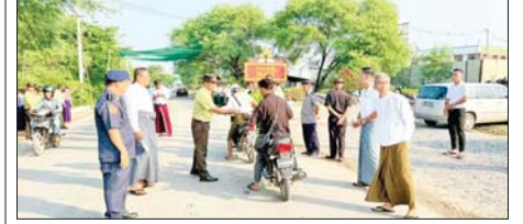
မန္တလေးတိုင်းဒေသကြီး တံတားဦးမြို့ အဝင်/အထွက်လမ်းအနီး လမ်းဘေး ဝဲ/ယာ တစ်လျှောက်နှင့် မြို့မဈေးတို့၌ မေ ၃၀ ရက်တွင် မြို့နယ်အထွေထွေအုပ်ချုပ်ရေးဦးစီးဌာနက ဦးဆောင်ကာ ကျောင်းအပ်နှံရေး သီတင်းပတ်လှုပ်ရှားမှုအဖြစ် အသိပညာပေးလက်ကမ်းစာစောင်များ အခမဲ့ဖြန့်ဝေပေးစဉ်။ မြို့နယ်(ပြန်/ဆက်)

◆ AYA မှ မြန်မာနိုင်ငံဘောလုံးအဖွဲ့ချုပ်သည် မြန်မာ့လက်ရွေးစင်အမျိုးသမီးအသင်းအတွက် ရည်ရွယ်ကျင်းပသည့် ပြိုင်ပွဲဖြစ်ပြီး သုံးသင်းပတ်လည်စနစ်ဖြင့် ကျင်းပကာ အမှတ်အများဆုံးအသင်း ဗိုလ်စွဲမည်ဖြစ်သည်။ ပွဲစဉ်ရေးဆွဲထားမှုအရ ဇွန် ၃ ရက်တွင် မြန်မာအသင်းနှင့် ဥဒဘက်ကစွာတန်အသင်း၊ ဇွန် ၆ ရက်တွင် ဥဒဘက်ကစွာတန်အသင်းနှင့် ထိုင်းအသင်း၊ ဇွန် ၉ ရက်တွင် မြန်မာအသင်းနှင့် ထိုင်းအသင်းတို့ ယှဉ်ပြိုင်ကစားမည်ဖြစ်ပြီး ပွဲအားလုံးကို ညနေ ၄ နာရီတွင် သုဝဏ္ဏကွင်း၌ ပြုလုပ်မည်ဖြစ်သည်။ ပြိုင်ပွဲဖြစ်မြောက်ရေးအတွက် AYA Bank က Title Sponsor အဖြစ် ပံ့ပိုးကူညီပေးထားပြီး အခမဲ့ရုပ်သံလိုင်းများမှ တိုက်ရိုက်ထုတ်လွှင့်ပြသမည်ဖြစ်သလို ကြိုတင်လက်မှတ်ရောင်းချမည့်အစီအစဉ်ကို မကြာမီထုတ်ပြန်မည်ဖြစ်သည်။ သတင်း-ကိုညီလေး