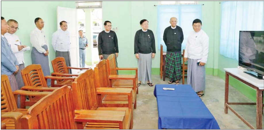
လွှတ်တော်အစည်းအဝေးများ ကျင်းပရေး ဗဟိုကော်မတီနာယက ပြည်ထောင်စုလွှတ်တော်နာယက ဦးအောင်လင်းဇွေးနှင့် အဖွဲ့ဝင်များ နေပြည်တော် စည်ပင်ဧည့်ရိပ်သာ(၂)တွင် ကြည့်ရှုစစ်ဆေးစဉ်။

ဦးစွာ လွှတ်တော်အစည်းအဝေးများ ကျင်းပရေးဗဟိုကော်မတီ နာယက က အဖွင့်အမှာစကား ပြောကြားရာတွင် လာမည့် ဇွန် ၂ ရက်မှ ဒီဇင်ဘာ ၃၁ ရက်အတွင်း ဒုတိယပုံမှန် အစည်းအဝေး၊ တတိယပုံမှန် အစည်းအဝေးကို ကျင်းပပြုလုပ်ရန် ပြည်ထောင်စု လွှတ်တော်ရုံးက လွှတ်တော် ကြံ့မြံရေး လုပ်ငန်းများ ပြီး သက်ဆိုင်ရာ အဖွဲ့အစည်းများကို ကြိုတင်သိအောင် ပေးပို့ထားရှိပြီး ဖြစ်ပါကြောင်း၊ ပြည်ထောင်စုလွှတ်တော်၊ ပြည်သူ့ လွှတ်တော်နှင့် အမျိုးသား လွှတ်တော်များ၏ ဒုတိယပုံမှန် အစည်းအဝေး ကျင်းပနိုင်ရန် လွှတ်တော်ကိုယ်စားလှယ်များထံ