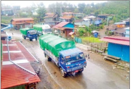
ထောက်ပံ့ရေးပစ္စည်းများသယ်ဆောင်လာသည့် မော်တော်ယာဉ်တန်းများ ဟားခါးမြို့သို့ ထွက်ခွာစဉ်။

စွန့်ခွာခဲ့ရသည့် ဒေသခံပြည်သူများအနေဖြင့် ၎င်းတို့၏ နေရပ်သို့ ပြန်လည်ဝင်ရောက် နေထိုင်နိုင်ရေး၊ အစိုးရအုပ်ချုပ်မှုယန္တရားများ ပြန်လည်လည်ပတ်ကာ ဒေသခံပြည်သူလူထု၏ လူမှုစီးပွားဘဝများ ဖွံ့ဖြိုးတိုးတက်အောင် ပြန်လည်ဖော်ဆောင်ပေးနိုင်ရေး၊ စားသောက်နေထိုင်မှု အဆင်ပြေစေရေးနှင့် ပြန်လည်ထူထောင်ရေးလုပ်ငန်းများကို နိုင်ငံတော်အစိုးရနှင့် လက်တွဲဆောင်ရွက်ပေးလျက်ရှိသည်။