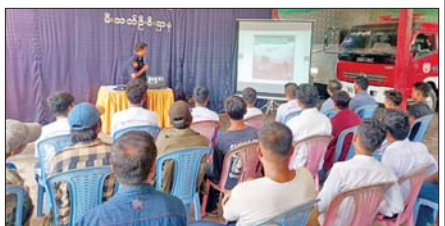
ရောဂါတိုင်းဒေသကြီး မော်လမြိုင်ကျွန်းမြို့နယ်၌ သီးသန့်ဦးသတ်တပ်ဖွဲ့ဝင်များ အကြံအခြေခံဦးသတ်ပညာသင်တန်းကို မေ ၁၈ ရက်နံနက်ပိုင်းက မြို့နယ်ဦးသတ်စခန်း၌ ဖွင့်လှစ်သင်ကြားစဉ်။