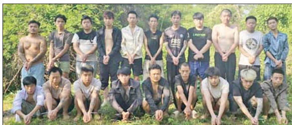
မိုင်းခတ်မြို့နယ်အတွင်း အွန်လိုင်းလိမ်လည်လောင်းကစားမှုကျူးလွန်ခဲ့သည့် တရားမဝင် တရုတ်နိုင်ငံသား အမျိုးသား ၂၀ အား တွေ့ရစဉ်။

ရေးနှင့် မြန်မာနိုင်ငံအတွင်း အခြေချလုပ်ကိုင်နိုင်မှု မရှိစေရေးအတွက် အိမ်နီးချင်းနိုင်ငံများ၊ ဒေသ တွင်းနိုင်ငံများ၊ နိုင်ငံတကာအဖွဲ့အစည်းများနှင့် ပူးပေါင်း၍ အွန်လိုင်းလိမ်လည်လောင်းကစားမှု တိုက်ဖျက်ရေးလုပ်ငန်းစဉ်များကို တက်ကြွစွာ ဆက်လက်ဆောင်ရွက်လျက်ရှိကြောင်း သိရသည်။ သတင်းစဉ်