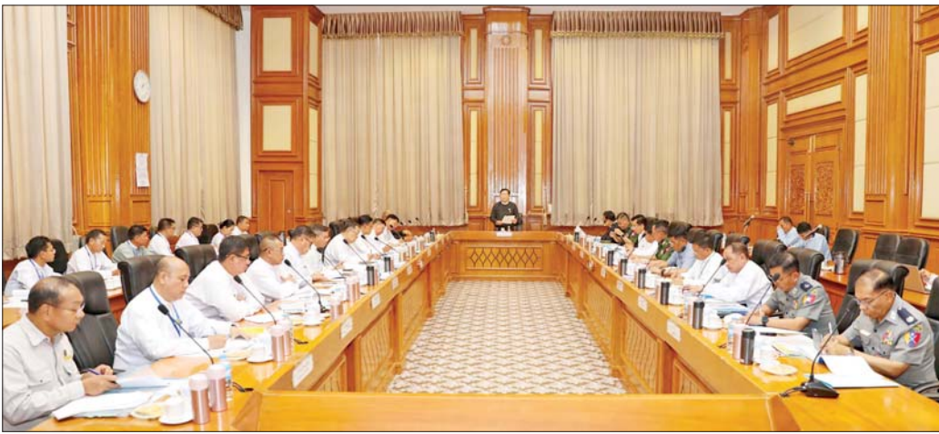
လွှတ်တော်အစည်းအဝေးများ ကျင်းပရေးဗဟိုကော်မတီနာယက ပြည်ထောင်စုလွှတ်တော်နာယက ဦးအောင်လင်းဌေး၊ လွှတ်တော်အစည်းအဝေးများကျင်းပရေးဗဟိုကော်မတီနှင့် လုပ်ငန်းကော်မတီများ လုပ်ငန်းညှိနှိုင်းအစည်းအဝေး(၁/၂၀၂၆)တွင် အမှာစကားပြောကြားစဉ်။

နေပြည်တော် မေ ၂၁ တတိယအကြိမ် ပြည်ထောင်စုအဆင့် လွှတ်တော်များ၏ ဒုတိယပုံမှန်အစည်းအဝေးများ အောင်မြင်စွာကျင်းပနိုင်ရေး လွှတ်တော်အစည်းအဝေးများ ကျင်းပရေးဗဟိုကော်မတီနှင့် လုပ်ငန်းကော်မတီများ လုပ်ငန်းညှိနှိုင်းအစည်းအဝေး (၁/၂၀၂၆)ကို ယနေ့မွန်းလွဲပိုင်းတွင် နေပြည်တော်ရှိ လွှတ်တော်အဆောက်အအုံ ဓမ္မဃီရုံဆောင် အစည်းအဝေးခန်းမ၌ ကျင်းပသည်။