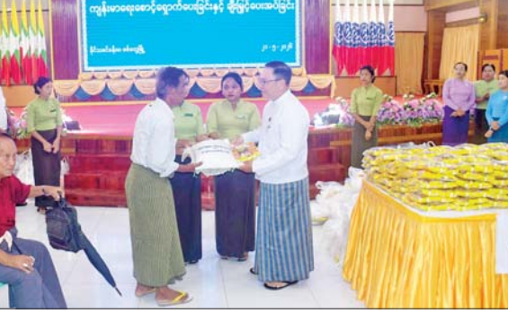
စရိတ်ချေးငွေများ ထုတ်ချေးပေးနေမှုများကို လှည့်လည်ကြည့်ရှုအားပေးသည်။ ယမန်နေ့ညနေပိုင်းက စစ်တွေမြို့ပေါ်ရှိ အခြေခံပညာကျောင်းများတွင် ကျောင်းအပ်နှံရေးသားတင်ပို့မတိုင်မီ ကြိုတင်ပြင်ဆင်ဆောင်ရွက်ထားရှိမှုသင်ရိုးညွှန်တမ်းစာအုပ်များ ရောက်ရှိပြင်ဆင်ထားရှိမှုနှင့် စာကြည့်တိုက်များတွင် သုတ၊ ရသ စာအုပ်စာစောင်များ စနစ်တကျ ဆောင်ရွက်ထားရှိမှုများကို ကြည့်ရှုစစ်ဆေးခဲ့ကြောင်း သိရသည်။ တင်ထွန်း(ပြန်/ဆက်)

စစ်တွေ မေ ၂၀ စစ်တွေမြို့နယ် အတွင်း အငြိမ်းစား ဝန်ထမ်းများအား ပင်စင်လစာ ထုတ်ပေးခြင်း၊ ကျန်းမာရေးစောင့်ရှောက်မှုပေးခြင်း၊ ဆန်နှင့် စားသောက်ဖွယ်ရာများ ချီးမြှင့်ပေးအပ်ခြင်းတို့ကို ယနေ့နံနက်ပိုင်းက စစ်တွေမြို့ နိုင်ငံသစ်ခန်းမ၌ ပြုလုပ်ရာ ရခိုင်ပြည်နယ်ဝန်ကြီးချုပ် ဦးနိုင်ဦး၊ ပြည်နယ်လွှတ်တော် ဒုတိယဥက္ကဋ္ဌ ပြည်နယ်ဝန်ကြီးများ တက်ရောက်ကြည့်ရှုအားပေးကြသည်။ ထို့နောက် မြန်မာ့လယ်ယာဖွံ့ဖြိုးရေးဘဏ် စစ်တွေခရိုင်ဘဏ်ခွဲသို့ သွားရောက်ကာ မြန်မာ့လယ်ယာဖွံ့ဖြိုးရေးဘဏ်ဝန်ထမ်းများက ၂၀၂၆ ဇွဲရာသီ စိုက်ပျိုး