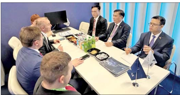
အချက်အလက် နည်းပညာ၊ များ အသုံးပြုဆောင်ရွက်နေမှု၊ များ ထုတ်လုပ်နေမှု၊ အသုံးပြု ဆိုက်ဘာလုံခြုံရေး နည်းပညာ ဆက်သွယ်ရေးနှင့်ဆက်စပ်ပစ္စည်း သည့် ပစ္စည်းများနှင့်ဆက်စပ်

နေပြည်တော် မေ ၂၁ ရုရှားဖက်ဒရေးရှင်းနိုင်ငံ Nizhny Novgorod မြို့၌ ရောက်ရှိနေသော သိပ္ပံနှင့်နည်းပညာ ဝန်ကြီးဌာန ပြည်ထောင်စုဝန်ကြီး ဒေါက်တာ မျိုးသိန်းကျော်သည် ယမန်နေ့ ညနေပိုင်းက Digitalization of Industrial Russia 2026 ဖိုရမ်တွင် ခင်းကျင်းပြသထားသော ပြခန်း များကို သွားရောက်ကြည့်ရှု လေ့လာသည်။