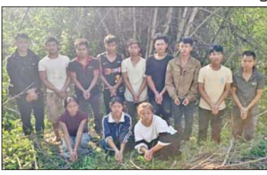
မိုင်းခတ်မြို့နယ်အတွင်း အွန်လိုင်းလိမ်လည်လောင်း ကစားမှု ကျူးလွန်ခဲ့သည့် မြန်မာနိုင်ငံသား အမျိုးသား ကိုးဦးနှင့် အမျိုးသမီး သုံးဦးအား တွေ့ရစဉ်။