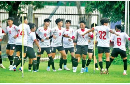
မြန်မာ့လက်ရွေးစင် အမျိုးသမီးအသင်း ကစားသမားများ လေ့ကျင့်စဉ်။

ရန်ကုန် မေ ၂၁ AYA Tri Nation Cup 2026 အမျိုးသမီးဖိတ်ခေါ်ပြိုင်ပွဲကို ဇွန် ၃ ရက် မှ ၉ ရက်အထိ ရန်ကုန်မြို့ရှိ သုဝဏ္ဏကွင်း၌ ကျင်းပမည်ဖြစ်ပြီး အိမ်ရှင် မြန်မာအသင်းနှင့်အတူ အာဆီယံထိပ်သီး ထိုင်းအသင်း၊ ခြေစွမ်းပိုင်း တိုးတက်လာသည့် အရှေ့အလယ်ပိုင်းအသင်းဖြစ်သော ဥဘောက်ကစွတန် အသင်းတို့ ဝင်ရောက်ယှဉ်ပြိုင်မည်ဖြစ်သည်။ စာမျက်နှာ ၁၆ ကော်လံ ၃ သို့ ၄