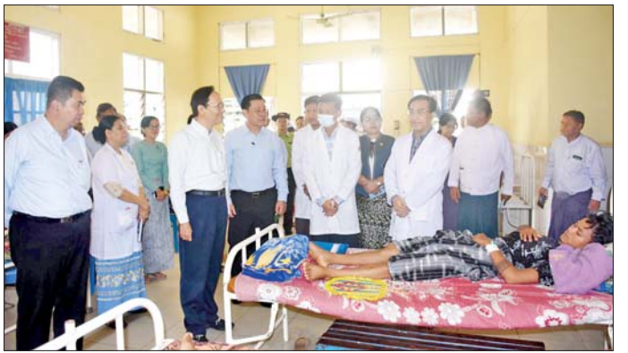
သူနာပြုများ၊ ဆေးရုံဝန်ထမ်းများနှင့်တွေ့ဆုံကာ ဆေးကုသရေးလုပ်ငန်းများနှင့် သင်ကြားရေး ဆွေးနွေးခဲ့ကြောင်း သိရသည်။ လုပ်ငန်းများ ပိုမိုတိုးတက်စေရေး သတင်းစဉ်

ဝန်ထမ်းများနှင့်တွေ့ဆုံ လိုအပ်သည်။ မကွေးပြည်သူ့ဆေးရုံကြီးအထွေထွေ ရောဂါကုသဆောင်၊ ဆီးချိုနှင့် ဟော်မုန်းရောဂါကုသဌာန၊ ဆီးနှင့်ကျောက်ကပ်ကုသဌာန၊ ကလေးကုသဆောင်၊ မွေးကင်းစအထူးကြပ်မတ်ကုသဆောင်၊ မျက်စိရောဂါကုသဆောင်တို့ကို လှည့်လည်ကြည့်ရှုသည်။ ယင်းနောက် အစည်းအဝေးခန်းမ၌ ဆေးရုံအုပ်ကြီး၊ ပါမောက္ခ/အထူးကု ဆရာဝန်ကြီးများ၊ လက်ထောက် ဆရာဝန်များ၊