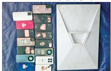
တရုတ်နိုင်ငံသား အမျိုးသား ၂၀ နှင့်အတူ သိမ်းဆည်းရမိ စတားလင့်တစ်လုံးနှင့် ဖုန်း ၁၅ လုံး အား တွေ့ရစဉ်။