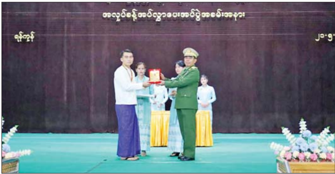
မပြတ် ကြိုးစားအားထုတ်လေ့လာမှုများကြောင့် ယခုအခါ မဟာဝိဇ္ဇာဘွဲ့ ၇၁ ဦး၊ မဟာသိပ္ပံဘွဲ့ ၁၄၇ ဦး၊ M.Res ဘွဲ့ ၅၅ ဦး၊ Ph.D ဘွဲ့ ၁၇ ဦး၊ B.E ဘွဲ့ ၃၀၀ ဦး၊ M.E ဘွဲ့ ၁၅ ဦး၊ B.Tech ၄၅၂ ဦး ရှိလာသည်မှာ အားရကျေနပ်ဖွယ်ဖြစ်ပါကြောင်း ပြောကြားပြီး ပြည်ထောင်စုဝန်ကြီးနှင့် ဝန်ကြီးဌာနများမှ ကိုယ်စား

နေပြည်တော် မေ ၂၁ ရန်ကုန်တိုင်းဒေသကြီး ဒဂုံဆိပ်ကမ်းမြို့နယ် ပြည်ထောင်စုတိုင်းရင်းသားလူငယ်များ စွမ်းရည် ဖွံ့ဖြိုးရေးဒီဂရီကောလိပ် (ရန်ကုန်) ၂၀၂၅-၂၀၂၆ ပညာ သင်နှစ် ဝိဇ္ဇာဘွဲ့၊ သိပ္ပံဘွဲ့ အမှတ်စဉ် (၂၂) သင်တန်း ဆင်းပွဲနှင့် အလုပ်ခန့်အပ်လွှာပေးအပ်ပွဲ အခမ်းအနား ကို ယနေ့နံနက်ပိုင်းက အဆိုပါ ဒီဂရီကောလိပ်ဘွဲ့နှင့် သဘင်ခန်းမ၌ ကျင်းပသည်။