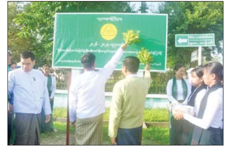
ပြင်ဦးလွင်ခရိုင် ပြင်ဦးလွင်မြို့ ရပ်ကွက်ကြီး (၂) မန္တလေး-လာရှိုး လမ်းဘေးရှိ လွတ်လပ်ရေးကျောက်တိုင်ကွင်းရှေ့၌ အခြေခံပညာ အထက်တန်းကျောင်းအုပ်ကြီးများ၊ အလယ်တန်းကျောင်းအုပ်ကြီး များ၊ မူလတန်းကျောင်းအုပ်ကြီးများနှင့် ဆရာ ဆရာမများက ၂၀၂၆-၂၀၂၇ ပညာသင်နှစ် ကျောင်းအပ်နှံရေးသင်တန်းပတ် မြေစိုက်ပို့စတာ ကို မေ ၂၀ ရက်က စိုက်ထူကြစဉ်။ ခရိုင်(ပြန်/ဆက်)

ရခိုင်ပြည်နယ်တို့တွင် ၈၃ ရာခိုင်နှုန်းမှ ၉၄ ရာခိုင်နှုန်းအတွင်း အသီးသီးရှိနိုင်သည်။ ပင်ဋေ့ရေးပြန်နှုန်းအခြေအနေ တနင်္သာရီတိုင်းဒေသကြီး၊ ကရင်ပြည်နယ်၊ ချင်းပြည်နယ်၊ မွန်ပြည်နယ်၊ ရခိုင်ပြည်နယ်နှင့် ရှမ်းပြည်နယ်တောင်ပိုင်းတို့တွင် ၂၅ မီလီမီတာ မှ ၃၄ မီလီမီတာအတွင်း၊ နေပြည်တော်၊ ရန်ကုန်တိုင်းဒေသကြီး၊ ပဲခူးတိုင်းဒေသကြီး၊ စစ်ကိုင်းတိုင်းဒေသကြီးအထက်ပိုင်း၊ ဧရာဝတီ တိုင်းဒေသကြီး၊ ကယားပြည်နယ်နှင့် ရှမ်း ပြည်နယ်အရှေ့ပိုင်းတို့တွင် ၃၅ မီလီမီတာမှ ၄၄ မီလီမီတာအတွင်းနှင့် မန္တလေးတိုင်းဒေသ ကြီး၊ မကွေးတိုင်းဒေသကြီး၊ စစ်ကိုင်းတိုင်း ဒေသကြီးအောက်ပိုင်း၊ ကချင်ပြည်နယ်နှင့် ရှမ်းပြည်နယ်(မြောက်ပိုင်း)တို့တွင် ၄၅ မီလီမီတာ မှ ၅၄ မီလီမီတာအတွင်း အသီးသီးရှိနိုင်သည်။ မြေဆီလွှာအောင်းရေအခြေအနေ တနင်္သာရီတိုင်းဒေသကြီး၊ ပဲခူးတိုင်း ဒေသကြီးအရှေ့ပိုင်း၊ စစ်ကိုင်းတိုင်းဒေသကြီး အောက်ပိုင်း၊ ကယားပြည်နယ်၊ ကရင်ပြည်နယ်၊ မွန်ပြည်နယ်၊ ရခိုင်ပြည်နယ်နှင့် ရှမ်းပြည်နယ် တောင်ပိုင်းတို့တွင် (ပြည့်ဝ)အခြေအနေ၊ နေပြည်တော်တွင် (စိုစွတ်)အခြေအနေနှင့် ရန်ကုန်တိုင်းဒေသကြီး၊ မန္တလေးတိုင်းဒေသ ကြီး၊ ပဲခူးတိုင်းဒေသကြီး(အနောက်ပိုင်းနှင့် တောင်ပိုင်း)၊ မကွေးတိုင်းဒေသကြီး၊ စစ်ကိုင်း တိုင်းဒေသကြီးအထက်ပိုင်း၊ ဧရာဝတီတိုင်း ဒေသကြီး၊ ကချင်ပြည်နယ်၊ ချင်းပြည်နယ်နှင့် ရှမ်းပြည်နယ်(အရှေ့ပိုင်းနှင့် မြောက်ပိုင်း) တို့တွင်(မြောက်ပိုင်း)အခြေအနေ အသီးသီးရှိခဲ့ သည်။ မိုး/လေ