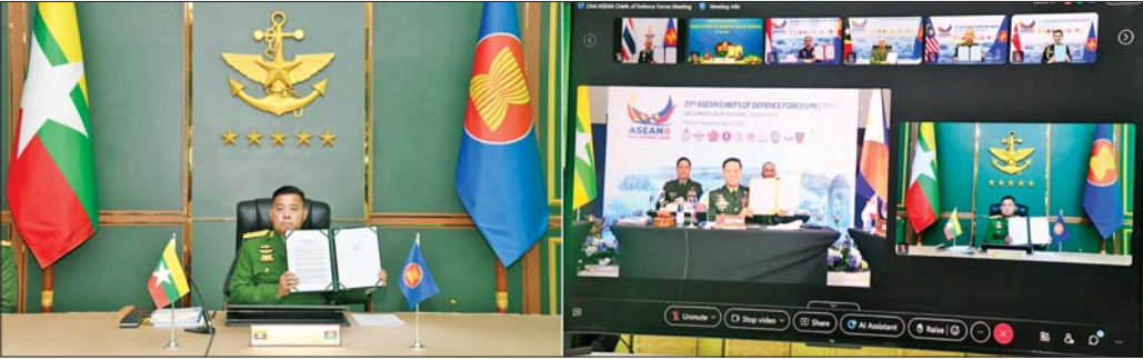
တပ်မတော်ကာကွယ်ရေးဦးစီးချုပ် ဗိုလ်ချုပ်ကြီး ရဲဝင်းဦး (၂၃)ကြိမ်မြောက်အာဆီယံတပ်မတော်ကာကွယ်ရေးဦးစီးချုပ်များ အစည်းအဝေး(23 rd ACDFM) ကို Video Conferencing စနစ်ဖြင့် တက်ရောက်စဉ်။

နေပြည်တော် မေ ၂၁ (၂၃)ကြိမ်မြောက်အာဆီယံတပ်မတော်ကာကွယ်ရေးဦးစီးချုပ်များ အစည်းအဝေး(23 rd ASEAN Chiefs of Defence Forces Meeting - 23 rd ACDFM)ကို ယနေ့နံနက်ပိုင်းတွင် Video Conferencing စနစ်ဖြင့် ကျင်းပပြုလုပ်သည်။ အဆိုပါအစည်းအဝေးသို့ မြန်မာ့တပ်မတော်မှ တပ်မတော်ကာကွယ်ရေးဦးစီးချုပ် ဗိုလ်ချုပ်ကြီး ရဲဝင်းဦး ဦးဆောင်သည့် ကိုယ်စားလှယ်အဖွဲ့ တက်ရောက်ကြပြီး ဘရူနိုင်းဘုရင့်တပ်မတော် ကာကွယ်ရေးဦးစီးချုပ် Major General Dato Bol Hassan နှင့် ကိုယ်စားလှယ်အဖွဲ့များ စာမျက်နှာ ၄ ကော်လံ ၁ သို့ ၆