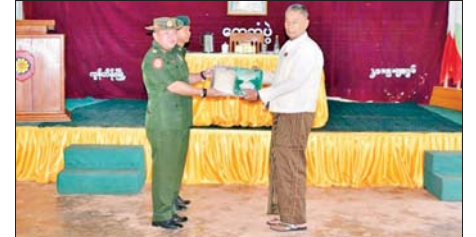
ဌာနချုပ်များမှ တာဝန်ရှိသူများက စစ်မှုထမ်းဟောင်းအဖွဲ့ဝင်များနှင့် အရန်အဖွဲ့ဝင်များအား စားရင်းနှီးနှီးလိုက်လံ နှုတ်ဆက်ခဲ့ကြကြောင်း သိရသည်။ သတင်းစဉ်

ကွန်ဟိန်းမြို့ရှိ စစ်မှုထမ်းဟောင်းအဖွဲ့ဝင်များနှင့် အရန်အဖွဲ့ဝင်များအား သွားရောက်တွေ့ဆုံ၊ စားသောက်ဖွယ်ရာများ ပေးအပ်ချီးမြှင့်