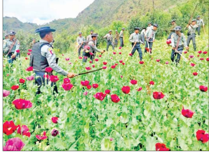
ရှမ်းပြည်နယ်(တောင်ပိုင်း) ဆီဆိုင်မြို့နယ်ရှိ ဘိန်းစိုက်ခင်းများကို သက်ဆိုင်ရာပူးပေါင်းအဖွဲ့က စုပေါင်းဖျက်ဆီးနေမှုမြင်ကွင်း။

ဘိန်းကိုဘိန်းပင်၏ အသီးမှဖြစ်ပေါ်လာပြီး ဘီစီ ၅၀၀၀ ခန့်က မြေထဲပင်လယ်ဒေသတွင် အစားအစာ၊ ဆေးဝါးနှင့် အခမ်းအနားများတွင် အသုံးပြုခဲ့ကြောင်း ရှေးဟောင်းဂရိစာပေမှတ်တမ်းများအရ တွေ့ရှိရပါသည်။ ဘီစီ ၃၄၀၀ ခန့်က အရှေ့အလယ်ပိုင်းရှိ ယူဖရေတီးနှင့် တီဂရစ်မြစ်အကြား မက်ဆိုပိုတေးမီးယားဒေသ ယခုခေတ်(အီရန်-အီရတ်-ဆီးရီးယား)ရှိ ဆူမေးရီးယန်းလူမျိုး(Sumerians) များက ဘိန်းပင် (Poppy)ကို အစောဆုံး စိုက်ပျိုးခဲ့ပြီး ဆူမေးရီးယန်းများက ဖျေရှင်မှုအပင် (Hul-gai) ဟုခေါ်ဆိုကြပါသည်။ “ဘိန်း”ဆိုသည် ဝေါဟာရမှာ မြန်မာမူရင်းစကားလုံးမဟုတ်ပါ။ ဘိန်းကို ဥရောပ အလယ်ပိုင်းနှင့် အာရှမိုင်းနားဒေသတွင် “အိဖွန်” ဟုခေါ်ဆို၍ ပါဠိဘာသာဖြင့် “အိဖီဖန်” (Ahiphena)၊ သက္ကတ-သင်္ဂဟစာ( Sanskrit) ဘာသာဖြင့် “အဖေန”၊ အိန္ဒိယဘာသာစကားဖြင့် “အဖိန်း” ဟုခေါ်ဆိုရာမှ မွန်-မြန်မာဘာသာဖြင့် “ဘိန်း” ဟုခေါ်ဆိုခဲ့ကြောင်း လေ့လာတွေ့ရှိရပါသည်။