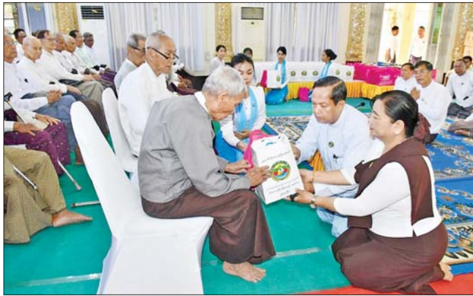
ကြီးမှူးကျင်းပသော ၁၃၈ ခုနှစ် မြန်မာ့ဆန်းတစ်ရက်နေ့ သက်ကြီးပူဇော်ပွဲ အခမ်းအနားသို့ တက်ရောက်ပြီး တိုင်းဒေသကြီးဝန်ကြီးချုပ်က

ထို့နောက် တိုင်းဒေသကြီးဝန်ကြီးချုပ်နှင့် တာဝန်ရှိသူများသည် ပုသိမ်မြို့ သာသနာ့ဗိမာန် တော်ကြီးတွင် ဧရာဝတီတိုင်းဒေသကြီးအစိုးရအဖွဲ့က