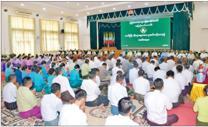
စေရန် ကုသိုလ်ကောင်းမှု ပွားများစေရန်နှင့် သဘာဝပတ်ဝန်းကျင် ဂေဟစနစ် ထိန်းသိမ်းရာ ရောက်သည့်အပြင် မင်္ဂလာကန်အတွင်း ငါးသယ်စာတမျှ ပိုမိုတိုးပွားလာစေရန် ရည်ရွယ်ဆောင်ရွက်ခြင်းဖြစ်သည်။ ဆက်လက်၍ နေပြည်တော်ကောင်စီဥက္ကဋ္ဌသည် နေပြည်တော်ကောင်စီရုံး ဧမ္မာသီရိခန်းမ၌ ကျင်းပသည့် သက်ကြီးဘိုးဘွားများအား ပူဇော်ကန်တော့ပွဲသို့ တက်ရောက်သည်။

နေပြည်တော် ဧပြီ ၁၇ နေပြည်တော် ကောင်စီက ကြီးမှူးကျင်းပသည့် ဇီဝိတဒါန ငါးလွတ်ပွဲကို ယနေ့နံနက်ပိုင်းတွင် ပြည်ထောင်စုနယ်မြေ နေပြည်တော် ဧမ္မာသီရိမြို့နယ်ရှိ မင်္ဂလာကန်၌ ကျင်းပရာ နေပြည်တော်ကောင်စီ ဥက္ကဋ္ဌ ဦးကဲမြင့်သန်းနှင့် ဦးစီးဌာနမှူး ဒုတိယဗိုလ်ချုပ်ကြီး ဖုန်းမြတ်နှင့် ဦးစီးဌာနမှူး ဒုတိယအမြဲတမ်းအတွင်းဝန်၊ ဒုတိယညွှန်ကြားရေးမှူးချုပ်များနှင့် ဦးစီးဌာနမှူး လက်ထောက်