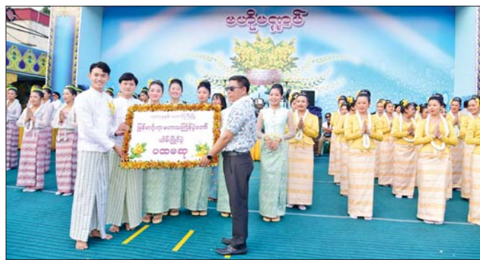
ထို့နောက် မြန်မာ့ရိုးရာ မဟာအတာသင်္ကြန် ပွဲတော် ပိတ်ပွဲတွင် ရှမ်းပြည်နယ်ဝန်ကြီးချုပ်က အမှာ စကားပြောကြားပြီး ဖျော်ဖြေရေးအဖွဲ့များက

ရရှိသော ၃၃ ဖွဲ့အား ရှမ်းပြည်နယ်ရဲတပ်ဖွဲ့၊ ရဲမှူးချုပ်၊ အစိုးရအဖွဲ့အတွင်းရေးမှူး၊ ပြည်နယ် စာရင်းစစ်ချုပ်၊ ပြည်နယ် တိုင်းရင်းသားလူမျိုးရေး ရာဝန်ကြီးများ၊ ပြည်နယ်ဥပဒေချုပ်၊ ပြည်နယ် ဝန်ကြီးများက ဆုများချီးမြှင့်ပေးကြသည်။ ဆုချီးမြှင့် ထို့နောက် ပြည်နယ်လုံခြုံရေးနှင့်နယ်စပ်ရေးရာ ဝန်ကြီး၊ ပြည်နယ်တရားလွှတ်တော် တရားသူကြီးချုပ်၊ ပြည်နယ်လွှတ်တော်ဥက္ကဋ္ဌနှင့် အရှေ့ပိုင်းစစ်ဌာနချုပ် တိုင်းမှူးတို့က ဆုရရှိသော ယိမ်းအဖွဲ့ များအား ဆုများ ချီးမြှင့်ပေးပြီး ပထမဆုရရှိသော တောင်ကြီး ပညာရေးဦးစိဂရီကလပ်ယိမ်းအဖွဲ့အား ပြည်နယ် ဝန်ကြီးချုပ် ဦးစိုင်းထိန်စိုးက ဆုချီးမြှင့်ပေး သည်။