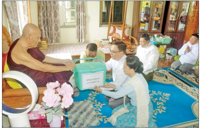
သင်္ကြန်အကျနေ့မှ သင်္ကြန်အတက်နေ့အထိ နေ့စဉ် သင်္ကြောင်း သိရသည်။ ဆွမ်းနှင့် လှူဖွယ်ဝတ္ထုများကို ဆက်ကပ်လှူဒါန်း

ဆက်လက်ပြီး ပြည်နယ်ဝန်ကြီးချုပ်နှင့်ဇနီး၊ ပြည်နယ်လွှတ်တော်ဥက္ကဋ္ဌတို့သည် ဦးရေကျော်သူကျောင်းတိုက်၊ မေ့ရိပ်သာကျောင်းတိုက်နှင့် စစ်တွေမြို့ပေါ်ရှိ ဘုန်းတော်ကြီးကျောင်းများသို့ သွားရောက်၍ ဆရာတော်ကြီးများအား ဆွမ်းနှင့် လှူဖွယ်ဝတ္ထုပစ္စည်းများ ဆက်ကပ်လှူဒါန်းကြသည်။ ပြည်နယ်ဝန်ကြီးချုပ်နှင့်ဇနီး၊ ပြည်နယ်လွှတ်တော်ဥက္ကဋ္ဌ၊ ပြည်နယ်အစိုးရအဖွဲ့ဝင်များသည် စစ်တွေမြို့ပေါ်ရှိ ဘုန်းတော်ကြီးကျောင်းများသို့