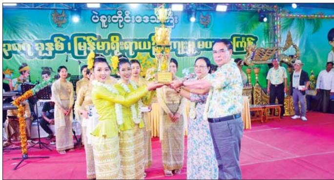
ထို့နောက် ဒုတိယဆုရရှိသော ဇွေဦးမဒီယိမ်း အဖွဲ့နှင့် ပဲခူးတိုင်းဒေသကြီး ရဲတပ်ဖွဲ့ကိုယ်စားပြု ဟင်္သာတနွေ ရဲပျိုမေယိမ်းအဖွဲ့တို့အား ပဲခူးတိုင်း

ပဲခူး ဧပြီ ၁၇ ၁၃၈၇ ခုနှစ် ပဲခူးတိုင်းဒေသကြီး မဟာသင်္ကြန် ပွဲတော် ပိတ်ပွဲနှင့် ဆုချီးမြှင့်ပွဲအခမ်းအနားကို ဧပြီ ၁၆ ရက် ညနေပိုင်းက ပဲခူးတိုင်းဒေသကြီး အစိုးရအဖွဲ့ရုံးရှေ့ရှိ ဗဟိုမဏ္ဍပ်၌ကျင်းပရာ တိုင်းဒေသကြီး ဝန်ကြီးချုပ် ဦးမျိုးဆွေဝင်းနှင့်ဇနီးတို့ တက်ရောက်ချီးမြှင့်ကြသည်။ ဦးစွာ ပြိုင်ပွဲဝင် ယိမ်းအဖွဲ့များအား ဆုချီးမြှင့် ပွဲပြုလုပ်ရာ ပဲခူးတိုင်းဒေသကြီး ဝန်ကြီးချုပ် ဦးမျိုးဆွေဝင်းနှင့်ဇနီးတို့က ပထမဆုရရှိသော ဘုရားကြီးမြို့ကိုယ်စားပြု အတာတန်ခူးမေ သံသာထွဋ်ဇေယိမ်းအဖွဲ့နှင့် အထွေထွေအုပ်ချုပ်ရေး ဦးစီးဌာနကိုယ်စားပြု ယိမ်းအဖွဲ့တို့အား ချီးမြှင့် ငွေကျပ် ၂၅ သိန်းစီနှင့် တံခွန်စိုက်ဆုပေးတို့ကို ပေးအပ်ချီးမြှင့်ကြပြီး ဦးဝင်းအဖွဲ့၊ အနုပညာရှင်များအား ဂုဏ်ပြုငွေနှင့် ဂုဏ်ပြုပန်ခြင်းတို့ပေးအပ်ချီးမြှင့်သည်။