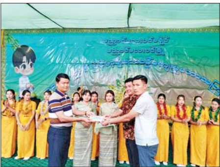
ညောင်လေးပင်မြို့၌ မဟာသင်္ကြန်ပွဲတော် ပိတ်ပွဲကျင်းပ

အဖွဲ့၊ စက်အဖွဲ့၊ လုံခြုံရေးအဖွဲ့များနှင့် သင်္ကြန်ကာလအတွင်း စည်ကား သိုက်မြိုက်အောင် ဆောင်ရွက်ပေးခဲ့ကြသူများအား ဂုဏ်ပြုဆုငွေများ ပေးအပ်ချီးမြှင့်သည်။ ထို့နောက် ယိမ်းအဖွဲ့များနှင့် တီးဝိုင်းအဖွဲ့များက သင်္ကြန်တေးသီချင်းများဖြင့် သီဆိုကပြပျော်မြေခဲ့ကြရာ လာရောက် ကြည့်ရှုသူများက ပျော်ရွှင်စွာ ရေကစားခဲ့ကြပြီး ရေကစားကြသူများအား စတုဒိသာကျွေးမွေးဧည့်ခံခဲ့ကြောင်း သိရသည်။ မြို့နယ်(ပြန်/ဆက်)