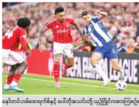
နော်တင်ဟမ်ဖောရက်စ်နှင့် ပေါ်တိုအသင်းတို့ ယှဉ်ပြိုင်ကစားကြစဉ်။

ယူရိုပါလိဂ်ပြိုင်ပွဲ ကွာတားဖိုင်နယ်အဆင့်ပွဲစဉ်တွေကို ဧပြီ ၁၇ ရက် နံနက်ပိုင်းက ယှဉ်ပြိုင်ကစားခဲ့ရာ အက်စ်တွန်ပီလာအသင်းနဲ့ နော်တင်ဟမ်ဖောရက်စ်အသင်းတို့ဟာ ပြိုင်ဘက်အသင်းအသီးသီးကို အနိုင်ရပြီး ဆီမီးဖိုင်နယ်အဆင့်တက်လှမ်းခွင့်ရရှိခဲ့ပါတယ်။ အက်စ်တွန်ပီလာအသင်းဟာ ယူရိုပါလိဂ်ကွာတားဖိုင်နယ် ဒုတိယ အကျော့ပွဲစဉ်မှာ ဘိုလ်တော့ဂ်နာအသင်းကို လေးဂိုးပြတ်ဖြင့် အနိုင်ရရှိခဲ့ တာကြောင့် နှစ်ကျော့ပေါင်းရလဒ် ၃ နှစ်ရိုး-တစ်ဂိုးဖြင့် အနိုင်ရပြီး ဆီမီး ဖိုင်နယ်တက်လှမ်းခွင့်ရရှိခဲ့တာ ဖြစ်ပါတယ်။ စာမျက်နှာ ၃၀ ကော်လံ ၁ သို့ ။