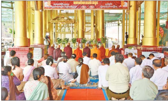
များ ဆောင်ရွက်ခဲ့သည်။ စက်တော်ရာဘုရား ဗုဒ္ဓပူဇော်ယဉ်တော် အောင်မြင်စွာ ကျင်းပနိုင်ခဲ့ခြင်းနှင့် ပါဒစေတီတော်နှစ်ဆူ ခြေတော်ရာပိတ်သိမ်းပွဲ အောင်မြင်ခြင်းအထိမ်း

မင်းဘူး ဧပြီ ၁၇ မကွေးတိုင်းဒေသကြီး မင်းဘူး(စက)မြို့နယ်ရှိ မန်းရွှေစက်တော်ရာဘုရား ဗုဒ္ဓပါဒပူဇော်ယဉ်တော် ပိတ်ပွဲအခမ်းအနားကို ယနေ့နံနက်ပိုင်းက ကျင်းပရာ မကွေးတိုင်းဒေသကြီး ဝန်ကြီးချုပ် ဦးတင်ကိုနှင့် တာဝန်ရှိသူများ တက်ရောက်ကြသည်။ အခမ်းအနားတွင် မန်းရွှေစက်တော်ရာဘုရား ဂေါပကအဖွဲ့၏ ဩဝါဒါစရိယ ဆရာတော်ကြီးများက အောက်စက်တော်ရာနှင့် အထက်စက်တော်ရာ ပါဒစေတီတော်နှစ်ဆူအား ဗုဒ္ဓဘိဝေသက အနေကစာ တင်လှူပူဇော်ခဲ့ပြီးနောက် ဩဝါဒါစရိယ ဆရာတော် ကြီးများနှင့် တာဝန်ရှိသူများက မန်းရွှေစက်တော်ရာ ဘုရား ပါဒစေတီတော်နှစ်ဆူအား နမူဒါရေစင် သွန်းဖျန်း၍ ရွှေသင်္ကန်းများ ကပ်လှူပူဇော်ကာ အောက်ခြေတော်ရာ ပါဒစေတီတော် အလင်းပေါက် ဖန်ဦးချောင်းတော်အား စက်လှေတံတိုက်ပိတ်သိမ်းခြင်းနှင့် အထက်စက်တော်ရာ ပါဒစေတီတော် ခြေတော်ရာသံတံခါးအား သော့ခတ်ပိတ်သိမ်းခြင်း