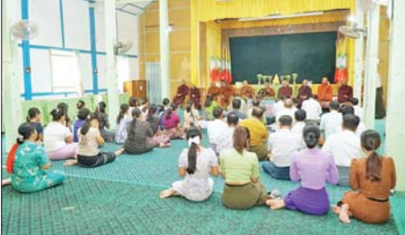
ဘိုးဘွားများအား သွားရောက်ပူဇော်ကန်တော့၍ ကန်တော့ပစ္စည်းများ နှင့် ကန်တော့ဌေးများ လှူဒါန်းပေးအပ်ကြကြောင်း သိရသည်။