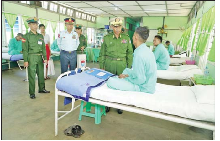
ဆေးရုံအတွင်း လှည့်လည်ကြည့်ရှုစစ်ဆေးကြပြီး ပေးခဲ့ကြောင်း သိရသည်။ လိုအပ်သည်များ ပေါင်းစပ်ညှိနှိုင်းဆောင်ရွက် သတင်းစဉ်

ထိုသို့ဆောင်ရွက်ပေးလျက်ရှိရာ ယနေ့တွင် နယ်မြေခံတပ်မတော်ဆေးရုံ၌ တက်ရောက်ဆေးကုသမှုခံယူလျက်ရှိသော အရာရှိ၊ စစ်သည်၊ မိသားစုဝင်များနှင့် ဒေသခံတိုင်းရင်းသားပြည်သူများအား ကမ်းရိုးတန်းဒေသတိုင်းစစ်ဌာနချုပ်တိုင်းမှူး ဗိုလ်ချုပ် ကျော်ကျော်ဟန်နှင့် တာဝန်ရှိသူများက သွားရောက်ကြည့်ရှု၍ လူနာတစ်ဦးချင်း၏ ရောဂါဖြစ်ပွားမှု၊ ဆေးဝါးကုသပေးထားမှုနှင့် ကျန်းမာရေး တိုးတက်ကောင်းမွန်မှုအခြေအနေများကို ရင်းရင်းနှီးနှီးမေးမြန်းအားပေးစကား ပြောကြားကာ အာဟာရဖြည့်စားသောက်ဖွယ်ရာများ ပေးအပ်သည်။ ထို့နောက် တိုင်းမှူးနှင့် တာဝန်ရှိသူများသည်