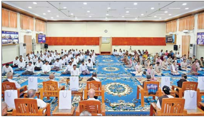
ငါးအကောင်ရေ ၃၀၀၀ ကို မင်္ဂလာကန်တော်အတွင်းသို့ ဇီဝိတဒါနအဖြစ် ကုသိုလ်ပြုလွှတ်ပေးကြသည်။ ထို့နောက် ပြည်ထဲရေးဝန်ကြီးဌာနမိသားစု၏

ဦးစွာ ပြည်ထောင်စုဝန်ကြီးနှင့် ဦးဆောင်ကာ ရွှေဝါငါးကြင်း၊ ငါးမြစ်ချင်းနှင့် ငါးခုံးစုစုပေါင်း