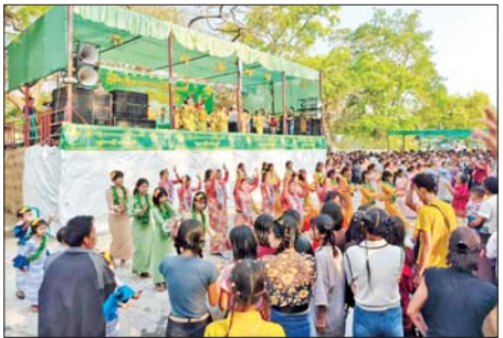
ဆက်လက်၍ လွှတ်တော်ကိုယ်စားလှယ်များ၊ မြို့နယ်စီမံခန့်ခွဲရေးနှင့် အုပ်ချုပ်ရေး