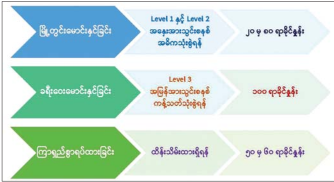
ပုံ ၇။ EV သုံးစွဲမှုနှင့် ဘက်ထရီအားသွင်းမှုပြပုံ။

၂။ (ဃ) ၈၀ ရာခိုင်နှုန်းအထိသာ အားဖြည့်သွင်းခြင်း လူ့စိတ်လူ့သဘောအရ အမြင့်ဆုံး ၁၀၀ ရာခိုင်နှုန်းရှိခြင်း၊ ရာနှုန်းပြည့်ဖြစ်ခြင်းကဲ့သို့ နှစ်သက်ကြပြီး အကောင်းဆုံးဟု သတ်မှတ်လေ့ရှိကြ၏။ သို့သော် EV ကို ၁၀၀ ရာခိုင်နှုန်း အားသွင်းခြင်းသည် အကောင်းဆုံးမဟုတ်ဘဲ ဘက်ထရီကျန်းမာရေးကို ထိခိုက်စေနိုင်ပြီး လီသီယမ်အိုင်ယွန်းဘက်ထရီများ ဖြစ်၍ ဘက်ထရီရာနှုန်းပြည့်ဖြင့် ကြာရှည်ထားလျှင် ပျက်စီးယိုယွင်းစေနိုင်၏။ ခရီးဝေးသွားလျှင် ဘက်ထရီကို ရာနှုန်းပြည့်အားသွင်းသင့်သော်လည်း ဖြိုတွင်းအတွက် ၈၀ ရာခိုင်နှုန်းအထိသာ