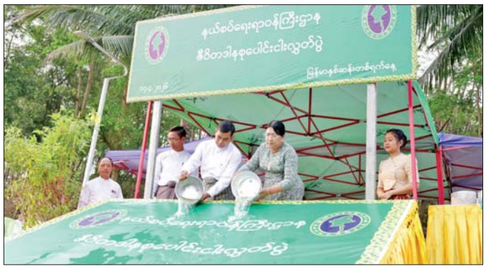
နယ်စပ်ရေးရာဝန်ကြီးဌာန ဇီဝိတဒါနစုပေါင်းငါးလွတ်ပွဲ ပြည်ထောင်စုဝန်ကြီးဌာနမှူး ညွှန်ကြားရေးမှူးချုပ်များနှင့် ဦးစီးဌာနမှူး ဒုတိယအမြဲတမ်းအတွင်းဝန်၊ ဒုတိယညွှန်ကြားရေးမှူးချုပ်များနှင့် ဦးစီးဌာနမှူး လက်ထောက်

အတွင်းဝန်/ညွှန်ကြားရေးမှူးများနှင့် ဦးစီးဌာနမှူး ဝန်ထမ်းမိသားစုများ တက်ရောက်ကြသည်။ ဦးစွာ ပြည်ထောင်စုဝန်ကြီးနှင့် ဦးဆောင်ကာ ဘေးမဲ့ငါးကောင်ရေ ၇၀၀၀ ကို ဇီဝိတဒါနအဖြစ် မင်္ဂလာကန်တော်အတွင်းသို့ ကုသိုလ်ပြုလွှတ်ပေးခဲ့ကြသည်။ ထို့နောက် သက်ကြီးပူဇော်ပွဲအခမ်းအနားကို နယ်စပ်ရေးရာဝန်ကြီးဌာန ဧရာဝတီခရိုင်နှင့် ဆက်လက်ကျင်းပရာ နယ်စပ်ရေးရာဝန်ကြီးဌာန ဝန်ထမ်း