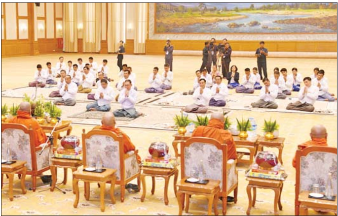
ခန်းမအတွင်းရှိ ဗုဒ္ဓရုပ်ပွားတော်မြတ်အား မြသပိတ် ဆွမ်းတော်၊ သောက်တော်ရေချမ်းနှင့် သစ်သီးပန်းမန်များ ကပ်လှူပူဇော်သည်။ ထို့နောက် ဥပ္ပုတသန္တိစေတီတော်ဂေါပကအဖွဲ့