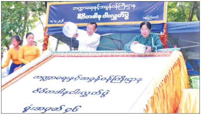
သည့် မြန်မာ့ယဉ်ကျေးမှု အစဉ် လေအောင် ဆက်လက်ထိန်းသိမ်း ချက်များဖြင့် ကျင်းပခြင်းဖြစ် အလာကောင်းကို မပျောက်ပျက်ရ စောင့်ရှောက်ရန် စသည့် ရည်ရွယ် ကြောင်း သိရသည်။ သတင်းစဉ်

ဘေးမဲ့လွတ် ဦးစွာ ပြည်ထောင်စုဝန်ကြီးက နှစ်သစ်နှစ်ခွန်းဆက်အမှာစကား