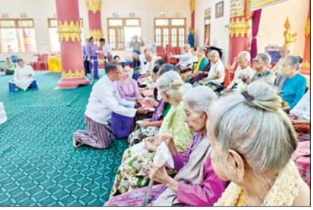
ကော်မတီဥက္ကဋ္ဌ ဦးစောမိုးထိုက် နှင့်ဇနီး၊ လွှတ်တော်ကိုယ်စားလှယ် များ၊ ဌာနဆိုင်ရာတာဝန်ရှိသူများက ရွှေဝါငါးကြင်းသားပေါက်ကောင် ယင်းနောက် တောင်ဥက္ကလာပ အတွင်းသို့ ဖိစိတဒါန ဘေးမဲ့ လွှတ်ပေးခဲ့ကြသည်။

ရန်ကုန် ဧပြီ ၁၇ ရန်ကုန်တိုင်း ဒေသကြီး သင်္ဃန်းကျွန်းခရိုင်တွင် ခရိုင်စီမံ ခန့်ခွဲရေးနှင့် အုပ်ချုပ်ရေး ကော်မတီ၏ စီမံကြီးကြပ်မှုဖြင့် ဖိစိတဒါန စုပေါင်းငါးလွှတ်ပွဲနှင့် သက်ကြီးဘိုးဘွားများ ပူဇော် ကန်တော့ပွဲတို့ကို နှစ်ဆန်း တစ်ရက်နေ့နံနက်ပိုင်းက ကျင်းပ သည်။ ဦးစွာ နံနက် ၇ နာရီက တောင်ဥက္ကလာပမြို့နယ်ရှိ မေတ္တာ ရေကန်၌ ဖိစိတဒါန စုပေါင်း ငါးလွှတ်ပွဲကျင်းပရာ ခရိုင်စီမံ ခန့်ခွဲရေးနှင့် အုပ်ချုပ်ရေး