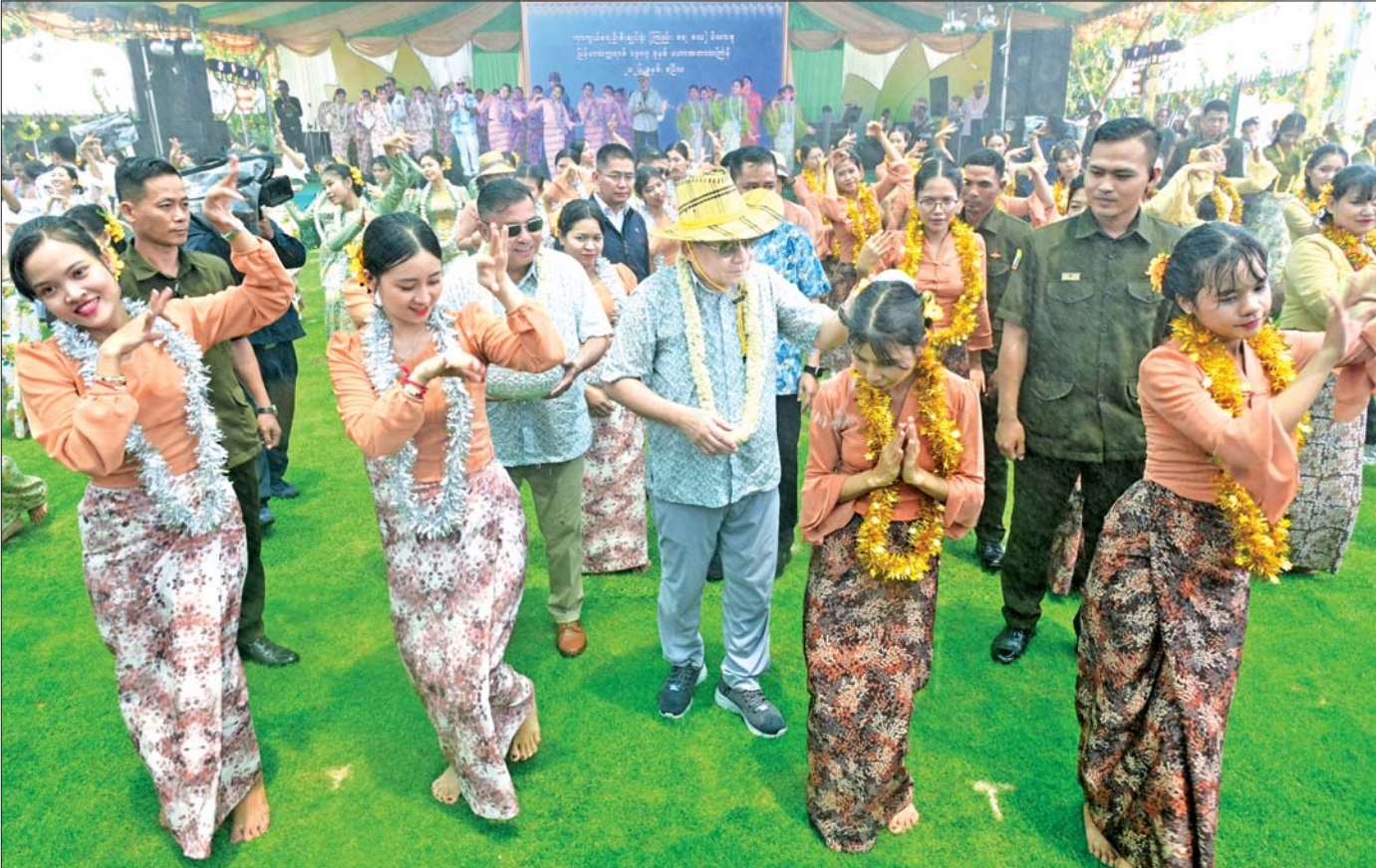
ပြည်ထောင်စုသမ္မတမြန်မာနိုင်ငံတော် နိုင်ငံတော်သမ္မတ ဦးမင်းအောင်လှိုင် ၁၃၅၇ ခုနှစ် ကာကွယ်ရေးဦးစီးချုပ်ရုံး(ကြည်း၊ ရေ၊ လေ)မိသားစု ရေကစားမဏ္ဍပ်၌ ယမ်းအကအဖွဲ့များအား မြန်မာ့ရိုးရာအစဉ် အလာနှင့်အညီ အတာသကြိန်ရေ ပက်ဖျန်းပေးစဉ်။

ကုသိုလ်ကောင်းမှု နေ့စဉ်ပြု လိမ္မာသော ပန်းသည်သည် အထူးထူးအပြားပြား များစွာသော ပန်းပွင့်အပေါင်းမှ ပန်းကုံးများစွာတို့ကို ပြုရာသကဲ့သို့၊ (လိမ္မာသော) သူသည် ဥစ္စာတည်း ဟူသော ပန်း၊ သဒ္ဓါတရားတည်းဟူသော ပန်းအစုမှ ကျောင်း၊ သင်္ကန်း၊ ဆွမ်း၊ ဆေးစသော များစွာသော ကုသိုလ်ကောင်းမှုတည်းဟူသော ပန်းကုံးတို့ကို ပြုရာ၏။ ပုပ္ဖဝဂ်(ဓမ္မပဒ-၅၃)