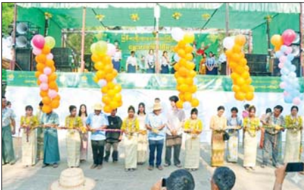
မြို့နယ်(ပြန်/ဆက်)

စစ်ကိုင်းတိုင်းဒေသကြီး မုံရွာခရိုင် ချောင်းဦးမြို့သင်္ကြန်မဏ္ဍပ်၌ ဧပြီ ၁၄ ရက် မဟာသင်္ကြန်အကျနေ့တွင် မြို့ပေါ်ရှိပြည်သူများနှင့် ကျေးရွာမှ ပြည်သူများ ဖျော်ရွှင်စွာ ပါဝင်ဆင်နွှဲခဲ့ကြပြီး စည်ကားသိုက်မြိုက်စွာ ကျင်းပစဉ်။