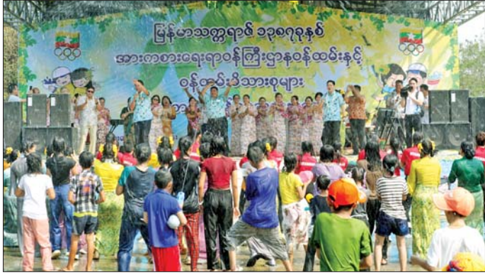
အောင်လူများဖြင့် ဝန်ထမ်းများကို အားပေးကြသည်။ ယင်းနောက် အတာရေ များဖြင့် သီဆိုကပြ ဖျော်ဖြေခြင်း၊ အပြန်အလှန် ပတ်ဖျန်းခြင်း၊ ဌာနခွဲ များမှ ဝန်ထမ်းယိမ်းအဖွဲ့များနှင့် Fitness Dance အဖွဲ့၏ တေးသီချင်း ပေးအပ်ချီးမြှင့်ခဲ့ကြောင်း သိရသည်။

နေပြည်တော် ဧပြီ ၁၄ - မြန်မာ့ရိုးရာယဉ်ကျေးမှု မဟာသင်္ကြန်ပွဲတော်ကို ယမန်နေ့ နံနက်ပိုင်းက နေပြည်တော် အားကစား လေ့ကျင့်ရေးစခန်း (Gold Camp)၌ ကျင်းပရာ အားကစားရေးရာ ဝန်ကြီးဌာန ပြည်ထောင်စုဝန်ကြီး ဦးမြင့်ထွန်း နှင့် ဦးစိုး၊ လူငယ်ရေးရာဝန်ကြီးဌာန ပြည်ထောင်စုဝန်ကြီး ဒေါက်တာ မောင်သင်း၊ ဒုတိယဝန်ကြီး ဦးစစ်ခိုင်နှင့် ဦးအိမ်တင် အတွင်းဝန်နှင့် ဦးကျော်စွာ၊ ဦးစွာအဖွဲ့ဝင်များနှင့် အဖွဲ့ဝင်များ၊ ဝန်ထမ်းများနှင့် ဝန်ထမ်းမိသားစု ဝင်များ ပျော်ရွှင်စွာ ပါဝင်ဆင်နွှဲကြသည်။ ဦးစွာပြည်ထောင်စုဝန်ကြီးများ၊ ဒုတိယဝန်ကြီးနှင့် အဖွဲ့ဝင်များ၊ အားကစားရေးရာ ဝန်ကြီးဌာန မဟာသင်္ကြန်ပွဲတော် အခမ်းအနားကို ဖဲကြိုးဖြတ်ဖွင့်လှစ်ပေးပြီး ပြိုင်ပွဲအစကို စတင်ပေးအပ်ခဲ့ပြီး ဦးစိုး၊ လူငယ်ရေးရာဝန်ကြီးဌာန ပြည်ထောင်စုဝန်ကြီး ဒေါက်တာ မောင်သင်း၊ ဒုတိယဝန်ကြီး ဦးစစ်ခိုင်နှင့် ဦးအိမ်တင် အတွင်းဝန်နှင့် ဦးကျော်စွာ၊ ဦးစွာအဖွဲ့ဝင်များနှင့် အဖွဲ့ဝင်များ၊ ဝန်ထမ်းများနှင့် ဝန်ထမ်းမိသားစု ဝင်များ ပျော်ရွှင်စွာ ပါဝင်ဆင်နွှဲကြသည်။