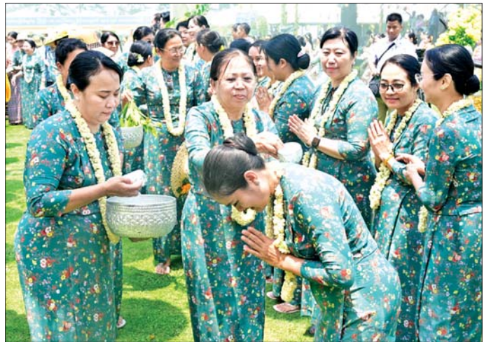
ပြည်ထောင်စုသမ္မတမြန်မာနိုင်ငံတော် နိုင်ငံတော်သမ္မတ ဦးမင်းအောင်လှိုင်နှင့်ဇနီး ဒေါ်ကြူကြူလှ ၁၃၈၇ ခုနှစ် ကာကွယ်ရေးဦးစီးချုပ်ရုံး(ကြည်း)ရေလေ) မိသားစုရေကစားမဏ္ဍပ်၌ အခမ်းအနား တက်ရောက် လာကြသူများအား မြန်မာ့ရိုးရာအစဉ်အလာနှင့်အညီ အတာသင်္ကြန်ရေပက်ဖျန်းပေးစဉ်။