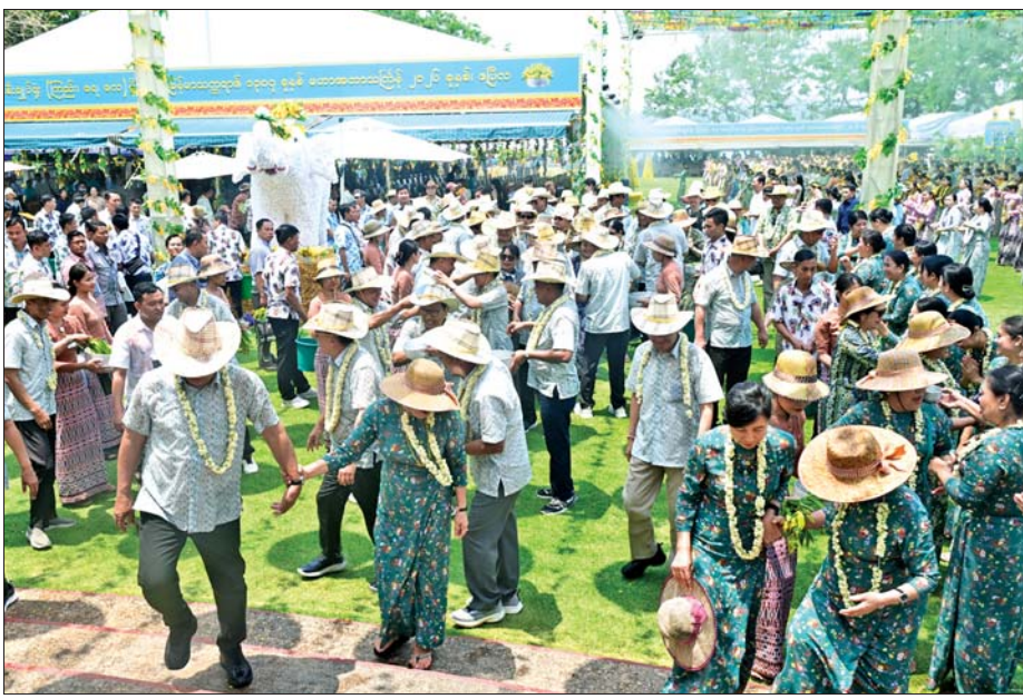
၁၃၈၇ ခုနှစ် ကာကွယ်ရေးဦးစီးချုပ်ရုံး(ကြည်း)ရေလေ)မိသားစု ရေကစားမဏ္ဍပ်၌ အတာသေဘင်ပွဲဆင်နွှဲကြသူများကို တွေ့ရစဉ်။

အဆိုပါ ကာကွယ်ရေးဦးစီးချုပ် ရုံး(ကြည်း)ရေလေ) မိသားစုများ ၏ မဟာသင်္ကြန်ပွဲတော်ရေကစား မဏ္ဍပ်သို့ နိုင်ငံတော်သမ္မတနှင့်ဇနီး နှင့် မိသားစုဝင်များ၊ ဒုတိယသမ္မတ ဦးညီစောနှင့်ဇနီး ဒေါ်စမ်းစမ်းအေး၊ ဒုတိယသမ္မတ ဒေါ်နန်းနီနီအေး၊ ပြည်ထောင်စုအဆင့် ပုဂ္ဂိုလ်များ နှင့် ဇနီးများ၊ တပ်မတော်ကာကွယ် ရေးဦးစီးချုပ်နှင့်ဇနီး၊ ဒုတိယ တပ်မတော်ကာကွယ်ရေးဦးစီးချုပ် ကာကွယ်ရေးဦးစီးချုပ် (ကြည်း) နှင့်ဇနီး၊ ပြည်ထောင်စုဝန်ကြီး များနှင့် ဇနီးများ၊ နေပြည်တော် ကောင်စီဥက္ကဋ္ဌ ကာကွယ်ရေးဦးစီး ချုပ်ရုံးမှ အဆင့်မြင့်တပ်မတော် အရာရှိကြီးများနှင့် ဇနီးများ၊ အရာရှိ၊ စစ်သည်၊ မိသားစုများ၊ အနုပညာရှင်များ၊ ယိမ်းအဖွဲ့များ နှင့်ဖိတ်ကြားထားသူများ စည်ကား သိုက်မြိုက်စွာ တက်ရောက်ကြ သည်။