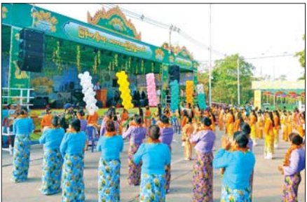
မြို့နယ်(ပြန်/ဆက်)

ရန်ကုန်တိုင်းဒေသကြီး ဒလမြို့နယ်တွင် ၁၃၈၇ ခုနှစ် မြန်မာ့ရိုးရာယဉ်ကျေးမှု မဟာသင်္ကြန်ပွဲတော် (မဟာသင်္ကြန်အကြိုနေ့) ဗဟိုရေကစားမဏ္ဍပ် ဖွင့်ပွဲအခမ်းအနားကို ဧပြီ ၁၃ ရက် နံနက်ပိုင်းက မြို့နယ်အထွေထွေအုပ်ချုပ်ရေးဦးစီးဌာနရုံးရှေ့ ဗဟိုရေကစားမဏ္ဍပ်၌ ကျင်းပစဉ်။