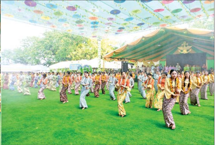
ပြည်ထောင်စုသမ္မတမြန်မာနိုင်ငံတော် နိုင်ငံတော်သမ္မတ ဦးမင်းအောင်လှိုင်နှင့်ဇနီး ဒေါ်ကြူကြူလှ၊ အခမ်းအနားတက်ရောက်လာကြသူများ ၁၃၈၇ ခုနှစ် ကာကွယ်ရေးဦးစီးချုပ်ရုံး(ကြည်း)ရေလေ)မိသားစု ရေကစားမဏ္ဍပ်၌ မြဝတီတေးဂီတအဖွဲ့နှင့်အတူ နိုင်ငံကျော်အနုပညာရှင်များ၊ ယိမ်းအဖွဲ့များက တေးသီချင်းများ၊ ယိမ်းအကအလှများဖြင့် သီဆိုကပြဖျော်ဖြေမှုများကို ကြည့်ရှုအားပေးကြစဉ်။