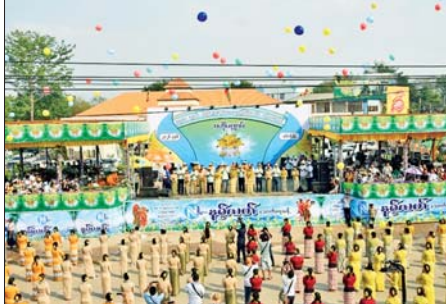
ဥက္ကဋ္ဌ ဦးမဟာဌာနှင့် မြို့မိမြို့မှ ဦးစိုးလတ်တို့က လမ်းလျှောက် သင်္ကြန်ကို ဖွင့်ပွဲအခမ်းအနား ပေးပြီး လမ်းလျှောက်သင်္ကြန် အတွင်း ပြည်သူများရေကစားနေမှု နှင့် ကော်ဖီသင်္ကြန်၊ လက်ဖက်

နေပြည်တော် ဧပြီ ၁၄ ရှမ်းပြည်နယ် (တောင်ပိုင်း) နမ့်ခင်မြို့နယ်တွင် ၂၀၂၆ ခုနှစ် မြန်မာ့ရိုးရာယဉ်ကျေးမှု နှစ်သစ် ကူး မဟာသကြိမ်ပွဲတော် ဖွင့်ပွဲ အခမ်းအနားကို သင်္ကြန်အကြိုနေ့ ယမန်နေ့ညနေ ၃နာရီက အမှတ်(၂) ရပ်ကွက် မြို့နယ်ခန်းမရှေ့ရှိ မဟာ သင်္ကြန်ဗဟိုမဏ္ဍပ်၌ စည်ကား သိုက်မြိုက်စွာ ကျင်းပသည်။ ဦးစွာ အရှေ့အလယ်ပိုင်း တိုင်းစစ်ဌာနချုပ် ဒုတိယ တိုင်းမှူး၊ တပ်နယ်မှတာဝန်ရှိသူများ ခရိုင်စီမံခန့်ခွဲရေးနှင့် အုပ်ချုပ်ရေး ကော်မတီဥက္ကဋ္ဌ ဦးသက်နိုင်၊ ပြည်သူ့လွှတ်တော်ကိုယ်စားလှယ် ဦးဌေးလွင်၊ ဟိုမင်းဌာနေပြည်သူစစ်