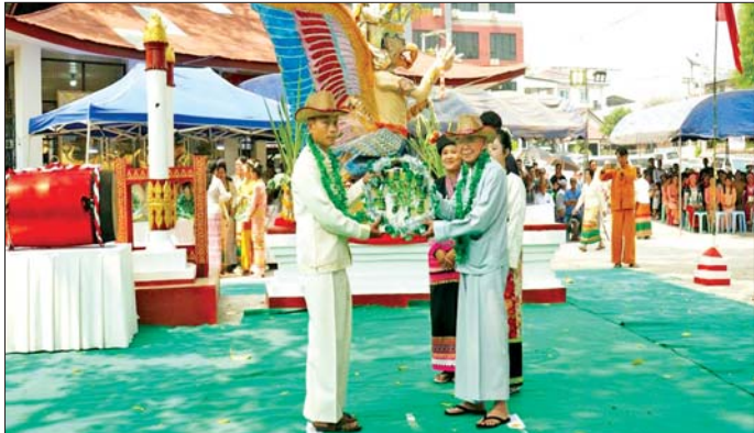
ထို့နောက် တိုင်းမှူးနှင့် တာဝန်ရှိသူများက ဒေသခံ တိုင်းရင်းသားများနှင့်အတူ စည်တော်ကို မဟာခန့် ပန်းခြံမှ ကျိုင်းတုံမြို့ နမ့်ခင်ရေချောင်းသို့ ပို့ဆောင် ကြသည်။ ယခုပွဲတော်ကို ကျိုင်းတုံမြို့နယ် တံဂပူရီ (သို့မဟုတ်)ခေမာရဋ္ဌဒေသရှိ ရှမ်းမျိုးနွယ်စုတို့၏ တိုးစဉ်ဘောင်ဆက် ရေလှေထိုးစံအရ ဘေးအန္တရာယ် ဟုသိရှိ ကင်းစင်ပျောက်မေခြင်း၊ ပြည်သူ့ ပြည်သူ့များ ကြံ့ခိုင်ကျန်းမာမေခြင်းနှင့် မိုးရွာသွန်းမှု ပိုမိုမရှိရမေပြီး ဆန်ရေစပါးပေါက်ကြွယ်ဝမေခြင်းတို့အတွက် ရည်ရွယ်ကျင်းပလာခဲ့ခြင်း ဖြစ်ကြောင်း သိရသည်။ သတင်းစဉ်

စင်ပေါ်သို့ တင်ဆောင်ရာတွင် တံဂပူရီ(သို့မဟုတ်) ခေမာရဋ္ဌဒေသရှိ ရှမ်းမျိုးနွယ်စုယဉ်ကျေးမှုအဖွဲ့ဝင် များက “နှစ်သစ်မင်္ဂလာ” တေးသီချင်းဖြင့် သီဆို၍ ဖွင့်လှစ်ကြသည်။ ထို့နောက် တိုင်းမှူးနှင့် တာဝန်ရှိသူ များက အလှူငွေများပေးအပ်ရာ တာဝန်ရှိသူတာဝန်ရှိသူ လက်ခံရယူပြီး အမှတ်တရလက်ဆောင်များပြန်လည် ဂရုပြုပေးအပ်သည်။ ယင်းနောက် တာဝန်ရှိသူများ က စည်တော်နှင့်စပ်လျဉ်း၍ ရိုးရာမလေ့ အမေးအဖြေ များပြုလုပ်ကြပြီး စည်တော်ကို စင်ပေါ်သို့ တင်မြှောက် ကြသည်။ ဆက်လက်၍ တိုင်းမှူးနှင့် တာဝန်ရှိသူများ က စည်တော်အား(၇)ချက်စီ တီး၍ ဆုမွန်ကောင်း တောင်းခြင်း၊ အမွှေးနံ့သာရည်များ ပက်ဖျန်းပေးခြင်း၊ ဆောင်ရွက်ပြီး ရိုးရာယဉ်ကျေးမှုအကအလှအပွဲဖြင့် ကပြပျော်ဖြေမှုကို ကြည့်ရှုအားပေးကြသည်။