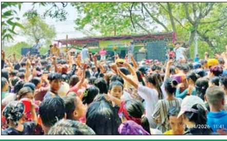
မြို့နယ်(ပြန်/ဆက်)

စစ်ကိုင်းတိုင်းဒေသကြီး မုံရွာခရိုင် ချောင်းဦးမြို့သင်္ကြန်မဏ္ဍပ်၌ ဧပြီ ၁၄ ရက် မဟာသင်္ကြန်အကျနေ့တွင် မြို့ပေါ်ရှိပြည်သူများနှင့် ကျေးရွာမှ ပြည်သူများ ဖျော်ရွှင်စွာ ပါဝင်ဆင်နွှဲခဲ့ကြပြီး စည်ကားသိုက်မြိုက်စွာ ကျင်းပစဉ်။