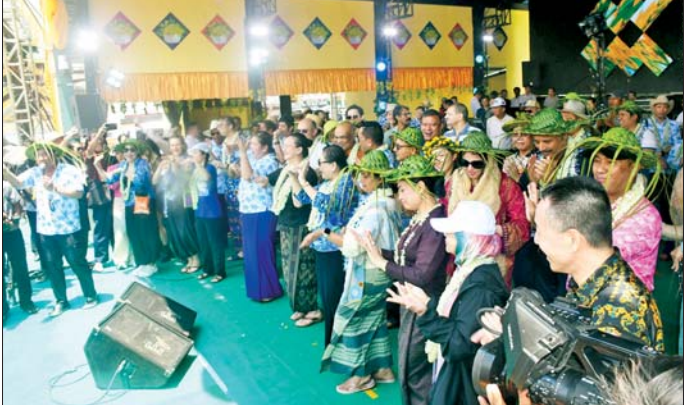
ဒုတိယဝန်ကြီး၊ သံတမန်များနှင့် စည်းသည့်တော်များ သည် Royal Apex မဏ္ဍပ်၌ နိုင်ငံခြားရေးဝန်ကြီးဌာန (ရန်ကုန်) ယိမ်းအဖွဲ့၏ ကပြဖျော်ဖြေတင်ဆက်မှုကို ကြည့်ရှုအားပေးပြီး တိုင်းဒေသကြီးဝန်ကြီးချုပ်က ယိမ်းအဖွဲ့အား ဂုဏ်ပြုချီးမြှင့်ငွေများ ပေးအပ်ကာ တေးသီချင်းစိုင်းညီညီနှင့်အဖွဲ့၏ တေးသီချင်းများဖြင့် ဖျော်ဖြေမှု၊ မြန်မာနိုင်ငံရုပ်ရှင်အစည်းအရုံးမှ မေများ အဖွဲ့က ယိမ်းအကဖြင့်ဖျော်ဖြေမှုတို့ကို ကြည့်ရှု အားပေးကြသည်။ ဆက်လက်၍ မြန်မာနိုင်ငံဆိုင်ရာ နီပေါနိုင်ငံ သံအမတ်ကြီး H.E.Mr. Harishchandra Ghimire က နှစ်သစ်ကူး ဆုတောင်းစကားပြောကြားသည်။ ထို့နောက် တိုင်းဒေသကြီးဝန်ကြီးချုပ်နှင့် ဦးစိုး၊ ဒုတိယဝန်ကြီးနှင့် ဦးအိမ်တင်သည် သံတမန်များ နှင့် စည်းသည့်တော်များသည် မနန်းတောင်ရိပ်ခို တေးသီချင်းကို နိုင်ငံကျော်တေးသီချင်းများနှင့်အတူ စုပေါင်းသီဆိုကြသည်။ ယင်းနောက် ဒုတိယဝန်ကြီးဦးစိုး၊ ဦးအောင် သည် သံတမန်များနှင့် စည်းသည့်တော်များသည် ရန်ကုန်မြို့တော် မဟာသင်္ကြန်မဏ္ဍပ်သို့ ရောက်ရှိကြ ပြီး မဟာဗန္ဓုလပန်းခြံလမ်းရှိ လမ်းလျှောက်သင်္ကြန် ပွဲတော်တွင် သင်္ကြန်ချစ်သူပြည်သူများနှင့်အတူ

ရန်ကုန် ဧပြီ ၁၄ - မဟာသင်္ကြန်အကျနေ့တွင် ရန်ကုန်မြို့အခြေစိုက် သံတမန်များနှင့် မိသားစုဝင်များ၊ ကုလသမဂ္ဂနှင့် လက်အောက်ခံအဖွဲ့အစည်းများမှ ကိုယ်စားလှယ်များ၊ ဂုဏ်ထူးဆောင်ကောင်စစ်ဝန်များနှင့် မိသားစုဝင်များ သည် ယနေ့နံနက်ပိုင်းတွင် ရန်ကုန်မြို့၊ ပြည်သူ့ရင်ပြင် လမ်းလျှောက်သင်္ကြန်ပွဲတော်၊ ရန်ကုန်မြို့တော် မဟာသင်္ကြန်မဏ္ဍပ်နှင့် မဟာဗန္ဓုလပန်းခြံလမ်းရှိ လမ်းလျှောက်သင်္ကြန်ပွဲတော်တို့ကို သင်္ကြန်ချစ်သူ ပြည်သူများနှင့်အတူ ပျော်ရွှင်စွာဆင်နွှဲကြသည်။ ဦးစွာ နိုင်ငံခြားရေးဝန်ကြီးဌာန ဒုတိယဝန်ကြီး ဦးကျော်စွာနှင့် ဦးအိမ်တင်သည် သံတမန်များ နှင့် စည်းသည့်တော်များသည် ပြည်သူ့ရင်ပြင် လမ်းလျှောက်သင်္ကြန်ပွဲတော်သို့ ရောက်ရှိရာ ရန်ကုန် တိုင်းဒေသကြီးဝန်ကြီးချုပ် ဦးအောင်နိုင်သူနှင့် ဦးစိုး၊ ရန်ကုန်တိုင်းဒေသကြီးလွှတ်တော်ဥက္ကဋ္ဌ ဦးအောင်၊ ရန်ကုန်တိုင်းဒေသကြီး စည်ပင်သာယာရေးဝန်ကြီး၊ ရန်ကုန်မြို့တော်ဝန် ဦးမျိုးမြင့်အောင်နှင့် ဦးစိုး နှင့် တာဝန်ရှိသူများက ကြိုဆိုကြသည်။ ထို့နောက် တိုင်းဒေသကြီးဝန်ကြီးချုပ် ဦးစိုး၊ ဒုတိယဝန်ကြီးဦးစိုး၊ သံတမန်များနှင့် စည်းသည့်တော် များသည် ပြည်သူ့ရင်ပြင် လမ်းလျှောက်သင်္ကြန်ပွဲတော် ၌ သင်္ကြန်ချစ်သူ ပြည်သူများနှင့်အတူ ပျော်ရွှင်စွာ ရေကစားကြပြီး မြန်မာ့ရိုးရာသင်္ကြန်ပွဲများကို အပြန် အလှန် လိမ်းခြယ်ပေးကြသည်။ ယင်းနောက် တိုင်းဒေသကြီးဝန်ကြီးချုပ်၊