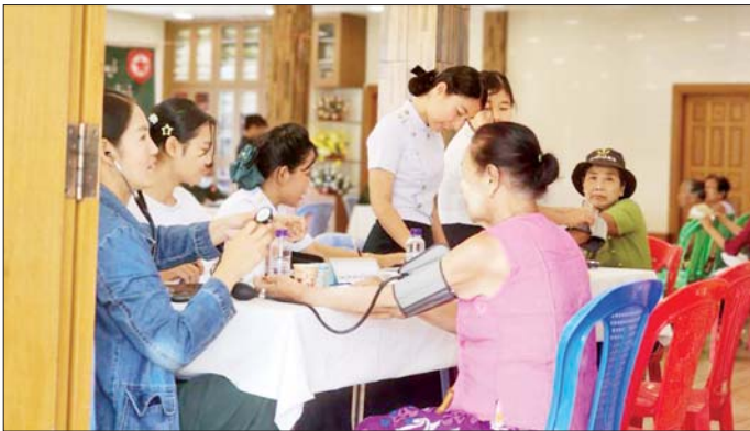
လိုအပ်သည့် ကျန်းမာရေးစစ်ဆေးကုသပေးခြင်းများ ဆောင်ရွက်ပေးသည်။ အလားတူမန္တလေးတိုင်းဒေသကြီးမဟာအောင်မြေ မြို့နယ် မဟာနွယ်စည်ရပ်ကွက် စီးတော်မြင်းဝန် ကျောင်းတိုက်ရှိ သံဃာတော်များနှင့် ဒေသခံပြည်သူ များအား ယနေ့နံနက်ပိုင်းတွင် အလယ်ပိုင်းတိုင်းစစ် ဌာနချုပ် နယ်လှည့်ဆေးကုသရေးအဖွဲ့က အဆိုပါ ကျောင်းတိုက်ရှိ ဓမ္မရုံ၌ ကျန်းမာရေးစောင့်ရှောက်မှု

တပ်မတော်အနေဖြင့်ပြည်သူ့လူထု၏ကျန်းမာရေး ကဏ္ဍ တိုးတက်မြှင့်တင်ပေးစေရန်အတွက် ကျန်းမာရေး စောင့်ရှောက်မှုလုပ်ငန်းများတွင် တစ်ဖက်တစ်လမ်းမှ ကူညီစောင့်ရှောက်မှုများ ဆောင်ရွက်ပေးလျက်ရှိရာ ယနေ့နံနက်ပိုင်းတွင် ရန်ကုန်တိုင်းစစ်ဌာနချုပ် နယ်လှည့်ဆေးကုသရေးအဖွဲ့က ရန်ကုန်တိုင်းဒေသကြီး မှော်ဘီမြို့နယ် လှည်းငှက်ချောင်းကျေးရွာနှင့် ပတ်ဝန်းကျင်ကျေးရွာများမှ သံဃာတော်များနှင့် ဒေသခံပြည်သူများအား အဆိုပါကျေးရွာရှိ ရှမ်းစု ကျောင်းတိုက်၌ အခြေပြု၍ ကျန်းမာရေးစောင့်ရှောက် မှုလုပ်ငန်းများ ဆောင်ရွက်ပေးသည်။