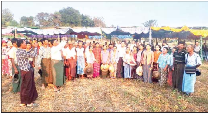
သီတာချောင်းကူးတံတားတည်ဆောက်မည့်နေရာတွင် တွေ့ဆုံခွင့်ရခဲ့သော ဖက်စလက်၊ ကွင်းကလေးကျေးရွာမှ ရွာသူရွာသားများ။

၁၉၉၄ ခုနှစ် အောက်တိုဘာလ ၂၈ ရက်နေ့ထုတ် ကြေးမုံသတင်းစာတွင် ဖော်ပြခဲ့သော ဆောင်းပါး တစ်ပုဒ်ဖြင့် စာပေနယ်သို့ ကျွန်တော် စတင် ဝင်ရောက်ခဲ့သည်။ ထိုစဉ်ကရေးခဲ့သော ဆောင်းပါး ၏အမည်မှာ “လက်ကမ်း၍ ကြိုပါမည်” ဟူ၍ဖြစ်၏။ မည်သူတို့ကို လက်ကမ်း၍ ကြိုပါသနည်း၊ မည်သည့်အဖွဲ့အစည်းကို စောစောစာရည်သန်၍ ရေးခဲ့ပါသနည်း ဆိုရပါမူ ဦးခွန်ဆာ ခေါင်းဆောင် သည့် MTA ခေါ် လွယ်မော်လက်နက်ကိုင်အဖွဲ့အား ဖိတ်ခေါ်ရေးသားခဲ့ခြင်းဖြစ်ပါသည်။ တပ်မတော် သားဘဝဖြင့် တာဝန်ထမ်းဆောင်ခဲ့စဉ်က ဦးခွန်ဆာ ၏ မွေးရပ်ဇာတိဖြစ်သော ရှမ်းပြည်နယ် (မြောက် ပိုင်း) တန့်ယန်းမြို့နယ်အတွင်းရှိ နောင်လိုင် ကျေးရွာ၌ စခန်းထိုင်ခဲ့ဖူးသည်။