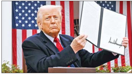
ဝါရှင်တန် ဖေဖော်ဝါရီ ၂၁

အမေရိကန်သမ္မတ ဒေါ်နယ်ထရမ်၏ ကမ္ဘာလုံးဆိုင်ရာ စည်းကြပ်ခွန်ကောက်ခံမှု ဥပဒေတစ်ရပ်ကို အမေရိကန် တရားရုံးချုပ်က ယမန်နေ့တွင် ပယ်ချခဲ့သည်။ တရားရုံးချုပ်၏ စီရင်ချက်ချမှတ်သည့် အလွန်စိတ်ပျက်စရာကောင်းကြောင်း သမ္မတ ထရမ်က ပြောကြားခဲ့သည်။