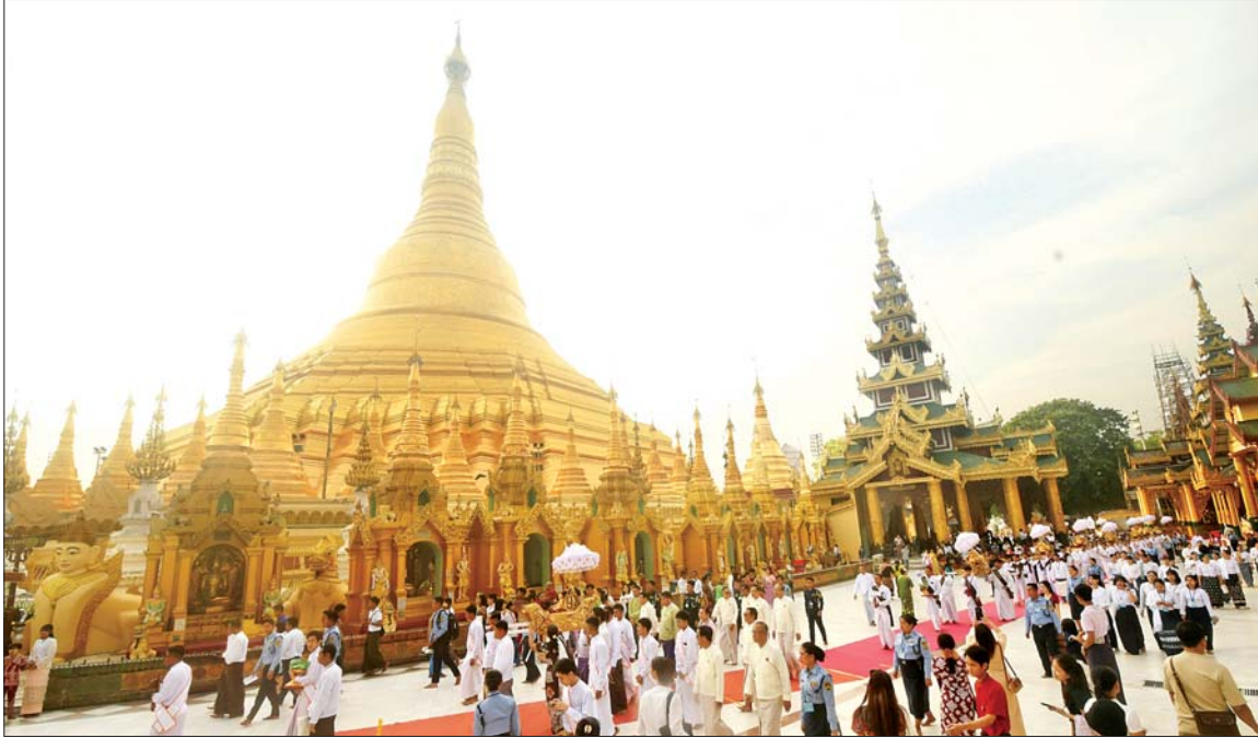
ရွှေတိဂုံစေတီတော် (၂၆၁၄) နှစ်မြောက် ဗုဒ္ဓပူဇော်ယုတ်ပေါင်းပွဲတော် ဖွင့်ပွဲနှင့် နှစ်ကျိပ်ရှစ်ဆူဘုရား လှည့်လည်ပူဇော်ပွဲ ကျင်းပစဉ်။

ယနေ့ ဗဟိုစရာ နဝမအကြိမ် နိုင်ငံတော်ပဟို သံယာဇ်ဆောင်အဖွဲ့ ဒုတိယ အစည်းအဝေး ကျင်းပပြီးစီး စာမျက်နှာ » ၃ နိုင်ငံနှင့်လူမျိုး ဒေသအကျိုး အတွက် အသိတရားများ နိုးကြားစေလို ... ဆောင်းပါး စာမျက်နှာ » ၆ မြစ်ကြီးနားလေဆိပ်မှ ခရီးသည်တင်လေယာဉ်အား KIA အဖွဲ့နှင့် PDFအမည်ခံ အကြမ်းဖက်သောင်းကျန်း သူ ပူးပေါင်းအဖွဲ့များက ယုတ်မာပက်စက်စွာ FPV Suicide Drone များဖြင့် ပစ်ခတ်တိုက်ခိုက်ခဲ့မှု အပေါ် အဖွဲ့အစည်းအသီးသီး မှ ပြင်းထန်စွာ ကန့်ကွက် ရှုတ်ချကြောင်း သဘောထား များ ထုတ်ပြန် စာမျက်နှာ » ၈