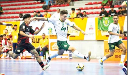
YRG အသင်းနှင့် VUC အသင်းတို့ ယှဉ်ပြိုင်နေစဉ်။