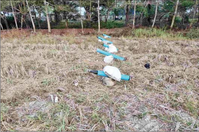
ရန်ကုန်တိုင်းဒေသကြီး လှည်းကူးမြို့နယ် ဆင်ဖုန်(မြောက်) ကျေးရွာအနီး လယ်ကွင်း၌ ပစ်ခတ်ရန် ပြင်ဆင်ထားသည့် ရှေ့တိုက်ခိုးများအား တွေ့ရစဉ်။