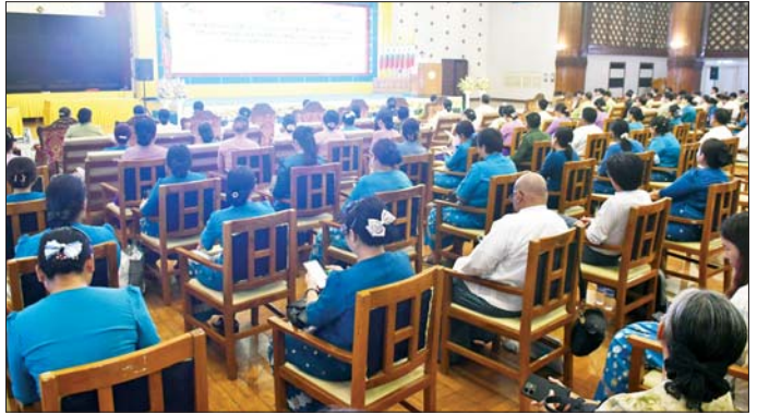
နိုင်ရေး လုပ်ငန်းအခြေအနေကို ရှင်းလင်းတင်ပြကာ ကာကွယ်ဆေးထိုးနှံ/တိုက်ကျွေးခြင်းလုပ်ငန်းများ ဆောင်ရွက်ခဲ့သည့် မှတ်တမ်း Video အား ပြသခဲ့ ကြောင်း သိရသည်။ ဇွဲထက်ကို(ပြန်/ဆက်)

ဒေသကြီး ပြည်သူ့ကျန်းမာရေးနှင့် ကုသရေးဦးစီး ဌာနမှ တာဝန်ရှိသူများ၊ တိုင်းဒေသကြီး/ခရိုင် အထွေထွေအုပ်ချုပ်ရေးဦးစီးဌာနမှ အုပ်ချုပ်ရေးမှူး များ၊ ဆေးရုံအခြေပြုကာကွယ်ဆေးထိုးလုပ်ငန်း ဆောင်ရွက်နေကြသည့် ဆေးရုံများမှ ဆေးရုံအုပ်ကြီး များ၊ ဖိတ်ကြားထားသည့် ဧည့်သည်တော်များနှင့် တာဝန်ရှိသူများ တက်ရောက်ကြသည်။ အသိပညာပေးဆွေးနွေးပွဲတွင် တိုင်းဒေသကြီး ဝန်ကြီးချုပ်က အမှာစကားပြောကြားပြီး တိုင်းဒေသ ကြီး ပြည်သူ့ကျန်းမာရေးနှင့် ကုသရေးဦးစီးဌာန၊ ညွှန်ကြားရေးမှူးက ကာကွယ်ဆေးထိုးနှံ တိုက်ကျွေး ရေးလုပ်ငန်းများ ပိုမိုအရှိန်အဟုန်မြှင့် ဆောင်ရွက်