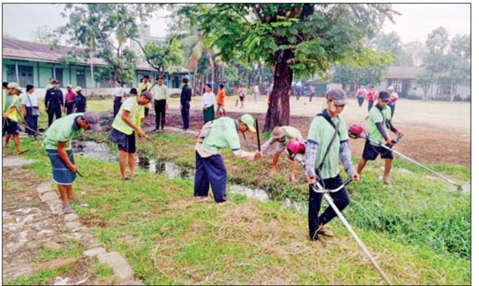
ခြင်း၊ မြင်ခိုအောင်းနိုင်သည့်နေရာ များအား ခြင်ဆေးဖျန်းခြင်းများကို စုပေါင်းဆောင်ရွက်ကြသည်။ ယင်းသို့ ဆောင်ရွက်နေမှုများ ပြီး လိုအပ်သည်များ ညှိနှိုင်း ကို သက်ဆိုင်ရာ တာဝန်ရှိသူများ ဆောင်ရွက်ပေးခဲ့ကြောင်း သိရ က သွားရောက်ကြည့်ရှု အားပေး သည်။ သတင်းစဉ်

ကြီး သာကေတမြို့နယ်အပင် မြို့နယ် ၁၀ မြို့နယ်တို့၌ နယ်မြေခံ တပ်မတော်သားများ၊ မြန်မာနိုင်ငံ ရဲတပ်ဖွဲ့ဝင်များ၊ စီးသတ်တပ်ဖွဲ့ဝင် များ၊ စစ်မှထမ်းဟောင်းအဖွဲ့ဝင် များ၊ ဌာနဆိုင်ရာဝန်ထမ်းများ၊ လူမှုရေး အသင်းအဖွဲ့များနှင့် ဒေသခံပြည်သူများက တကွသိုလ် များနှင့် အခြေခံပညာကျောင်းများ အတွင်း/အပြင်ရှိ ချွံနွယ်ပေါင်းမြက် များ ခုတ်ထွင်ရှင်းလင်းခြင်း၊ အမှိုက်များရှင်းလင်းခြင်း၊ ရေစီး ရေလာ ကောင်းမွန်စေရေး ရေနုတ်မြောင်းများ တူးဖော်ပေး ခြင်း၊ ရေကန်များတွင် အဘိတ်ဆေး များခတ်ပေးခြင်း၊ မြင်ခိုအောင်း နိုင်သည့် နေရာများအား ခြင်ဆေး ဖျန်းခြင်းနှင့် ကျန်းမာရေးအသိ