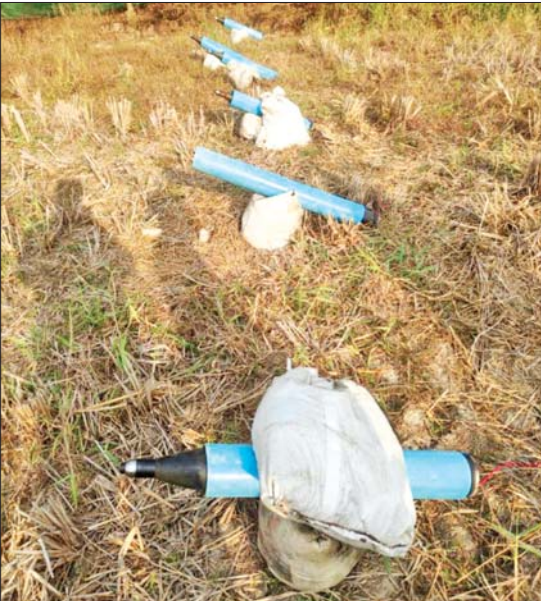
ရန်ကင်းမြို့နယ်(မြောက်)ကျေးရွာအနီး လယ်ကွင်း၌ ပစ်ခတ်ရန် ပြင်ဆင်ထားသည့် ရှော့တိုက်ခဲများကို တွေ့ရစဉ်။

နေပြည်တော် ဇူလိုင် ၂၁ အကြမ်းဖက်အုပ်စုအဖြစ် ကြေညာထားသော CRPHI NUG နှင့် ယင်းတို့၏ လက်အောက်ခံ PDF အမည်ခံအကြမ်းဖက်အဖွဲ့များ၊ ယင်းတို့နှင့်ဆက်သွယ်နေသော အဖွဲ့အစည်းများနှင့် လူပုဂ္ဂိုလ်များသည် နိုင်ငံတော် တည်ငြိမ်အေးချမ်းရေးကို ဖျက်ပြားစေရန်နှင့် ပြည်သူလူထုကို အကြောက်တရားများ ဖြစ်ပေါ်စေရန်အတွက် စစ်ရေးနှင့် မသက်ဆိုင်သည့် အများပြည်သူပိုင် အဆောက်အအုံများ၊ လမ်းတံတားများအား မီးရှို့ခြင်း၊ ဖောက်ခွဲဖျက်ဆီးခြင်း၊ ရှော့တိုက်ခဲများ၊ Drone များဖြင့် ပစ်ခတ်တိုက်ခိုက်ခြင်း စသည့် အကြမ်းဖက်လုပ်ရပ်များကို နည်းမျိုးစုံဖြင့် လုပ်ဆောင်လျက်ရှိသည်။ ထိုသို့ လုပ်ဆောင်လျက်ရှိရာ ရန်ကင်းမြို့နယ်(မြောက်)ကျေးရွာအနီးရှိ လယ်ကွင်းတွင် ချွဲ PC ပိုက်(အပြာ)စွပ်ထားသည့် မသင်္ကာဖွယ်ပစ္စည်းများတွေ့ရှိကြောင်း ယနေ့ နံနက် ၆ နာရီခန့်တွင် တာဝန်သိပြည်သူများ၏ သတင်းပေးချက်များအရ စာမျက်နှာ ၁၅ ကော်လံ ၁ သို့ ■