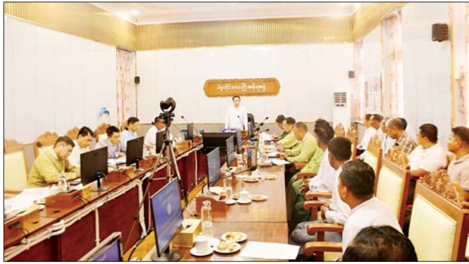
လိုအပ်ချက်များကို ဆွေးနွေးတင်ပြပေးစေလိုကြောင်း ပြောကြားသည်။ ထို့နောက် တိုင်းဒေသကြီး လုံခြုံရေးနှင့် နယ်စပ် ရေးရာဝန်ကြီးက လယ်ယာသုံးစက်ကိရိယာရောင်းချ

ပဲခူး ဖေဖော်ဝါရီ ၂၁ ပဲခူးတိုင်းဒေသကြီး လယ်ယာသုံးစက်ကိရိယာ လုပ်ငန်းရှင်များအသင်းဖွဲ့စည်းနိုင်ရေး ညှိနှိုင်းအစည်းအဝေးကို ယမန်နေ့နံနက်ပိုင်းက တိုင်းဒေသကြီး အစိုးရအဖွဲ့ရုံး အစည်းအဝေးခန်းမ၌ ကျင်းပသည်။ ဦးစွာ ပဲခူးတိုင်းဒေသကြီးဝန်ကြီးချုပ် ဦးမျိုးဆွေဝင်းက စိုက်ပျိုးရေးကိုအခြေခံသည့် တိုင်းဒေသကြီးဖြစ်၍ လယ်ယာသုံးစက်ကိရိယာ ထုတ်လုပ်ခြင်းကို ဦးစားပေးမြှင့်တင်ဆောင်ရွက်ပေး လျက်ရှိကြောင်း၊ ပြည်ပသွင်းကုန်အစားထိုး ပြည်တွင်း ထုတ်လုပ်ယာသုံးစက်ကိရိယာများ ထပ်မံတီထွင် ထုတ်လုပ်နိုင်ရေး၊ နည်းပညာနှင့် အရင်းအနှီး မတည့် ငွေများ တိုးတက်ရရှိရေးအတွက် ပဲခူးတိုင်းဒေသကြီး လယ်ယာသုံးစက်ကိရိယာ လုပ်ငန်းရှင်များအသင်း ဖွဲ့စည်းပေးနိုင်ရေး ဆောင်ရွက်ရခြင်းဖြစ်ကြောင်း၊ လယ်ယာသုံးစက်ကိရိယာ လုပ်ငန်းရှင်များအနေဖြင့်