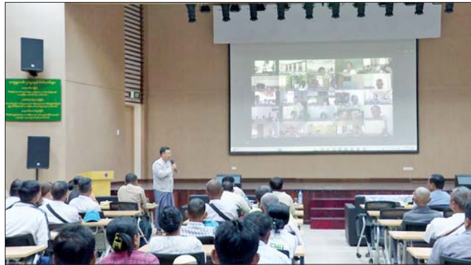
ပျားနှင့် အင်းဆက်ပိုးမွှားများ သီးနှံအထွက်နှုန်းများ သိသိ သာသာ တိုးတက်လာကြောင်း၊ ယနေ့တွင် ပညာရှင်များက ပျားနှင့် အင်းဆက်/သတ္တဝါများ၏ ဂေဟ စနစ်အတွင်း အရေးပါမှုနှင့်

နေပြည်တော် ဖေဖော်ဝါရီ ၂၁ (၁၀၂)ကြိမ်မြောက် တောင်သူ နည်းပညာပေးဆွေးနွေးပွဲကို ယနေ့ တွင် နေပြည်တော် စေယျာသီရိ မြို့နယ် ရေဆင်းရီ စိုက်ပျိုးပညာ ပေးရေးနှင့် ကျေးလက်ဒေသ ဖွံ့ဖြိုး ရေးသင်တန်းကျောင်း (AERDTC) ခန်းမ၌ကျင်းပရာ စိုက်ပျိုးရေး၊ မွေးမြူရေးနှင့် ဆည်မြောင်း ဝန်ကြီးဌာန ဒုတိယဝန်ကြီး ဒေါက်တာတင်ထွဋ်က အဓိကရုံးမှ တက်ရောက်သည်။ ဆွေးနွေးပွဲတွင် ဒုတိယဝန်ကြီး ဒေါက်တာတင်ထွဋ်က သီးနှံများ အထွက်တိုးရေးအတွက် ဂေဟစနစ် ဖွံ့ဖြိုးရေးနှင့် ဝတ်မှုန်ကူးမှု အထောက်အကူပြုသော ပျားနှင့် အင်းဆက်/သတ္တဝါများ၏ အခန်း ကဏ္ဍသည် အရေးကြီးကြောင်း၊