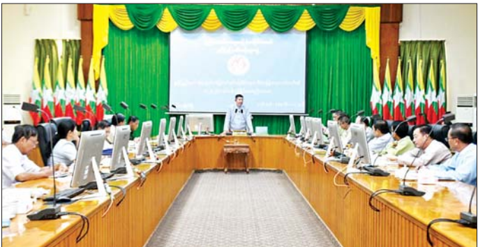
များအနေဖြင့် ဥပဒေပါပြဋ္ဌာန်းချက်များနှင့်အညီ ပိုင်းဝန်းဆွေးနွေးဆုံးဖြတ်ပေးရန် လိုအပ်ကြောင်း၊ ပြည်နယ်အတွင်းရှိ မြေလွတ်၊ မြေလပ်နှင့် မြေရိုင်းများ

မော်လမြိုင် ဇန်နဝါရီ ၁၇ မွန်ပြည်နယ် မြေလွတ်၊ မြေလပ်နှင့်မြေရိုင်းများ စီမံခန့်ခွဲရေးကော်မတီ အမှတ်စဉ်(၁၂၀၂၆) လုပ်ငန်း ညှိနှိုင်းအစည်းအဝေးကို ဇန်နဝါရီ ၁၅ ရက်မွန်းလွဲ ပိုင်းက ပြည်နယ်အစိုးရအဖွဲ့ရုံး အောင်ဆန်းခန်းမ၌ ကျင်းပသည်။ အစည်းအဝေးတွင် မွန်ပြည်နယ် မြေလွတ်၊ မြေလပ်နှင့်မြေရိုင်းများ စီမံခန့်ခွဲရေးကော်မတီ ဥက္ကဋ္ဌ ပြည်နယ်ဝန်ကြီးချုပ် ဦးအောင်ကြည်သိန်းက နိုင်ငံတော် စီးပွားဖွံ့ဖြိုးတိုးတက်ရေးအတွက် မြေလွတ်၊ မြေလပ်နှင့် မြေရိုင်းများကို စိုက်ပျိုးရေးနှင့် မွေးမြူရေးလုပ်ငန်းများကို ထိရောက်မှုနိမ့်ကျစွာ အသုံးချစီမံဆောင်ရွက်နိုင်ရန်နှင့် တင်ပြလာသည့် ကိစ္စရပ်များအတွက် စိစစ်သုံးသပ်ခြင်းနှင့် ညှိနှိုင်း ဆောင်ရွက်ခြင်းများကို မွန်ပြည်နယ် မြေလွတ်၊ မြေလပ်နှင့် မြေရိုင်းများ စီမံခန့်ခွဲရေးကော်မတီဝင်