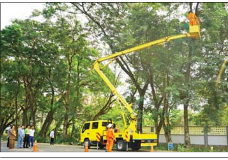
မိတ္ထီလာမြို့တွင်းလမ်းပိုင်း လမ်းဘေးဝဲ / ယာရှို သစ်ပင်အကိုင်အခက်များ ခုတ်ထွင်ရှင်းလင်း

မိတ္ထီလာ ဇန်နဝါရီ ၁၇ မန္တလေးတိုင်းဒေသကြီး မိတ္ထီလာမြို့နယ်၌ ရန်ကုန်-မန္တလေး