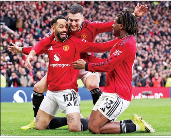
မန်ယူအသင်းကစားသမားများ ဂိုးသွင်းပြီး အောင်ပွဲခံနေစဉ်။

မန်ယူအသင်းနဲ့ မန်စီးတီး အသင်းတို့ ဇန်နဝါရီ ၁၇ ရက် ညပိုင်းက ယှဉ်ပြိုင်ကစားခဲ့တဲ့ မန်ချက်စတာဒါလီပွဲစဉ်မှာ မန်ယူ အသင်းက အိမ်ကွင်းအိုးထရက်ဖွဲ့၌ မှာ မန်စီးတီးအသင်းကို နှစ်ဂိုးပြတ် အနိုင်ရရှိခဲ့ပါတယ်။