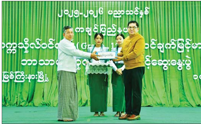
ထိုနေ့က ပြည်နယ်ဝန်ကြီးချုပ်၊ ပြည်နယ် တရားလွှတ်တော် တရားသူကြီးချုပ်၊ ပြည်နယ် ဝန်ကြီးများသည် မြစ်ကြီးနားမြို့ တပ်ကုန်းရပ်ကွက် အတွင်းရှိ BWI BAN (ဘွေဗန်) Hotel အစည်းအဝေး ခန်းမ၌ ကျင်းပပြည်နယ်ဆောင်ရွက်ရေးဆိုင်ရာ လုပ်ငန်းရှင်များအသင်း (MCEF) ၏ နှစ်ပတ်လည်

ဦးစွာ ပြည်နယ်ဝန်ကြီးချုပ် ဦးခက်ထိန်နန်က အမှာစကားပြောကြားပြီး မြစ်ကြီးနားတက္ကသိုလ် ပါမောက္ခချုပ် ဒေါက်တာအောင်ဝင်းက တက္ကသိုလ်ဝင်တန်း အောင်ချက်မြင့်မားရေးအတွက် သင်ကြားသင်ယူမှုဆိုင်ရာ ဆွေးနွေးပွဲချပေးသွားမည့် အစီအစဉ်များနှင့် လုပ်ငန်းအစီအမံများကို ရှင်းလင်းတင်ပြပြီး ပြည်နယ်ဝန်ကြီးချုပ်က ဆွေးနွေးပွဲအတွက် ငွေကျပ် သိန်း ၃၀ ကို ထောက်ပံ့ပေးပေးသည်။