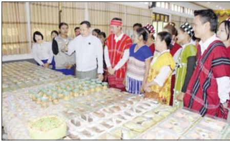
သင်တန်းသားများ ကိုယ်စား သင်တန်းဆင်း လက်မှတ်များ သင်တန်းသား တစ်ဦးအား ပေးအပ်ကာ သင်တန်းသား