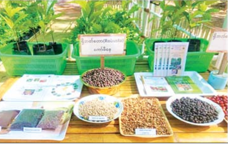
ရန်ကုန်တိုင်းဒေသကြီး တိုက်ကြီးမြို့နယ်အတွင်း ရော်ဘာပင်များကြား သီးညှပ်စိုက်ပျိုးသည့် ရိဘတ်စတာကော်ဖီပင်များနှင့် ကော်ဖီစေ့များကို တွေ့ရစဉ်။