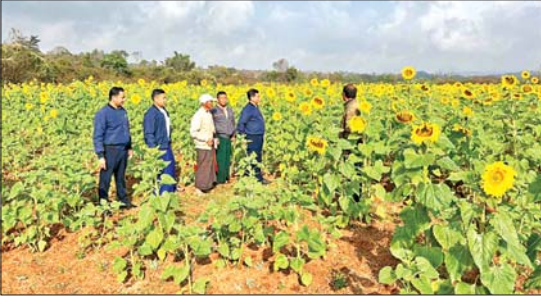
ကိုယ်ပိုင် အုပ်ချုပ်ခွင့်ရဒေသ ပင်းတယ် မြို့နယ် သမဝါယမအသင်းမှ လိုအပ်သည့် ရှိသည့် ကွင်းဆင်းကြည့်ရှုစစ်ဆေးရာ တွင် များ ပေါင်းစပ်ညှိနှိုင်းမှုကြားခဲ့ကြောင်း သက်ဆိုင်ရာ မြို့နယ်သမဝါယမအသင်းမှ သိရသည်။

တောင်ကြီး ဇန်နဝါရီ ၁၇ ရှမ်းပြည်နယ် (တောင်ပိုင်း) ဇန ကိုယ်ပိုင် အုပ်ချုပ်ခွင့်ရဒေသ ပင်းတယ် မြို့နယ် ကျေးရွာအုပ်စုရှိ ရောင်ခြည်ဦး လယ်ယာနှင့် အထွေထွေလုပ်ငန်း သမဝါယမအသင်းလီမိတက်က ဆောင်း နေကြော့ဆောင်းစပ်မျိုး(၁) စိုက်ပျိုးထား ရှိမှုအခြေအနေများကို ဇန်နဝါရီ ၁၆ ရက် နံနက်ပိုင်းတွင် တာဝန်ရှိသူများက ကွင်းဆင်းကြည့်ရှုစစ်ဆေးသည်။