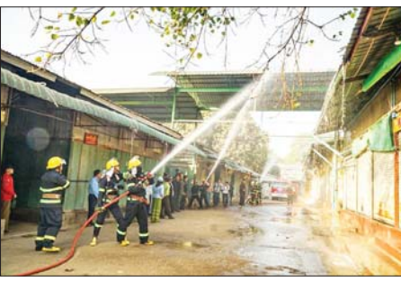
မကွေးတိုင်းဒေသကြီး ပခုက္ကူမြို့ အမှတ်(၁)စည်ပင်သာယာ

ပခုက္ကူ ဇန်နဝါရီ ၁၇ မကွေးတိုင်းဒေသကြီး ပခုက္ကူမြို့ အမှတ်(၁)စည်ပင်သာယာ