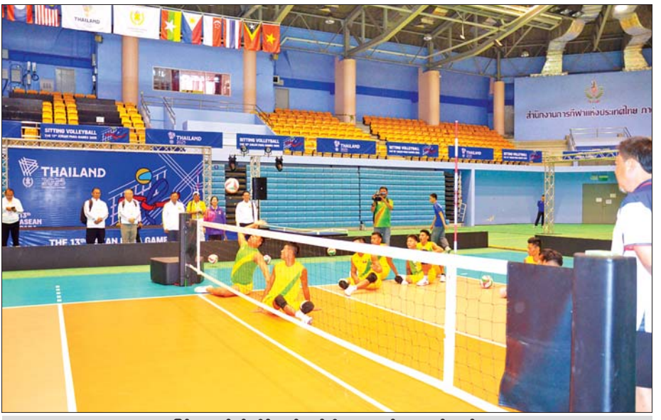
မြန်မာမသန်စွမ်းအားကစားအဖွဲ့ဝင်များဘော်လီဘောအသင်း လေ့ကျင့်နေစဉ်။

ဦးစွာ မြန်မာနိုင်ငံမသန်စွမ်းအားကစားအဖွဲ့ချုပ်ဥက္ကဋ္ဌနှင့် အဖွဲ့ဝင် များသည် ယနေ့နံနက်ပိုင်းတွင် နာခွန်ရစ်ချာဆီးမား (ခိုရတ်)မြို့ Kantary Hotel Korat တွင် တည်းခိုနေထိုင်လျက်ရှိသော မြန်မာ မသန်စွမ်းအားကစားအသင်းမှ အုပ်ချုပ်/နည်းပြအားကစားသမားများနှင့် ရင်းရင်းနှီးနှီး တွေ့ဆုံ၍ အားပေးစကားပြောကြားကာ လိုအပ်သည်များ ဖြည့်ဆည်းဆောင်ရွက်ပေးခဲ့ပြီး Rajmangala University of Technology ရှိ ဘောလုံးလေ့ကျင့်ရေးကွင်းတွင် လေ့ကျင့်နေသော မြန်မာမသန်စွမ်း (၇) ယောက်တစ်ဖက် ဘောလုံးအသင်း၏အသင်းလိုက် လေ့ကျင့်နေမှုများကိုလည်းကောင်း၊ Majesty the King's 80 th Birthday Anniversary Commemorative Stadium အတွင်းရှိ ဘော်လီဘောရုံ တွင် လေ့ကျင့်လျက်ရှိသော မြန်မာမသန်စွမ်းအားကစားဘော်လီဘော အသင်း၏ အသင်းလိုက်လေ့ကျင့်နေမှုများကိုလည်းကောင်း လိုက်လံကြည့်ရှုအားပေးခဲ့ပြီး မိမိတို့လေ့ကျင့်ထားသည့်အတိုင်း စာမျက်နှာ ၁၇ ကော်လံ ၁ သို့ ❖