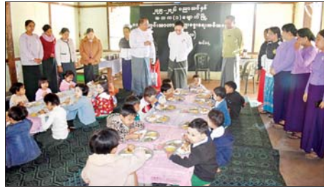
ချောက်မြို့နယ်၌ ကျောင်းသား ကျောင်းသူများအား ကျောင်းတွင်းအာဟာရ ကျွေးမွေး